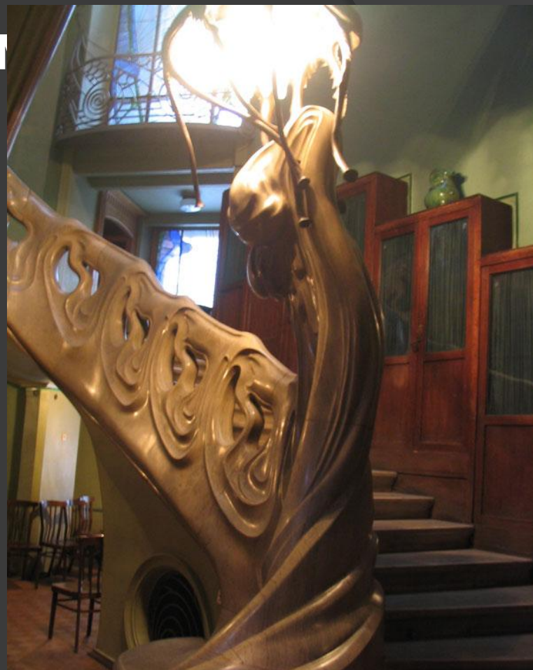
Главной изюминкой дома стала парадная лестница холла, выполненная в форме волны.