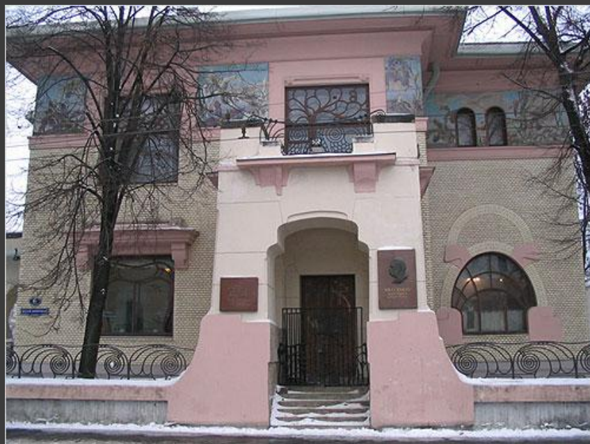
Особняк С.П. Рябушинского. 1902 – 1906 гг.