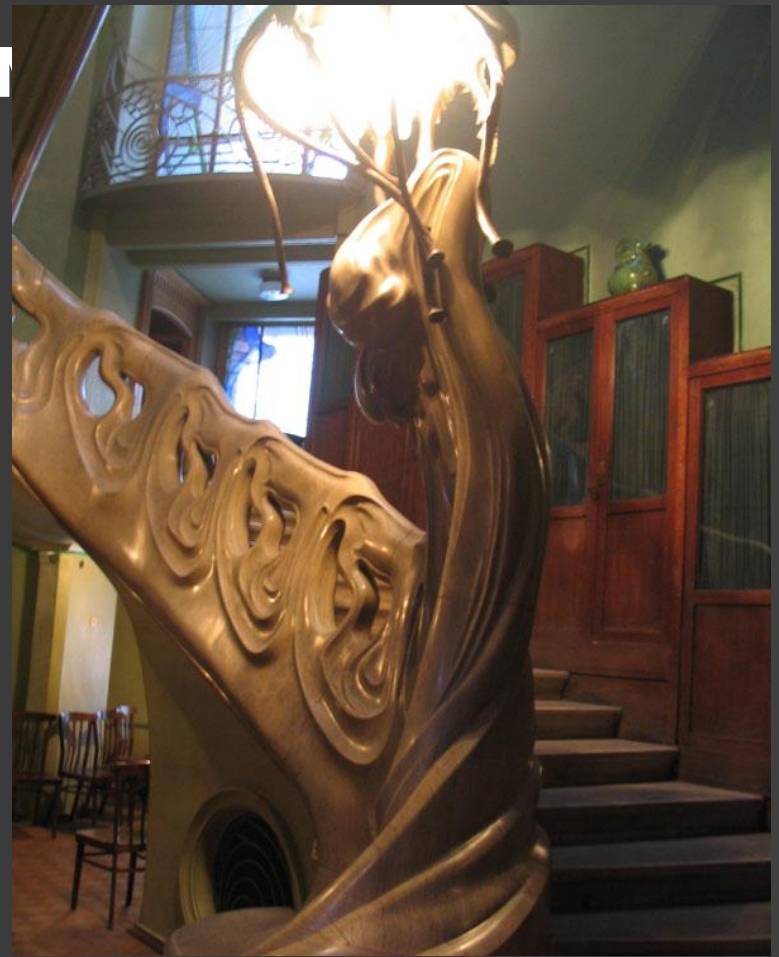
Главной изюминкой дома стала парадная лестница холла, выполненная в форме волны.