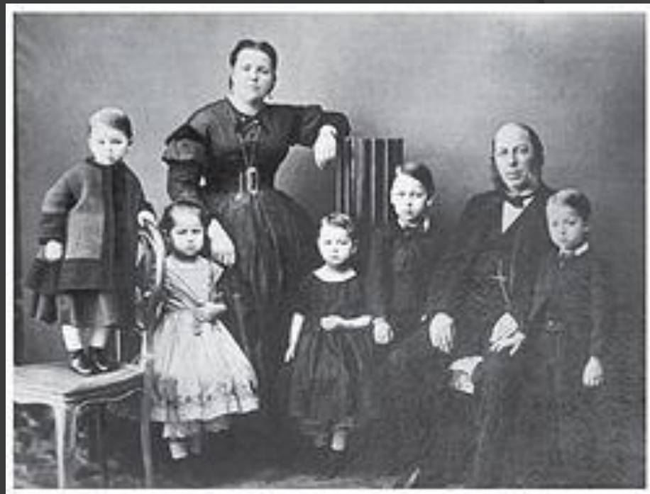
Семья Осипа Шехтеля в 1865 году. Будущий зодчий стоит справа от отца