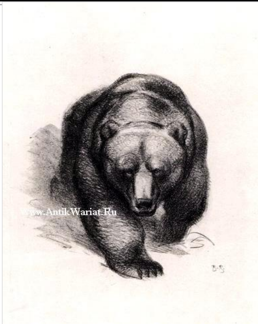
Рисунок основан на выразительных возможностях