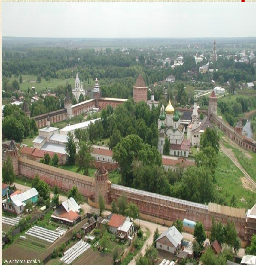
Кремль города Владимира