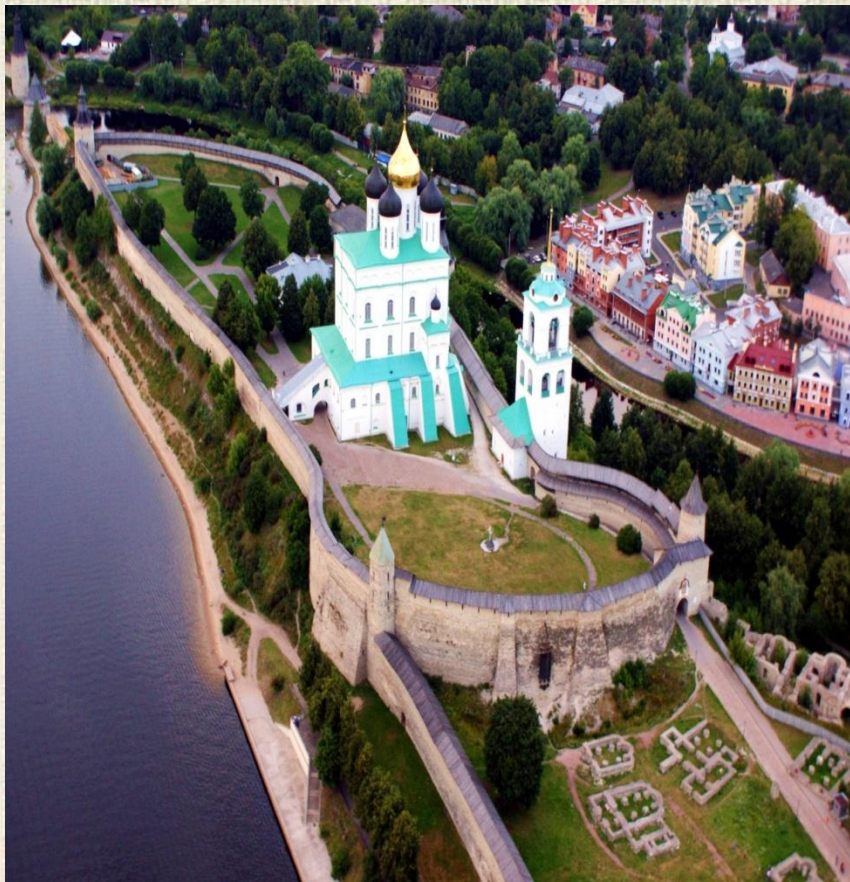
Кремль города Пскова