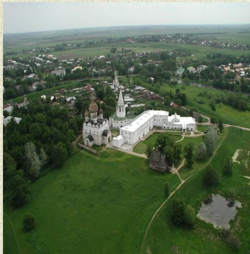
Кремль города Суздаль