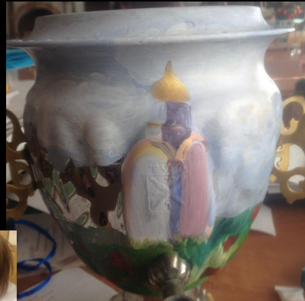
Фрагмент вертикального изображения