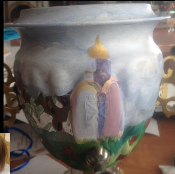
Фрагмент вертикального изображения