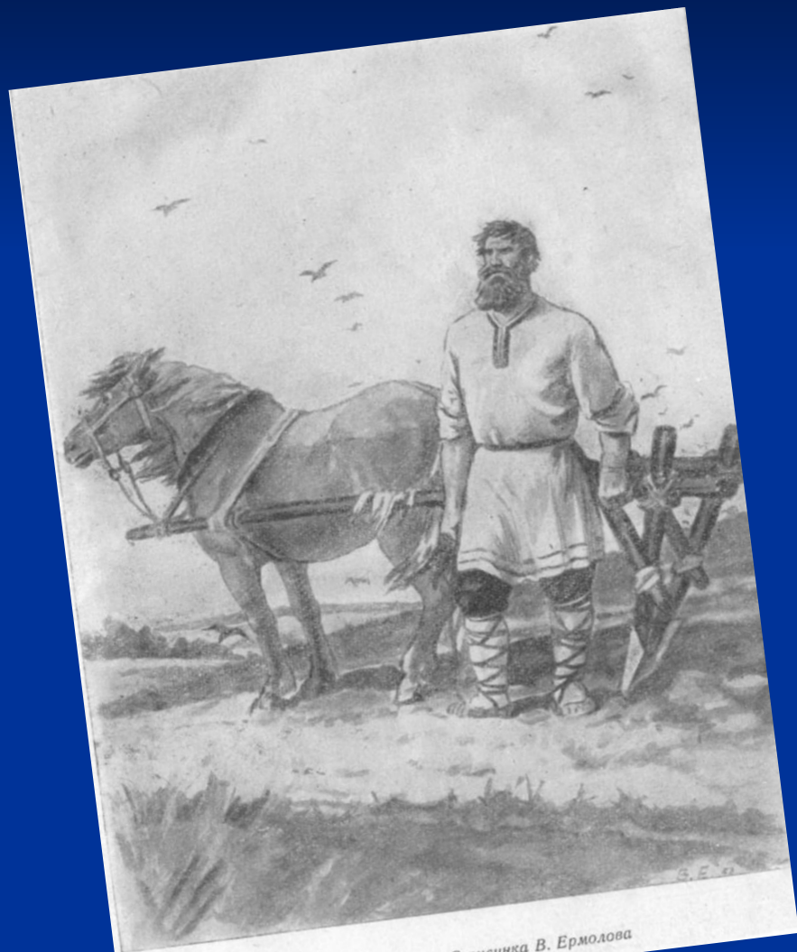
Микула Селянинович. С рисунка В. Ермолова