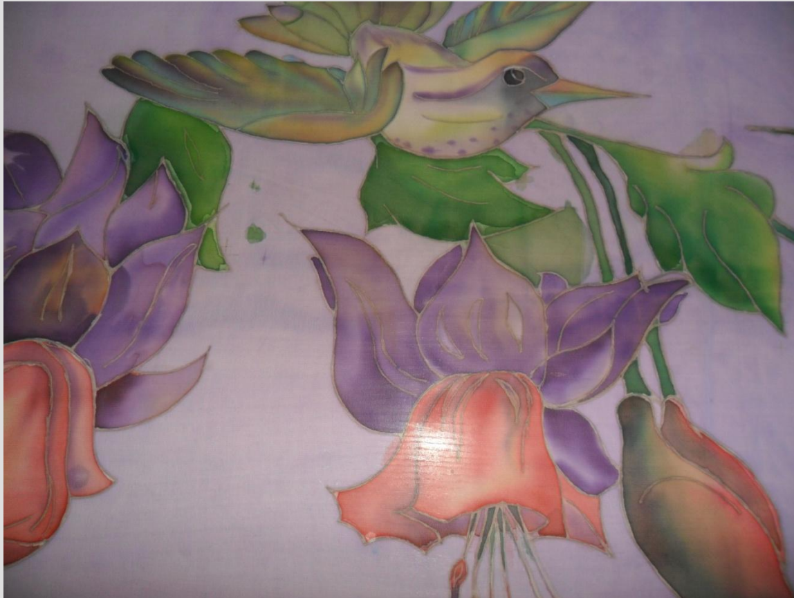
Фрагмент палантина «Колибри»