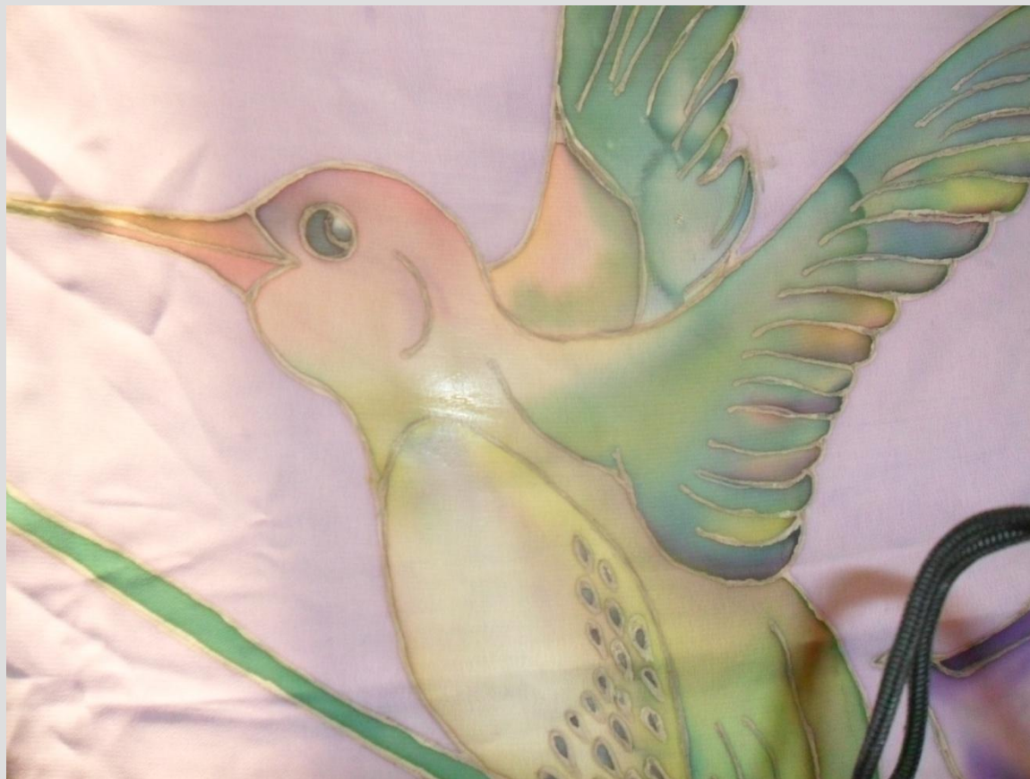
Фрагмент палантина «Колибри»