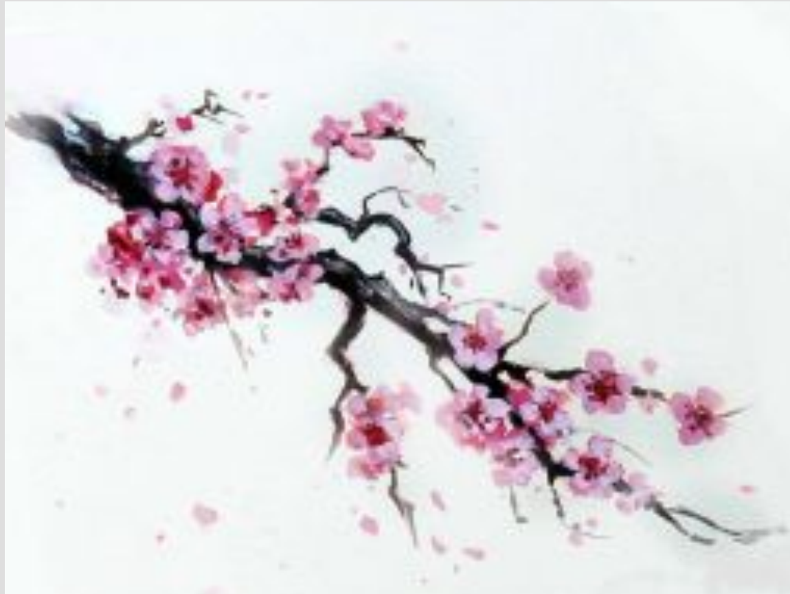
Цветущая ветка сакуры