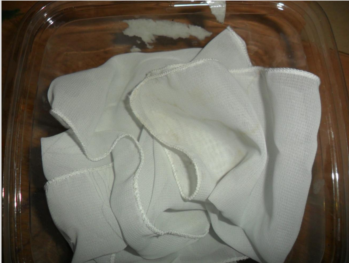
Обработка ткани в солевом растворе