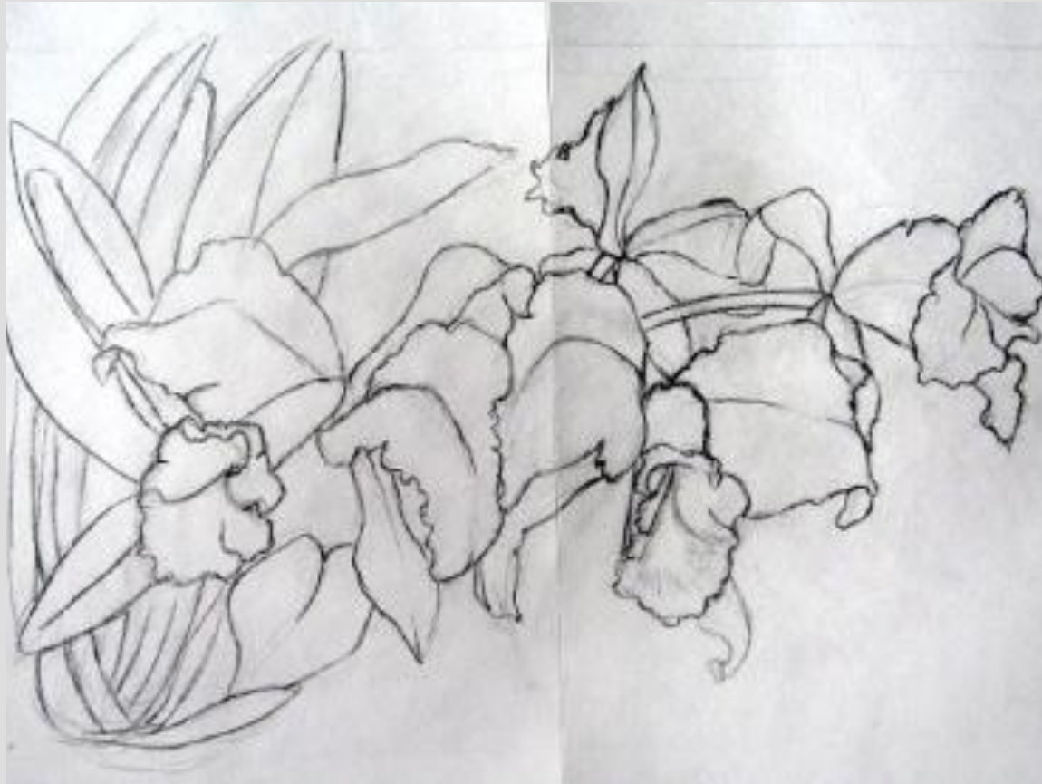
Шаблон для росписи