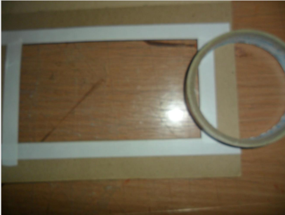
Закрепление фрагмента ткани в прорезном окне будущей открытки