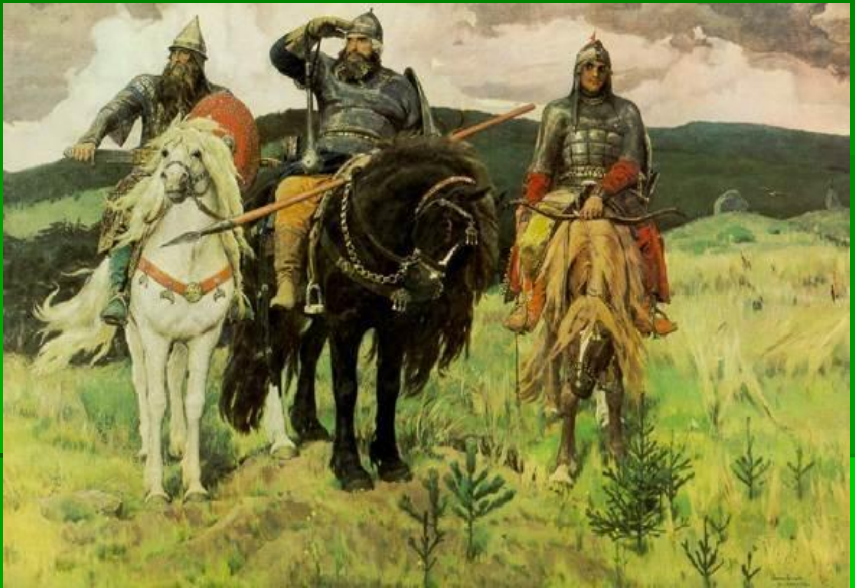
В. М. Васнецов «Богатыри»