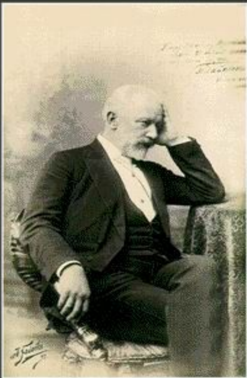
Пётр Ильич Чайковский