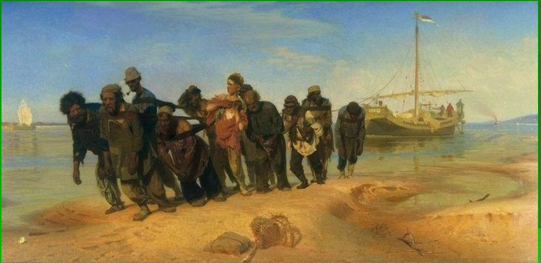
И. Репин «Бурлаки на Волге»