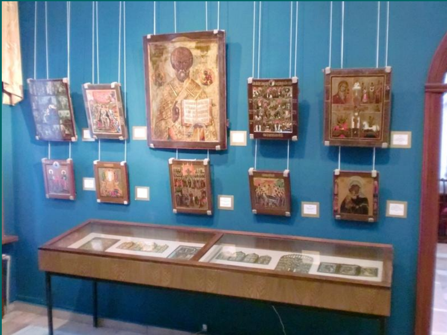
Одним из старейших экспонатов является икона святителя Николая.