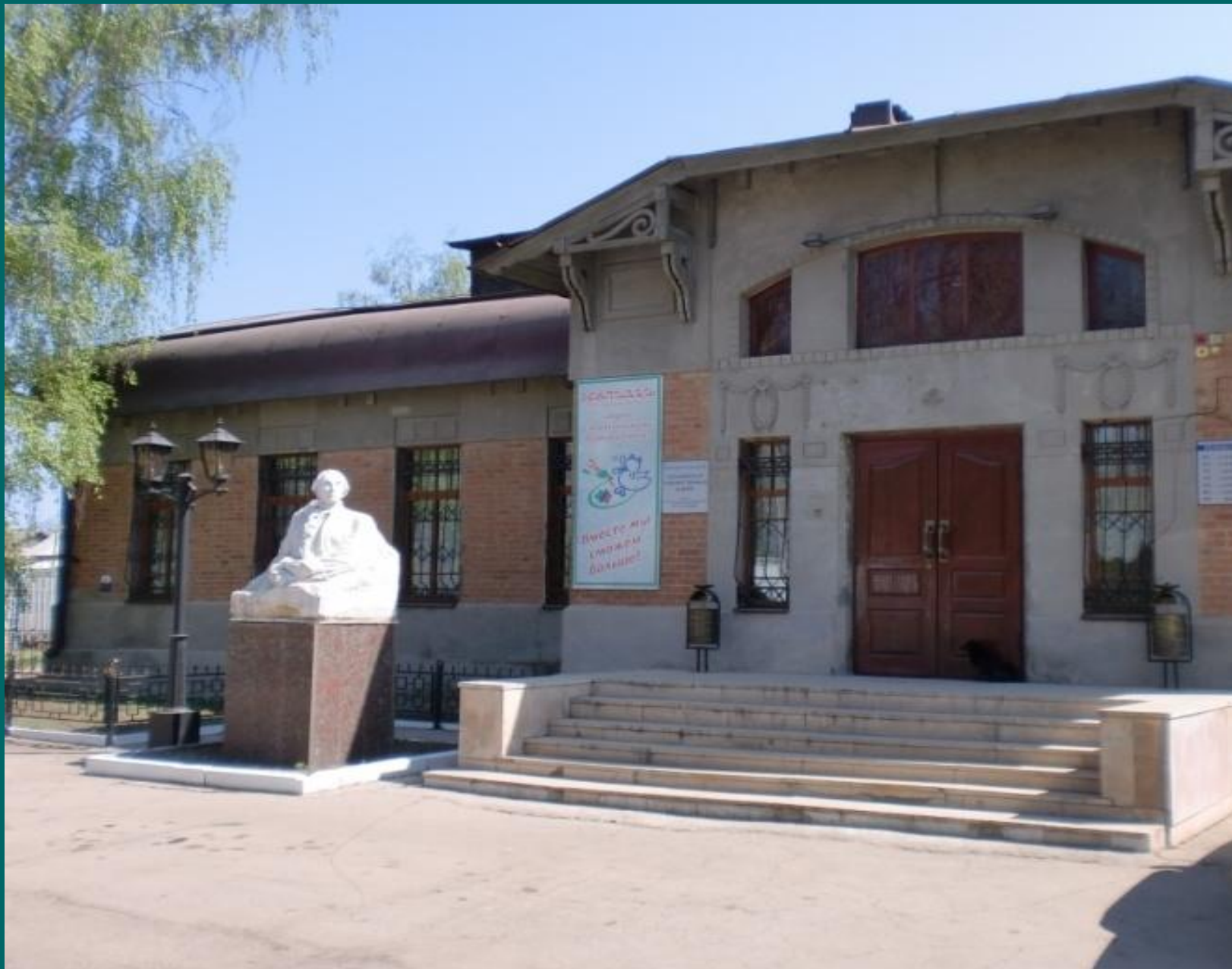
Филиал музея имени Радищева А.Н. открыт 3 июня 1977года в здании бывшего банка. Построен в стиле модерн и неоклассики.