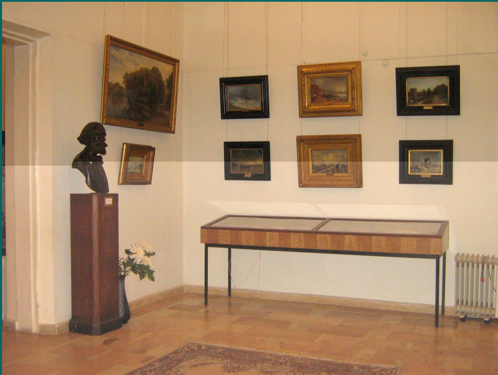
Отдельный зал отдан работам А.П.Боголюбова