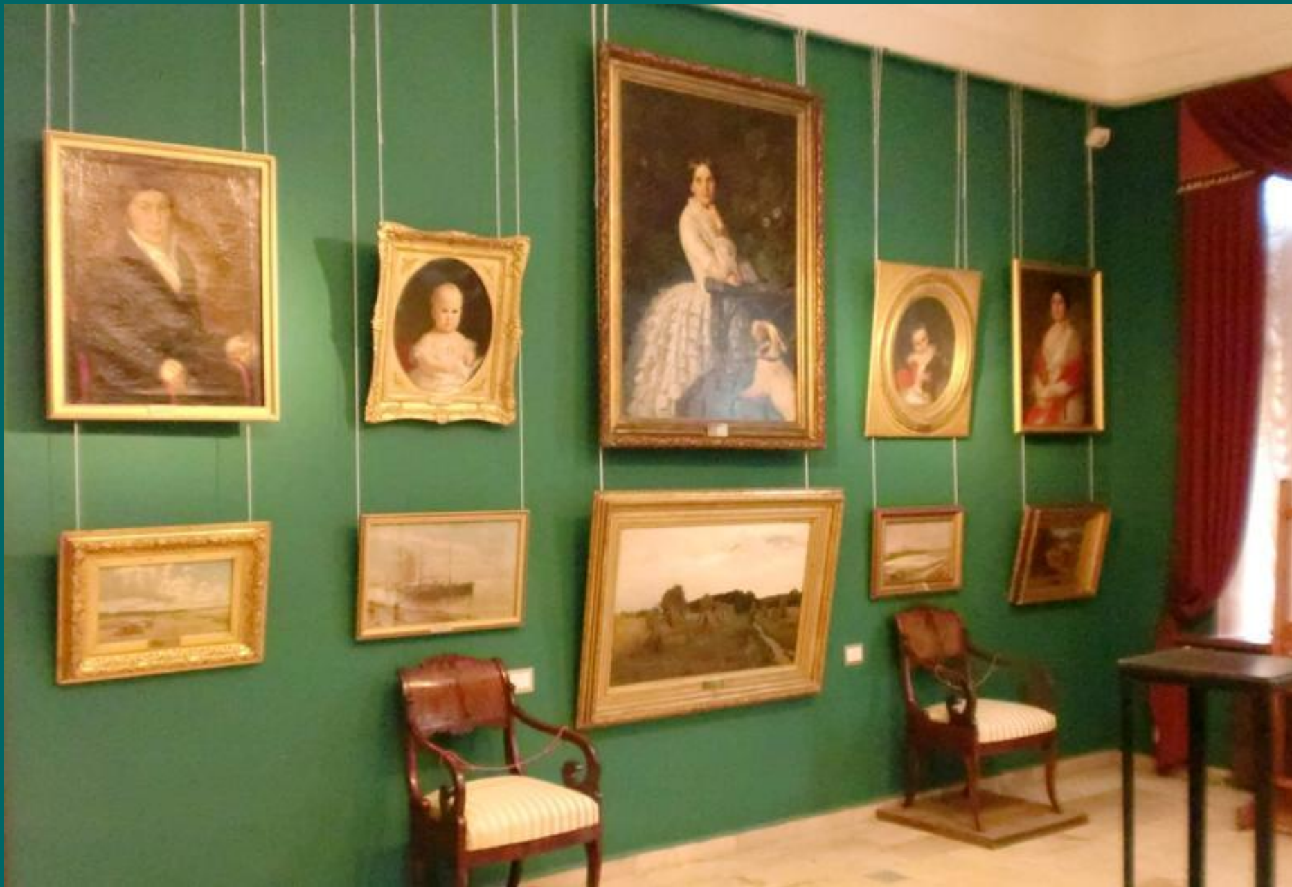
Большой зал. Вторая половина XIX – начало XX в.