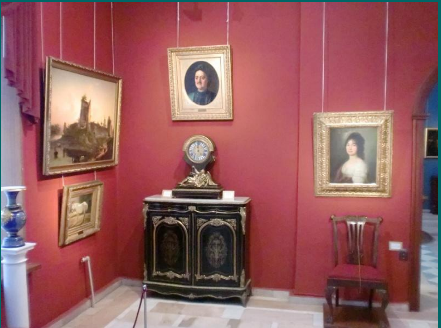
Зал русского искусства XVIII- первой половины XIX в.