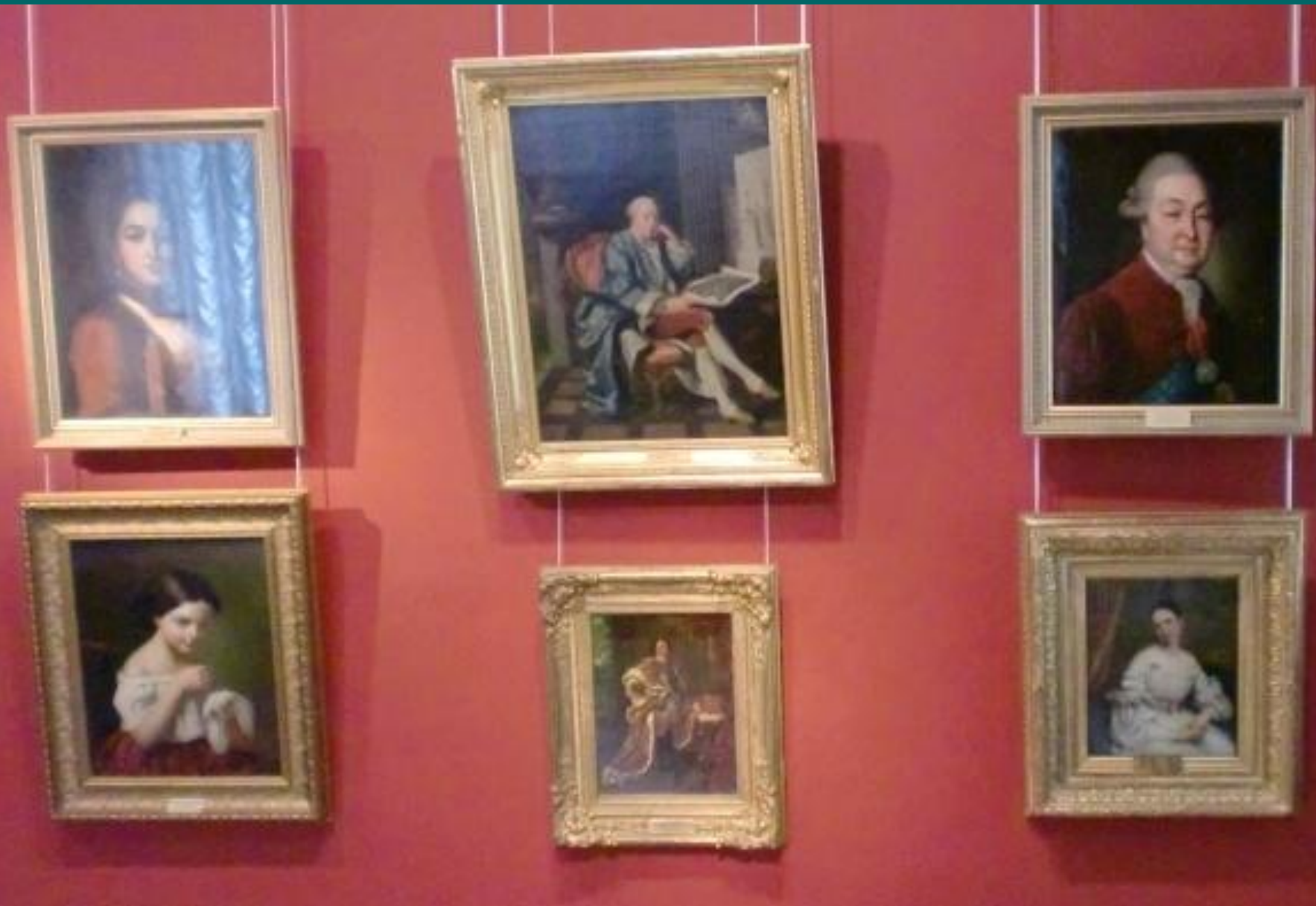
Экспозиция русского портрета XVIII века.