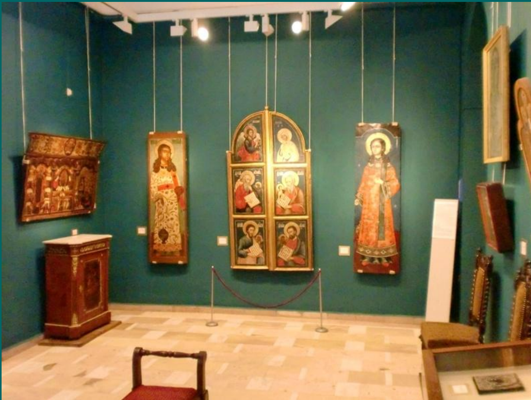
Зал древнерусского искусства.