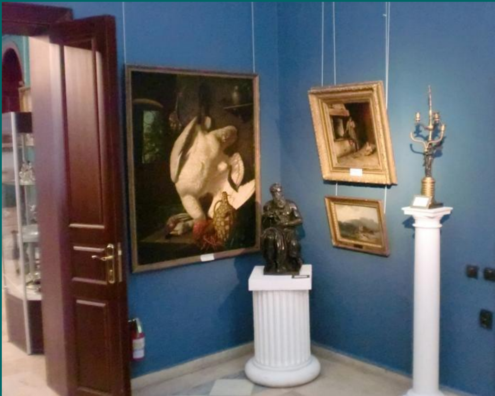
Зал западноевропейской живописи XVIII-XIX в.