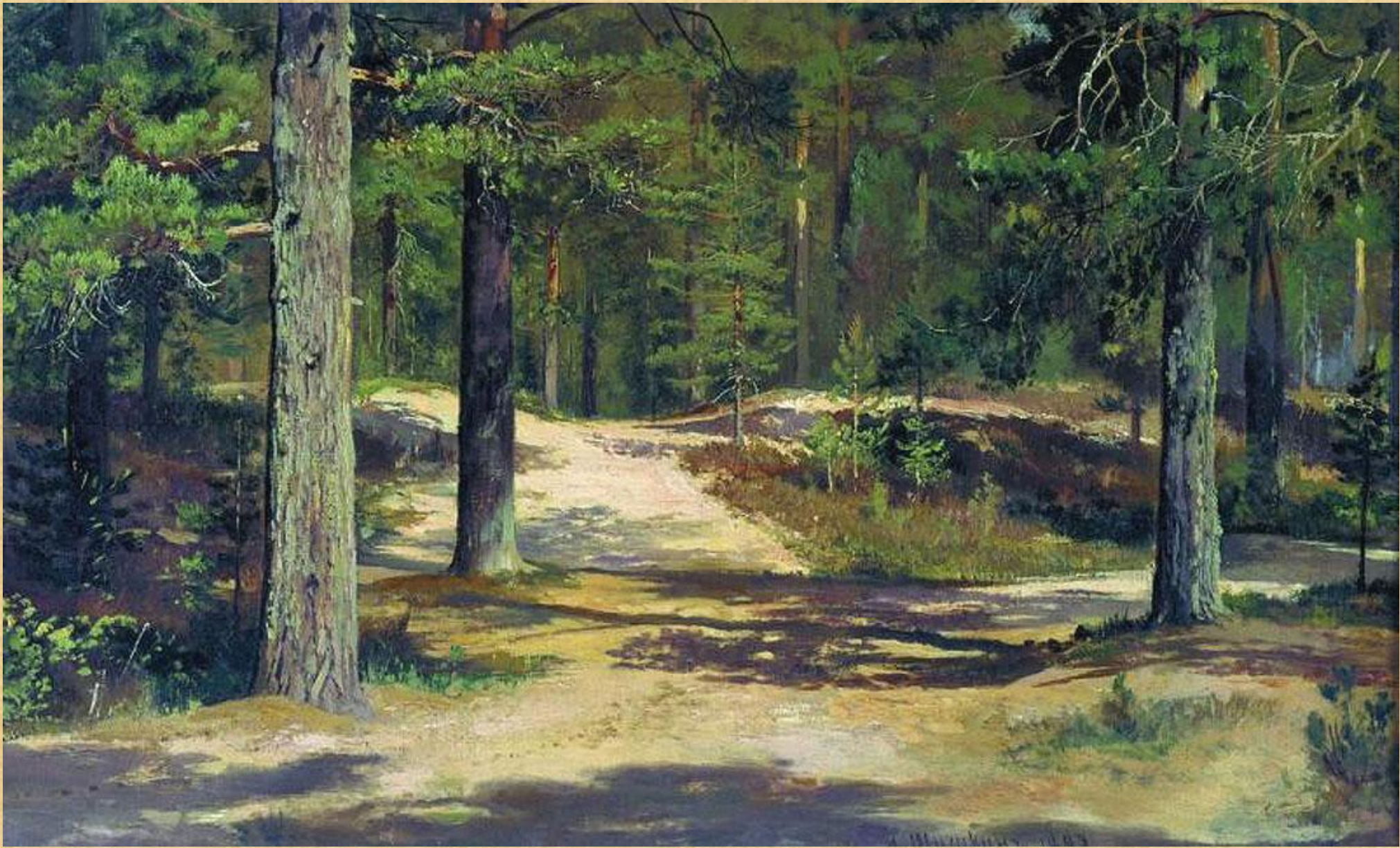
«Сосновый лес», Источник: https://allpainters.ru/shishkin-ivan.html