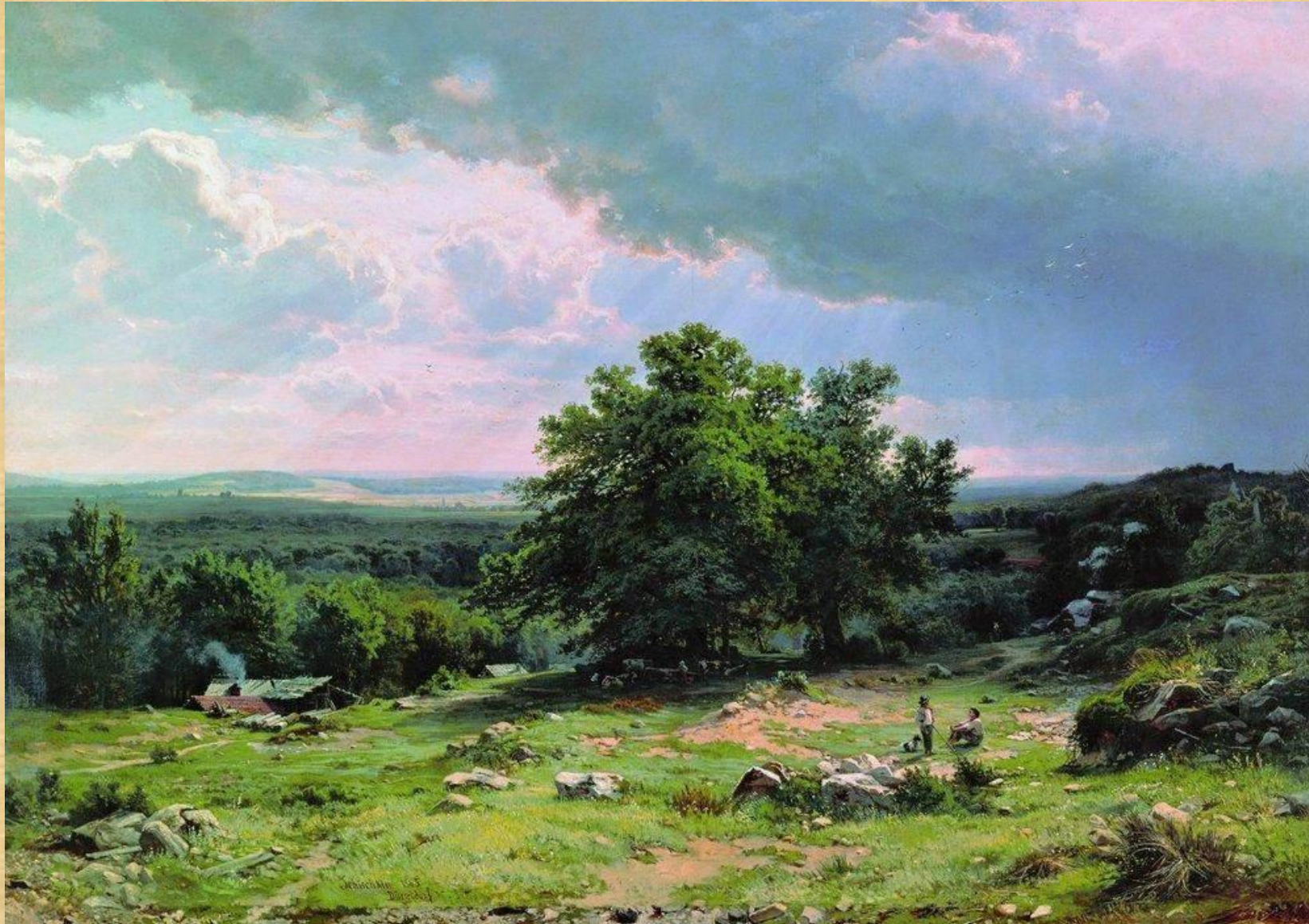
«Вид в окрестностях Дюссельдорфа»

В 1860 году Шишкин получил важную награду – золотую медаль Академии. Художник направляется в Мюнхен. Потом – в Цюрих. Всюду занимается в мастерских самых известных художников того времени. За картину «Вид в окрестностях Дюссельдорфа» он вскоре получил звание академика.