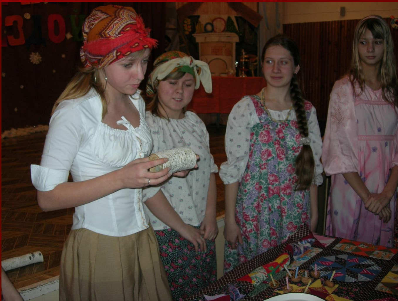
Гадание на поленьях

- А как гадали-то, бывало, судьбу свою хотели узнать? В зеркало, в блюдце, в чашку глядели.