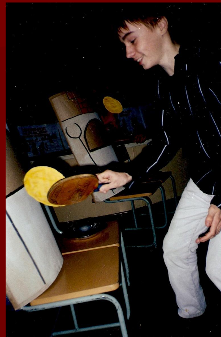
Игра «Испеки блины»