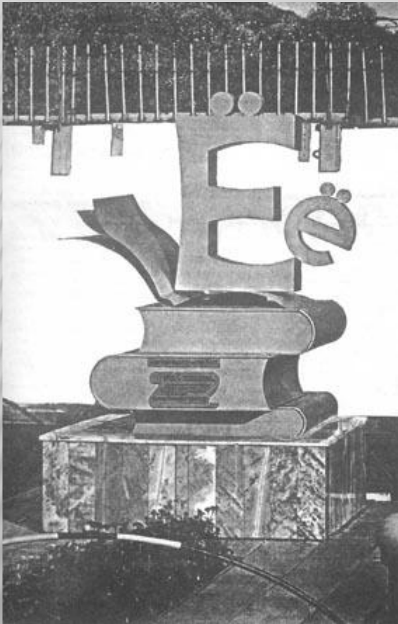
Памятник букве "Ё" в Перми