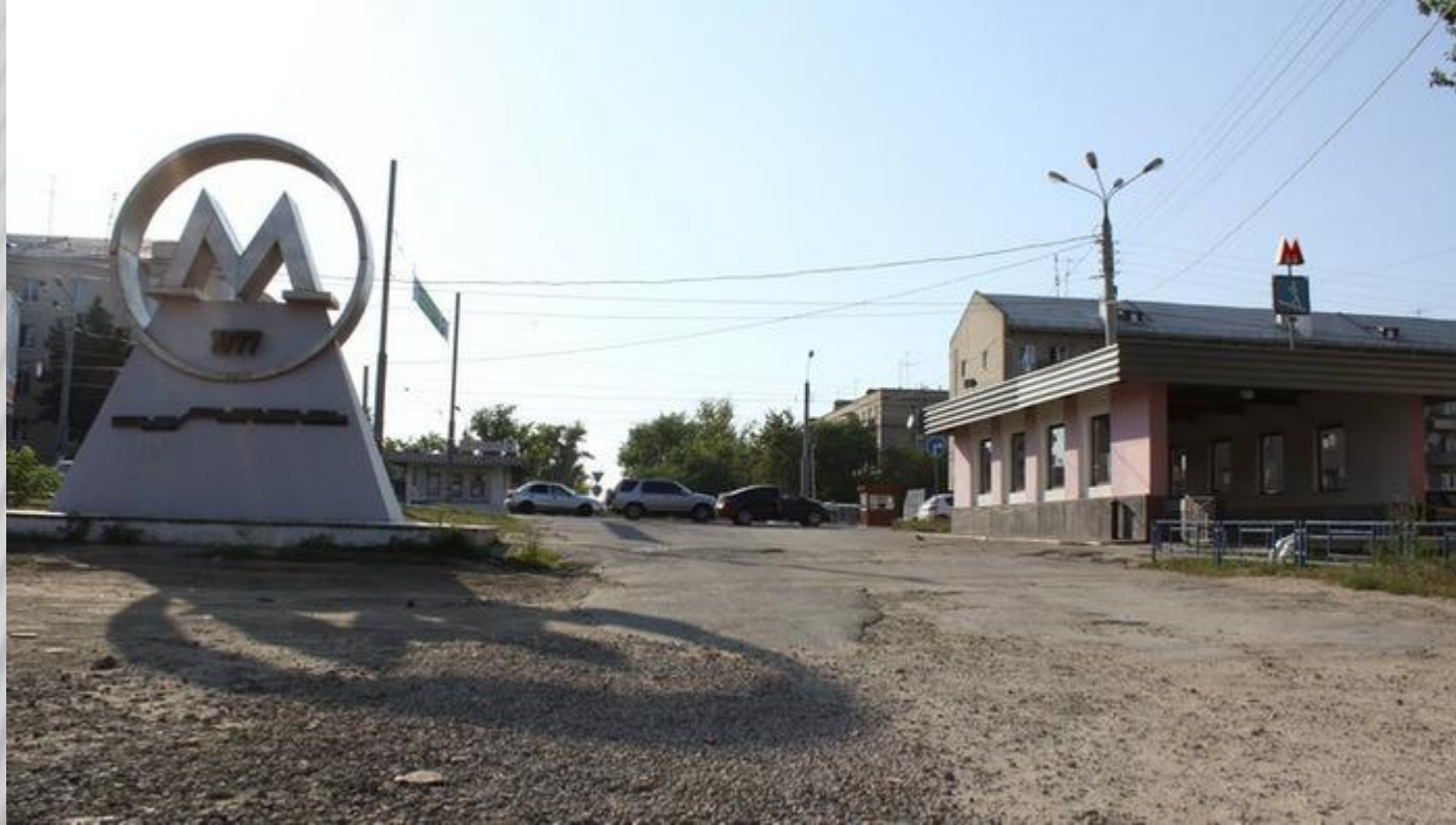
Буква "М" в Нижнем Новгороде