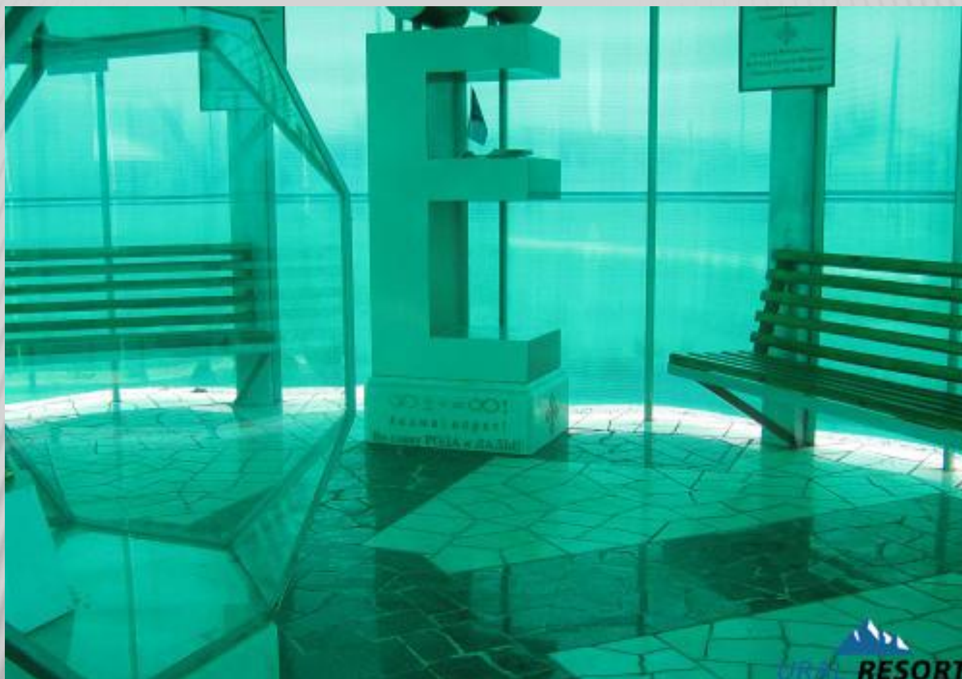
Храм буквы "Ё" в Челябинской области