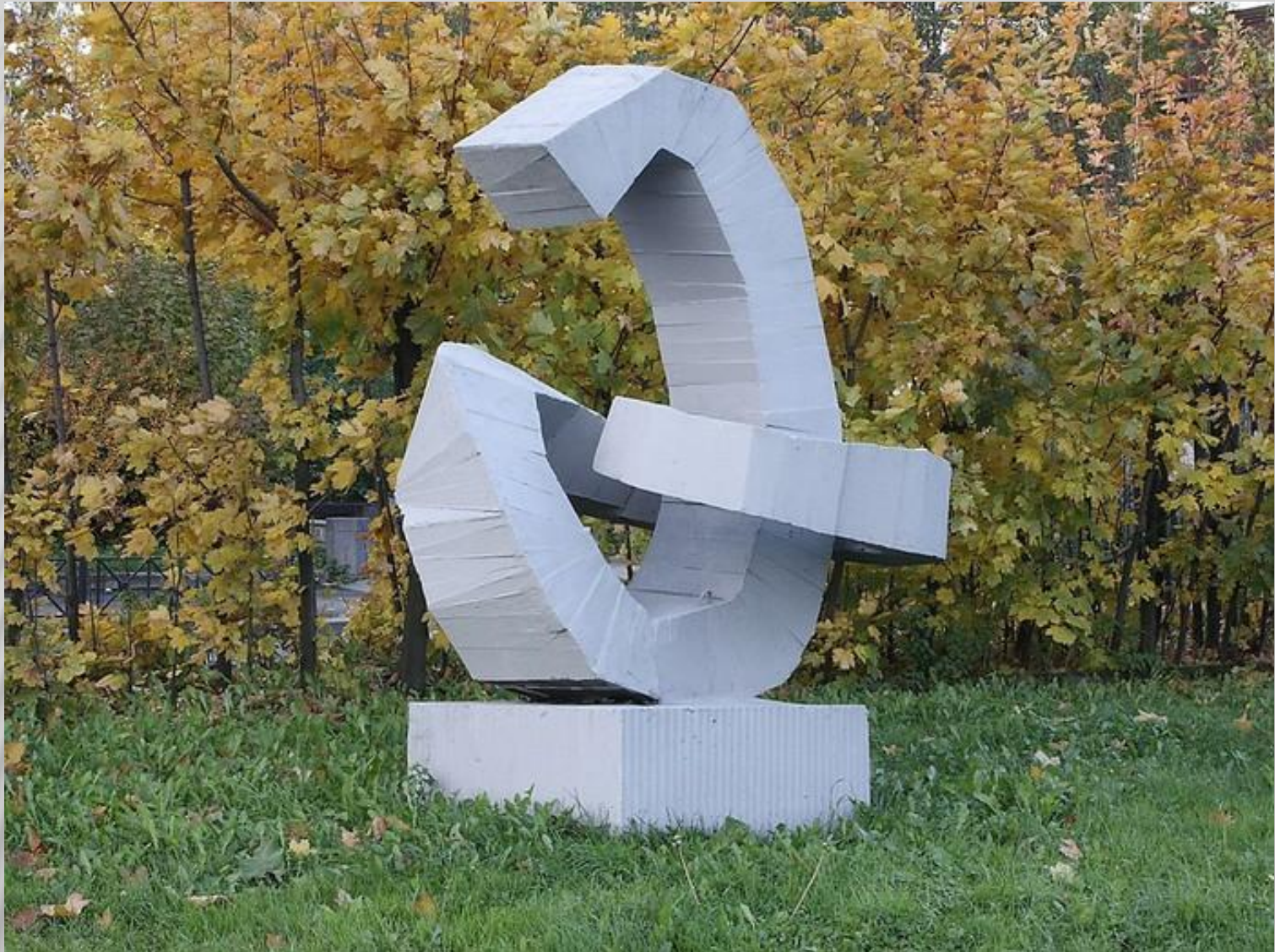
Буква "Э" в Санкт-Петербурге