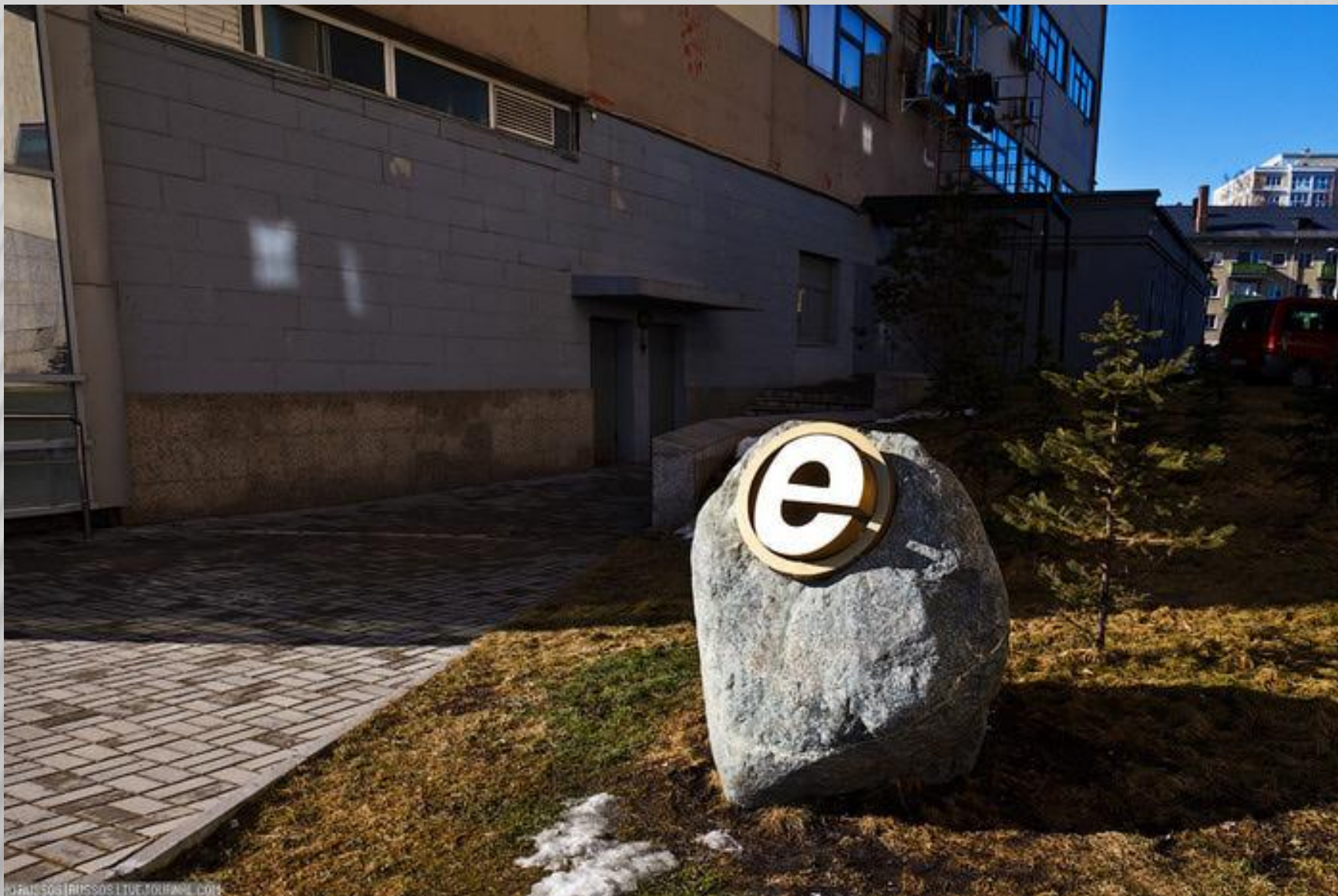
Памятник букве "Е" в Калининграде