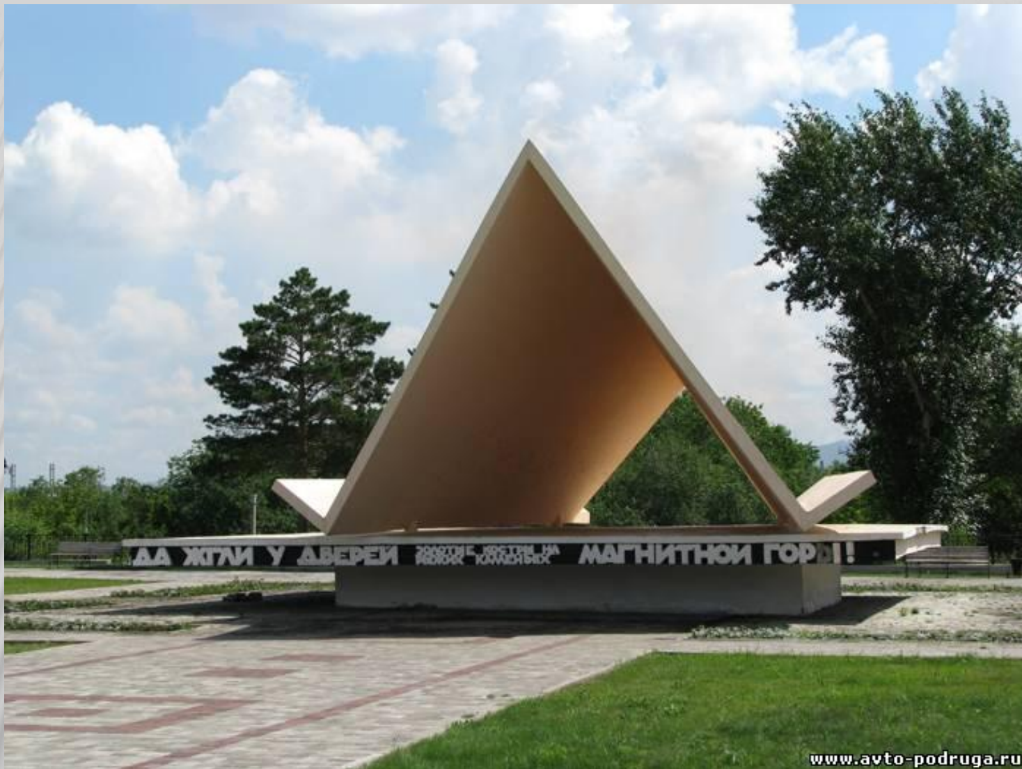
Буква "Л" в Магнитогорске