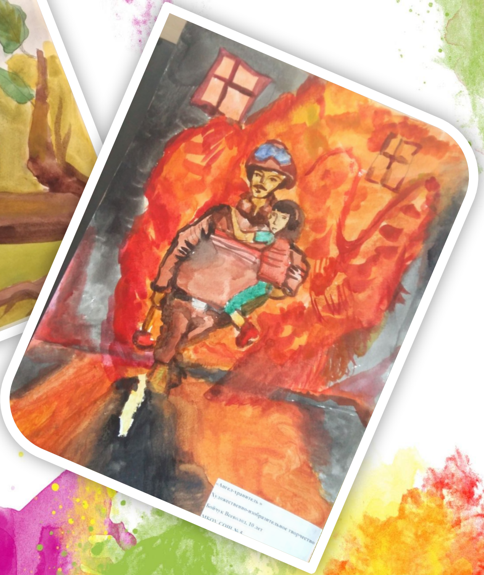
«Ангел-хранитель» Условно-художественно-образительное творчество бойца Ветерана, 10 лет МЭДХ, СДОН № 2