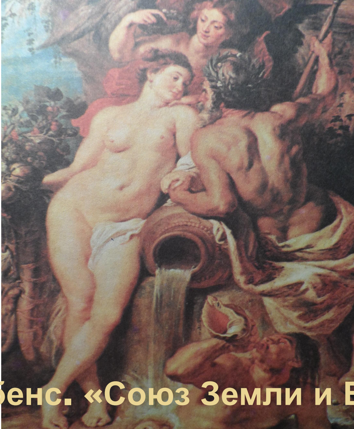
Рубенс. «Союз Земли и Воды»