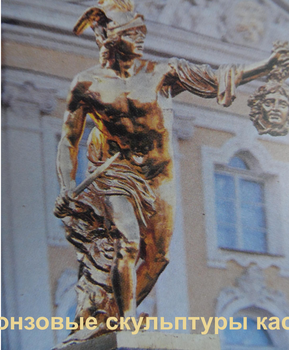
Бронзовые скульптуры каскада