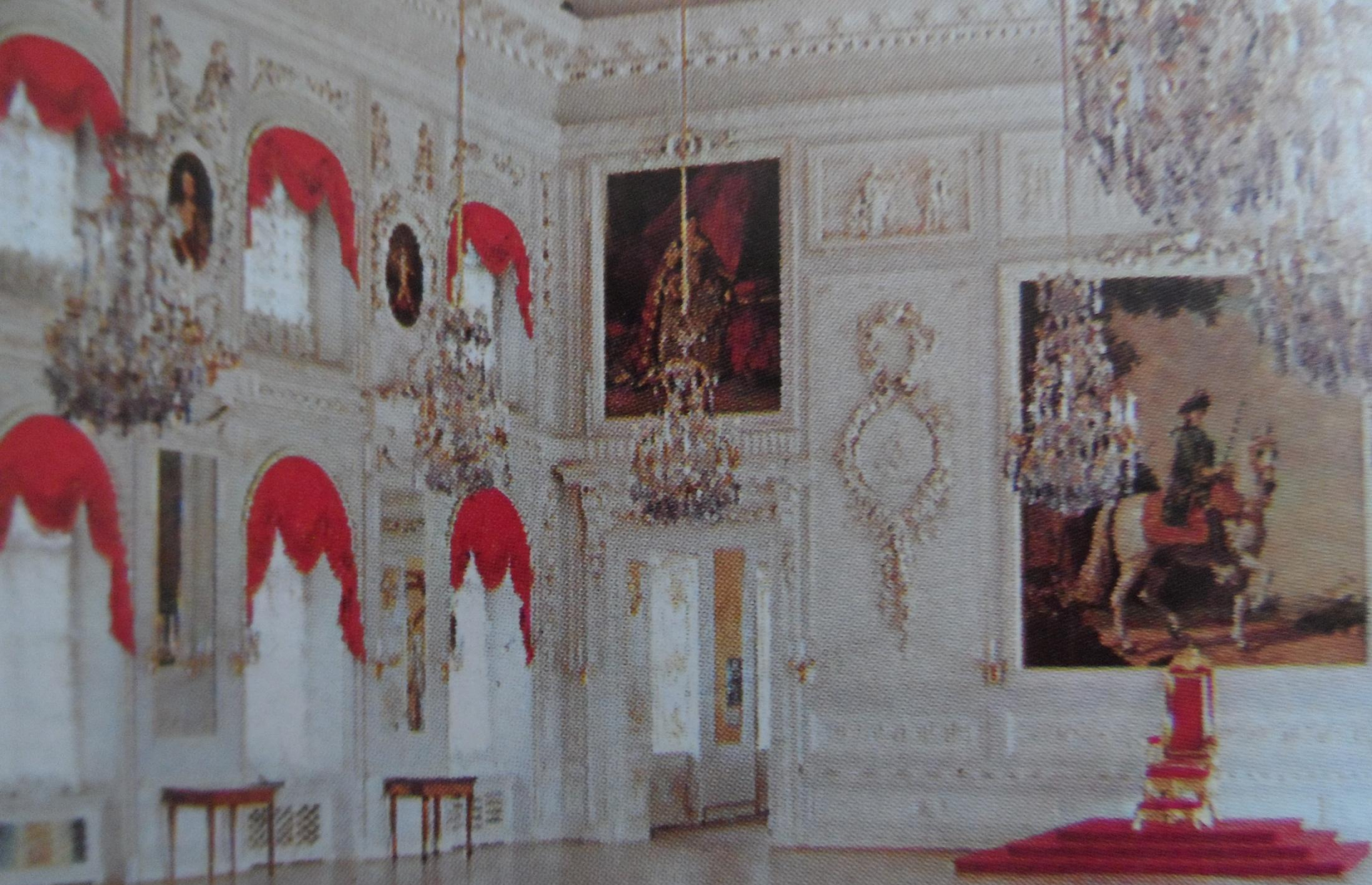
Тронный зал Петергофа