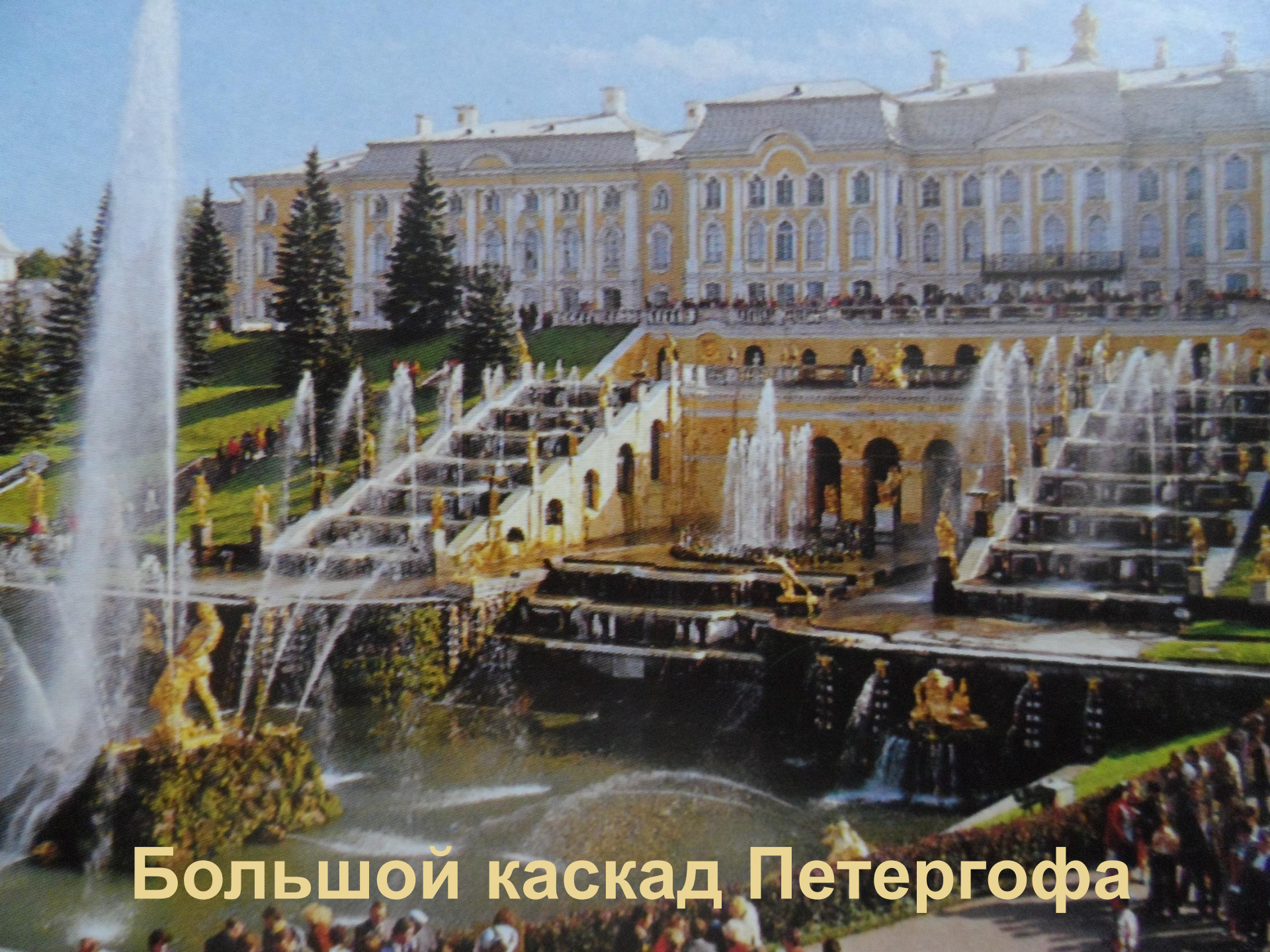
Большой каскад Петергофа