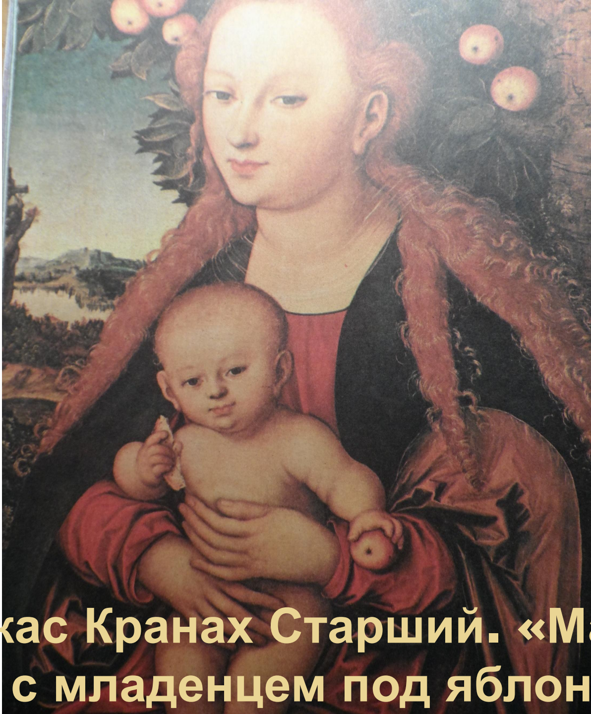
Лукас Кранах Старший. «Мадонна с младенцем под яблоней»