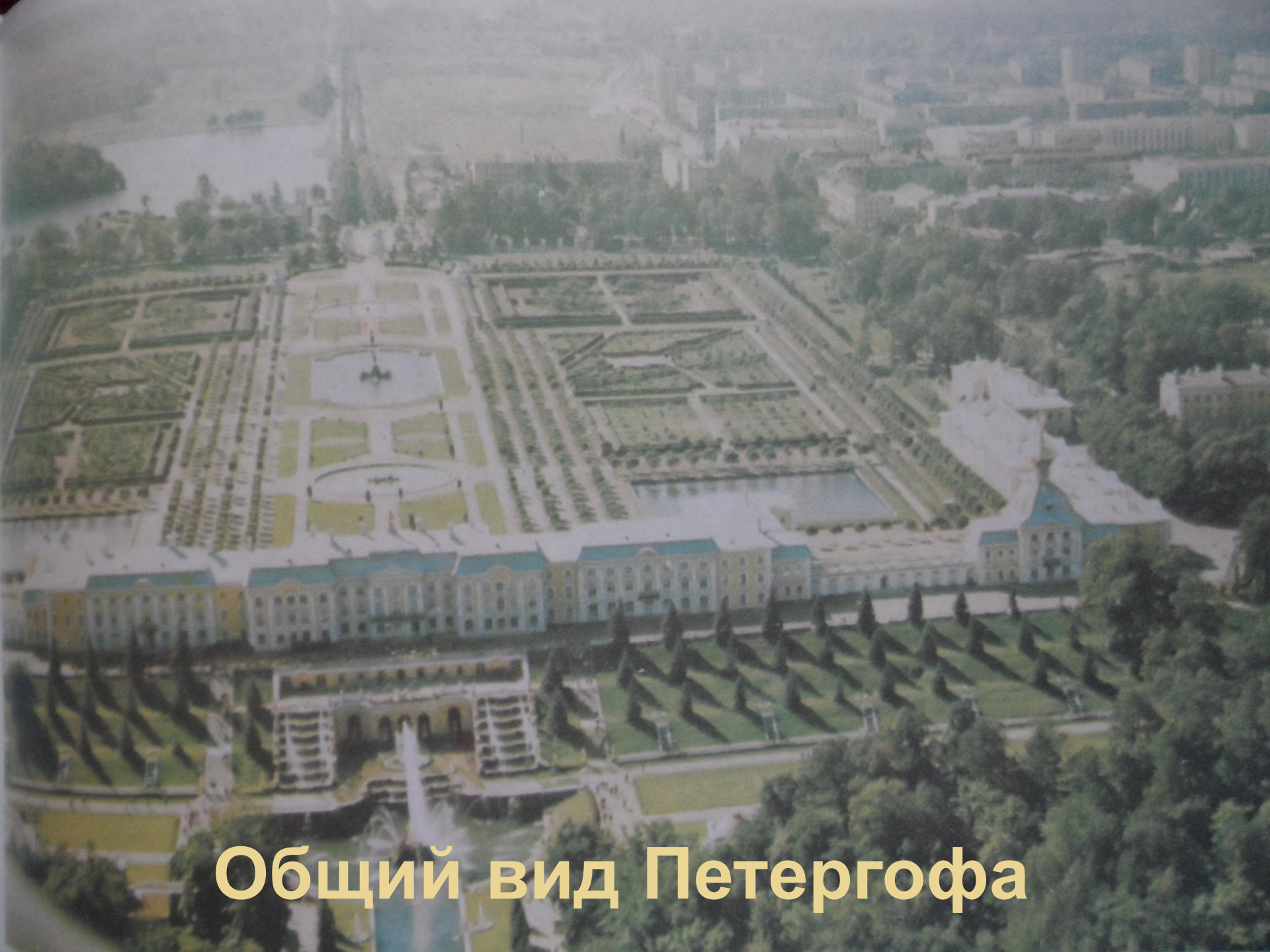
Общий вид Петергофа