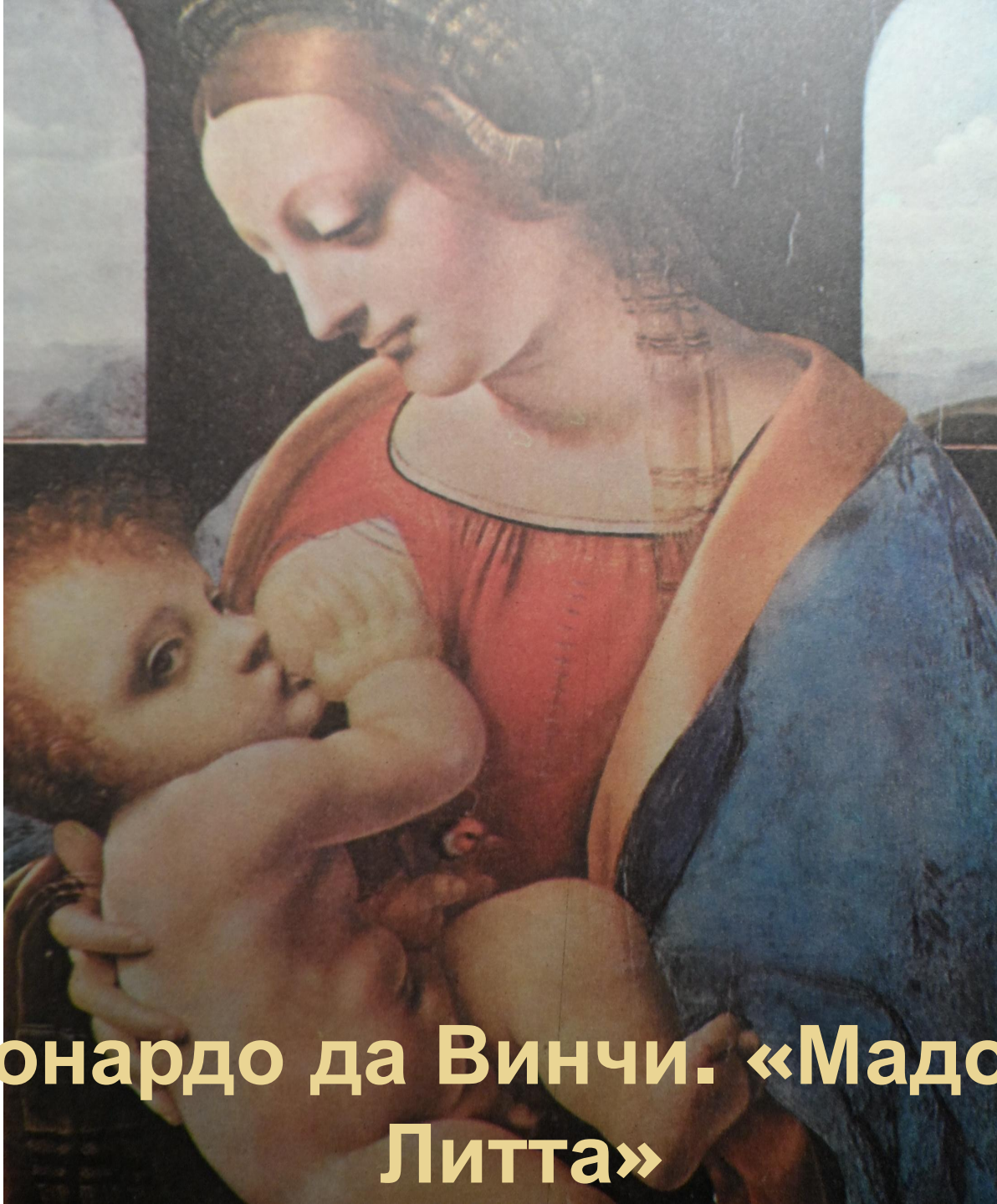
Леонардо да Винчи. «Мадонна Литта»