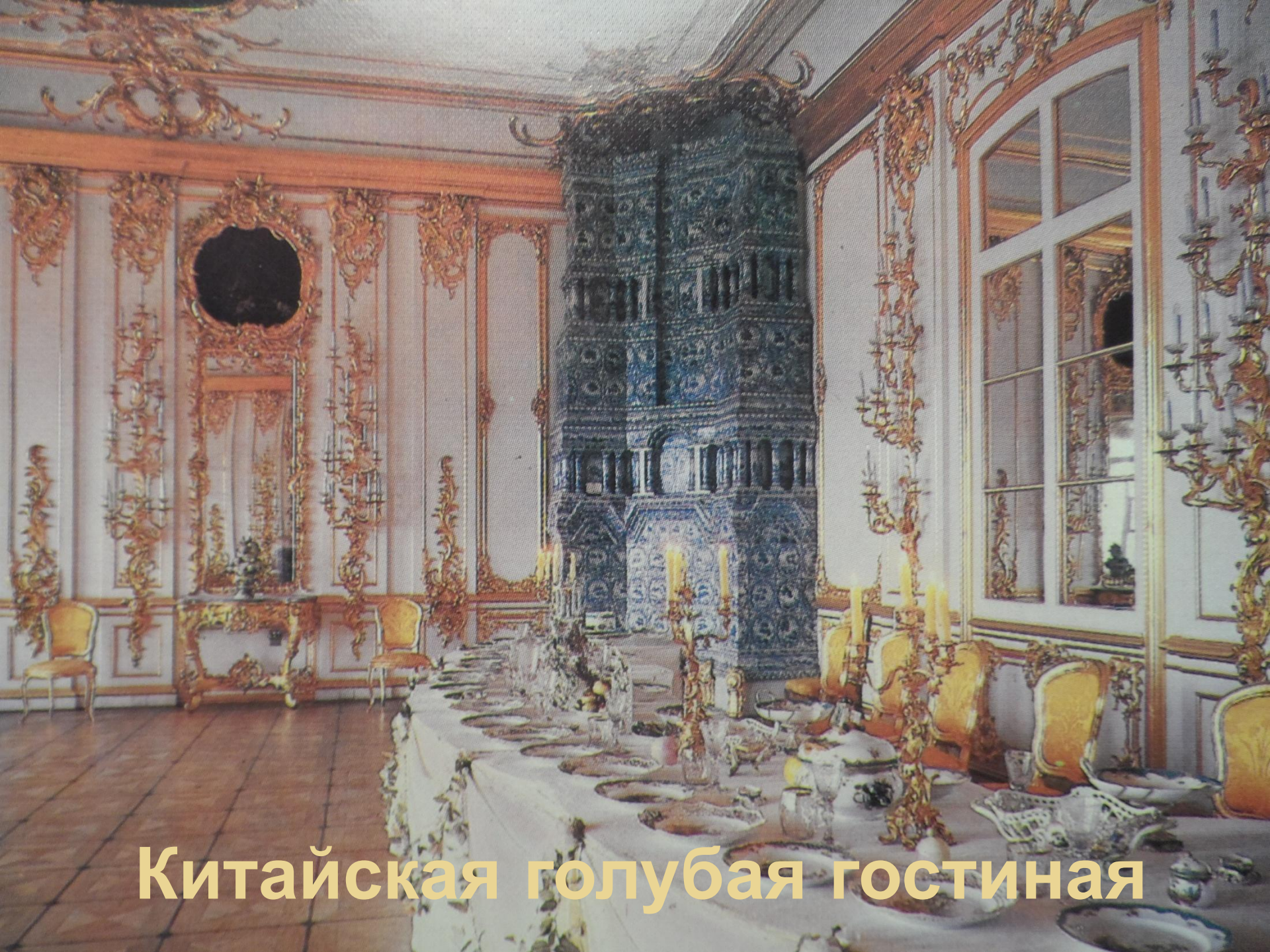
Китайская голубая гостиная