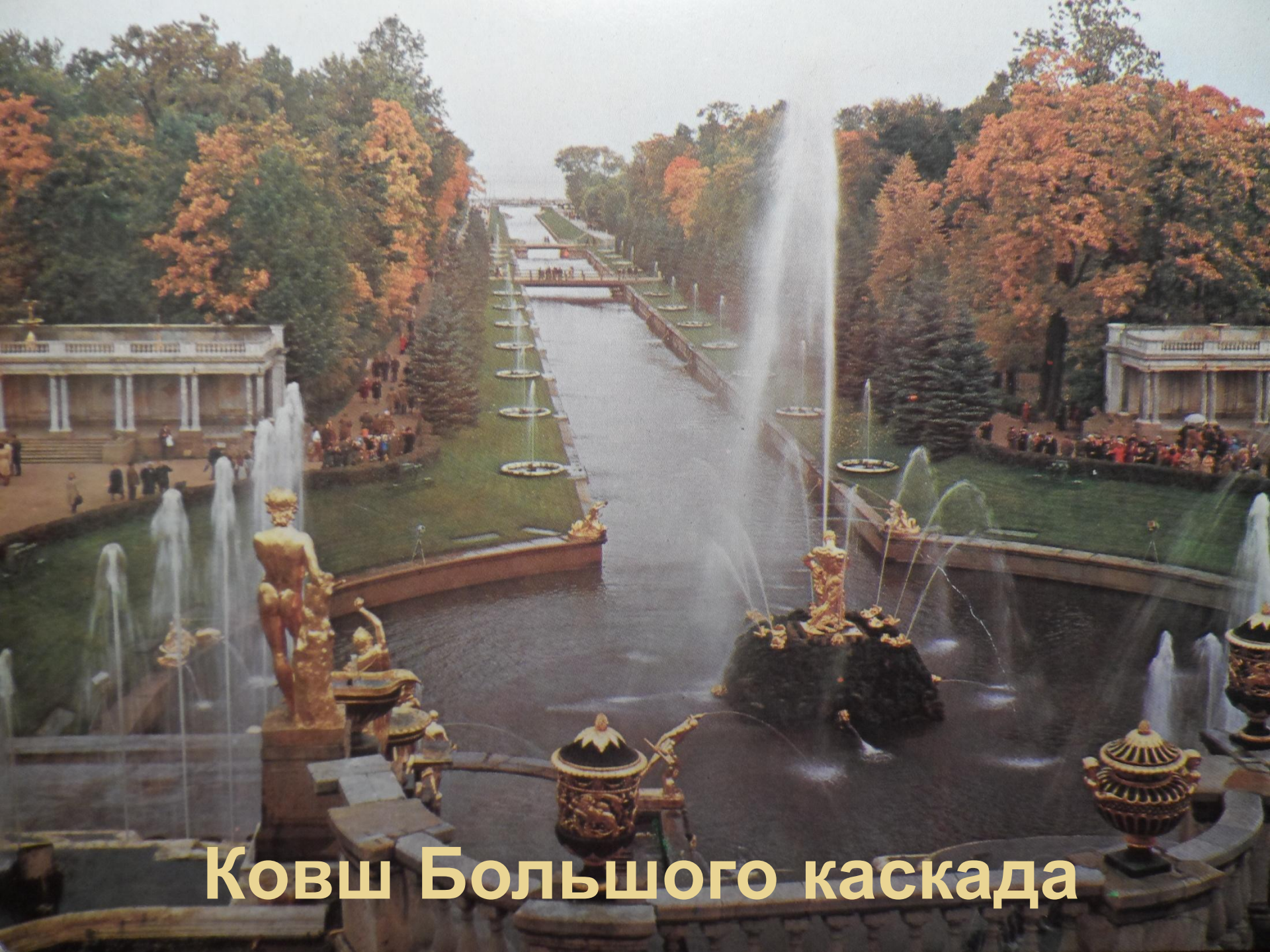
Ковш Большого каскада