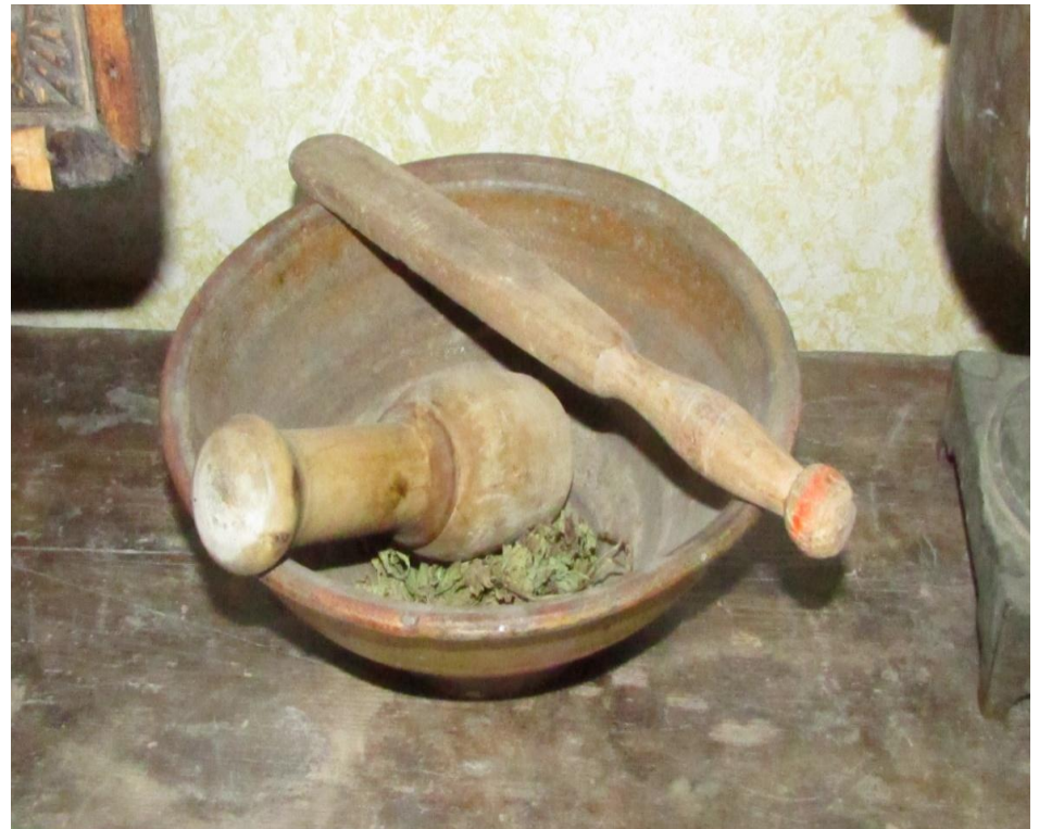
Рубель. Ступка для обмолачивания (толкушка).