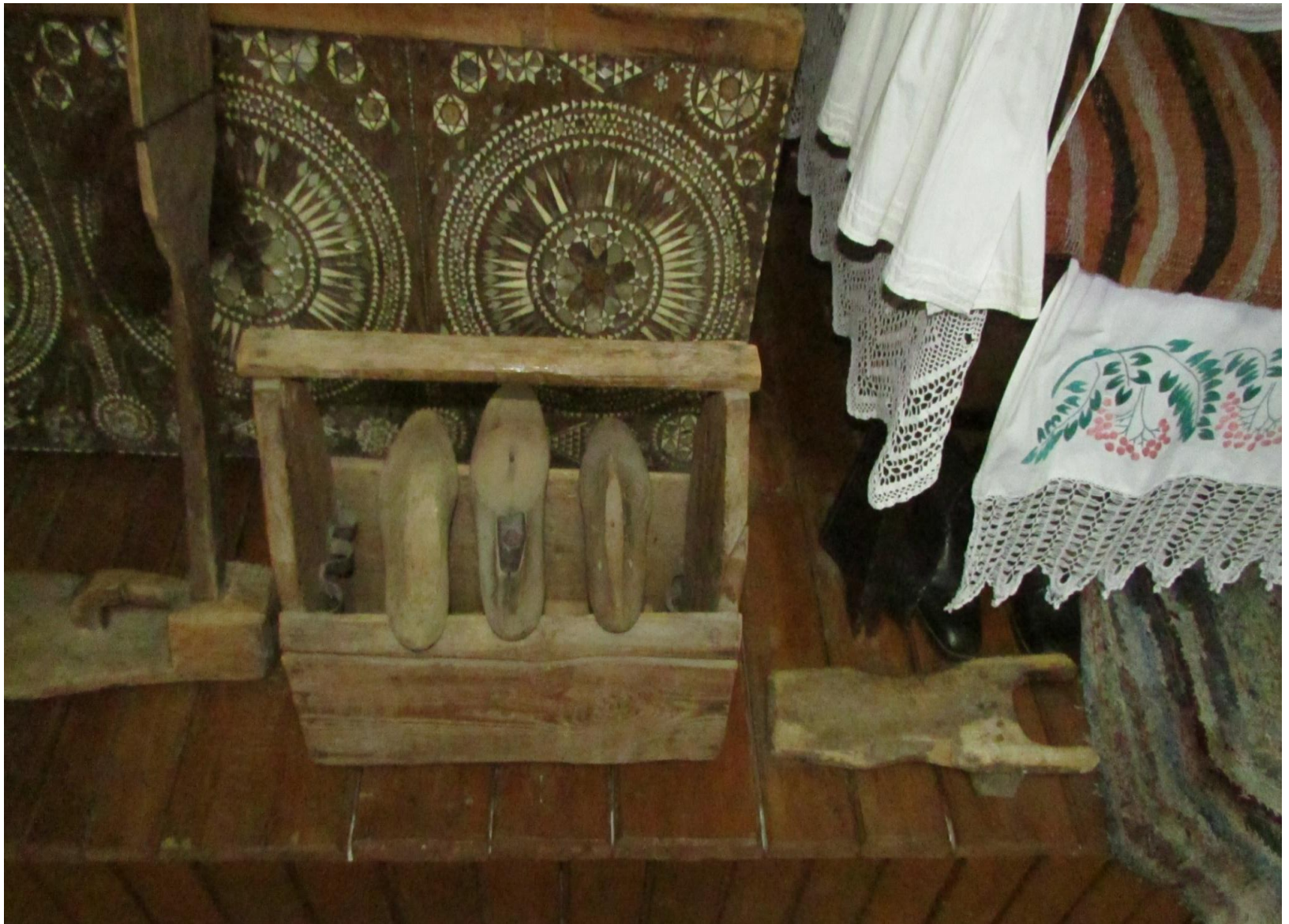
Колодки для обуви.