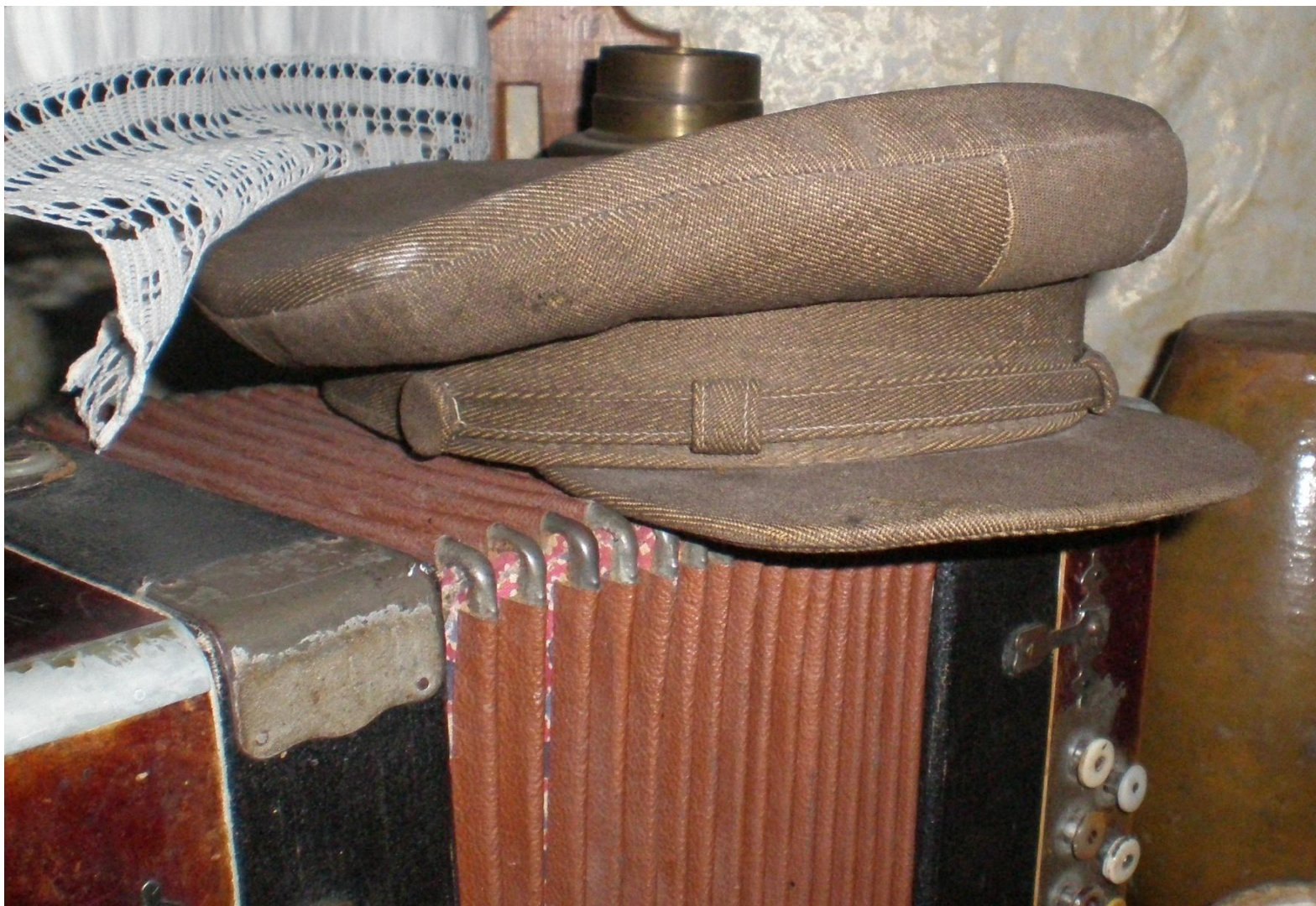
Гармонь, фуражка. (принадлежности казака)