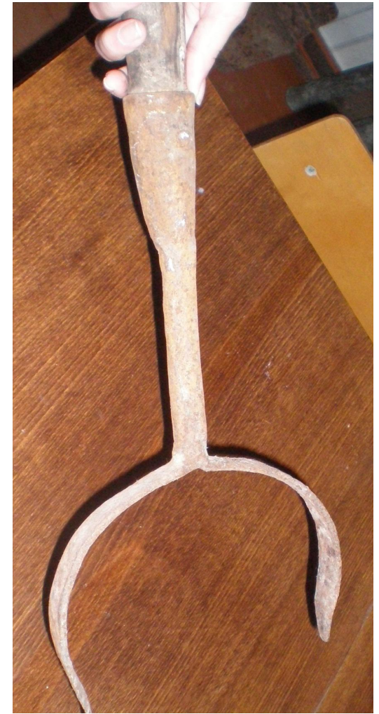
Утюги различной величины. Ухват (рогач).