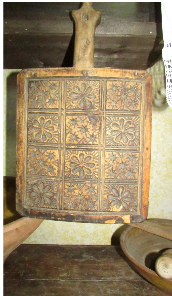
Постав (посудный шкаф). Пряница.