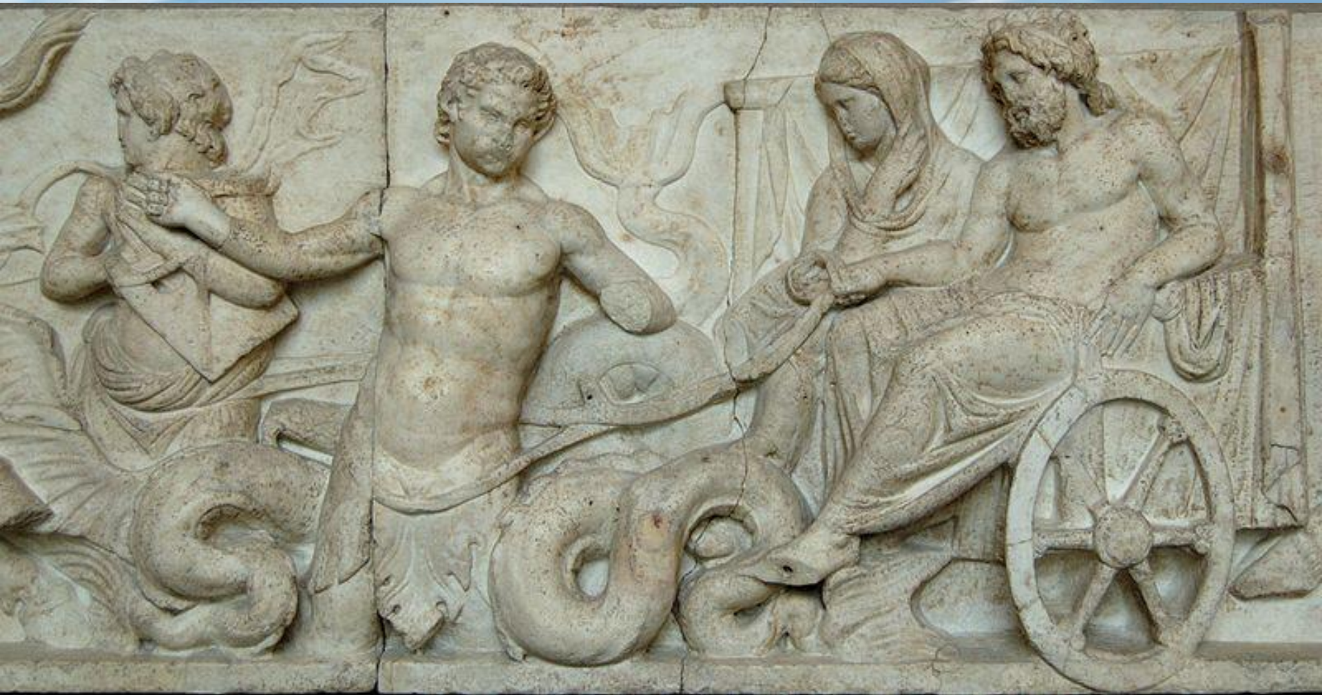
Колесница Амфитриты и Посейдона, запряженная тритонами. Рельеф. Глиптотека Мюнхена (музей скульптуры)