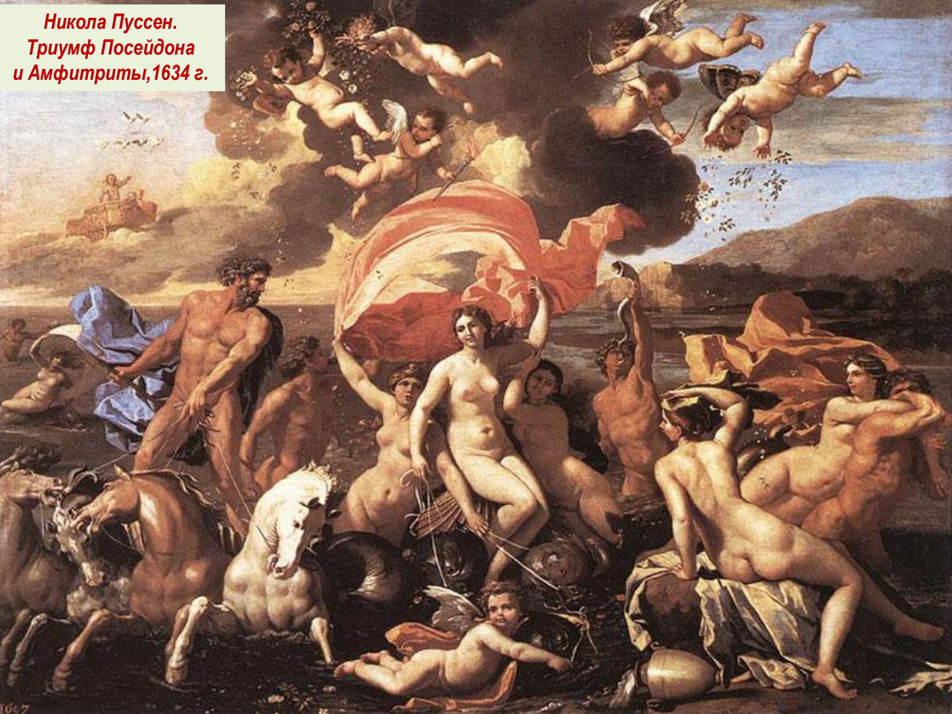
Никола Пуссен. Триумф Посейдона и Амфитриты, 1634 г.