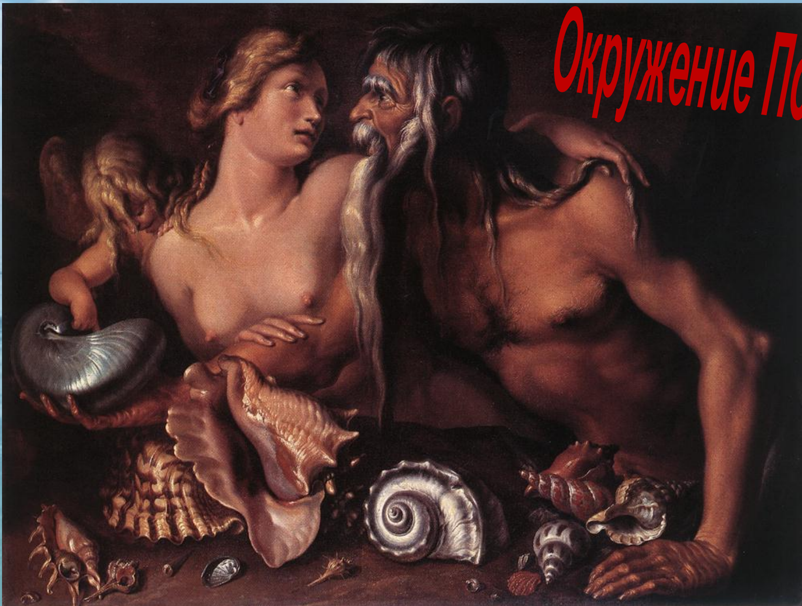
Якоб де Гейн. «Нептун и Амфитрита»