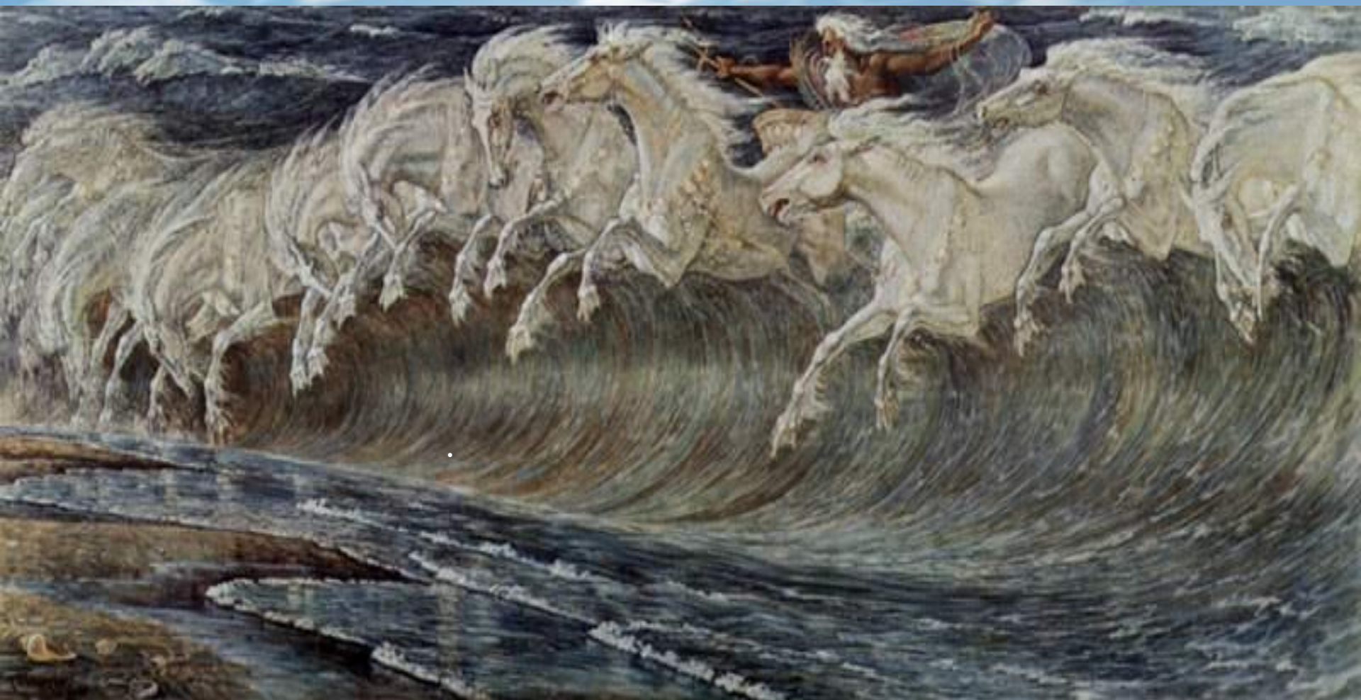
Крейн Уолтер. Кони Нептуна, 1892

Посейдон считался покровителем коневодства и имел прозвище Гиппий (Конный) . Морские кони – гиппокамы