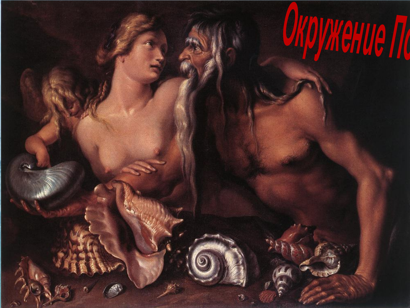
Якоб де Гейн. «Нептун и Амфитрита»