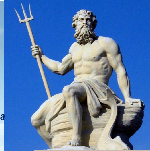
2. скульптура Посейдона в Копенгагене

- Просмотрев все изображения Посейдона, попробуйте определить чему он покровительствовал? - Какое изображение Посейдона, на ваш взгляд, более точно отражает суть этого древнегреческого бога?