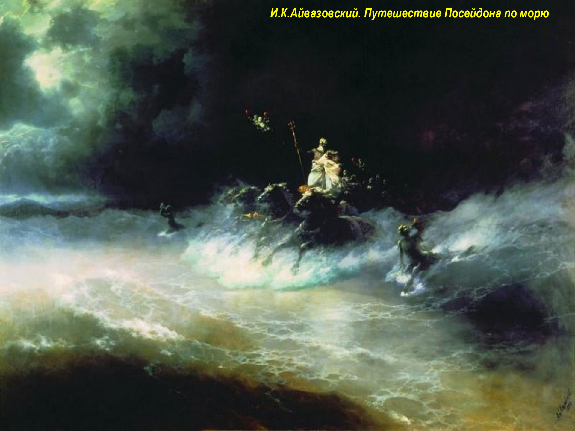
И.К.Айвазовский. Путешествие Посейдона по морю