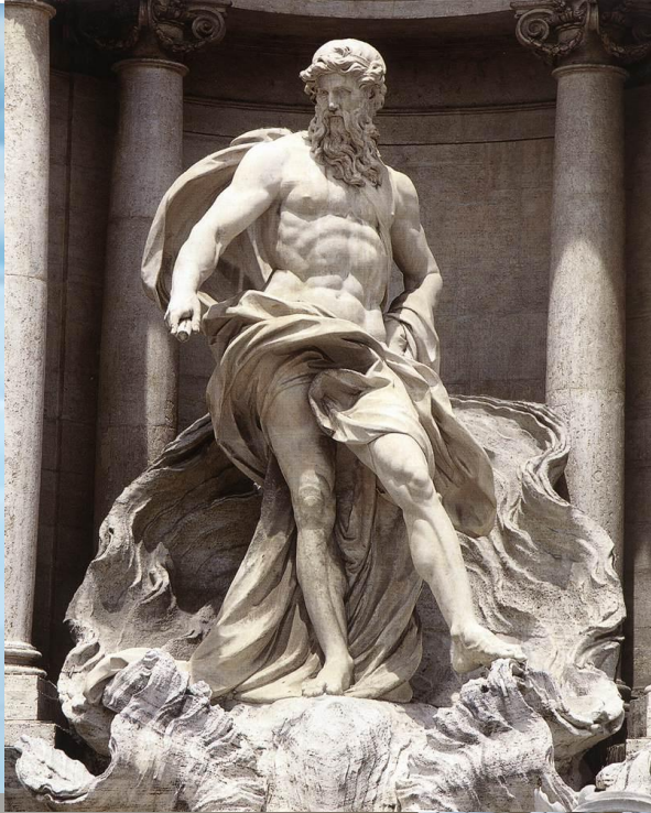
1. итальянский скульптор Пьетро Браччи , 1700 - 1773