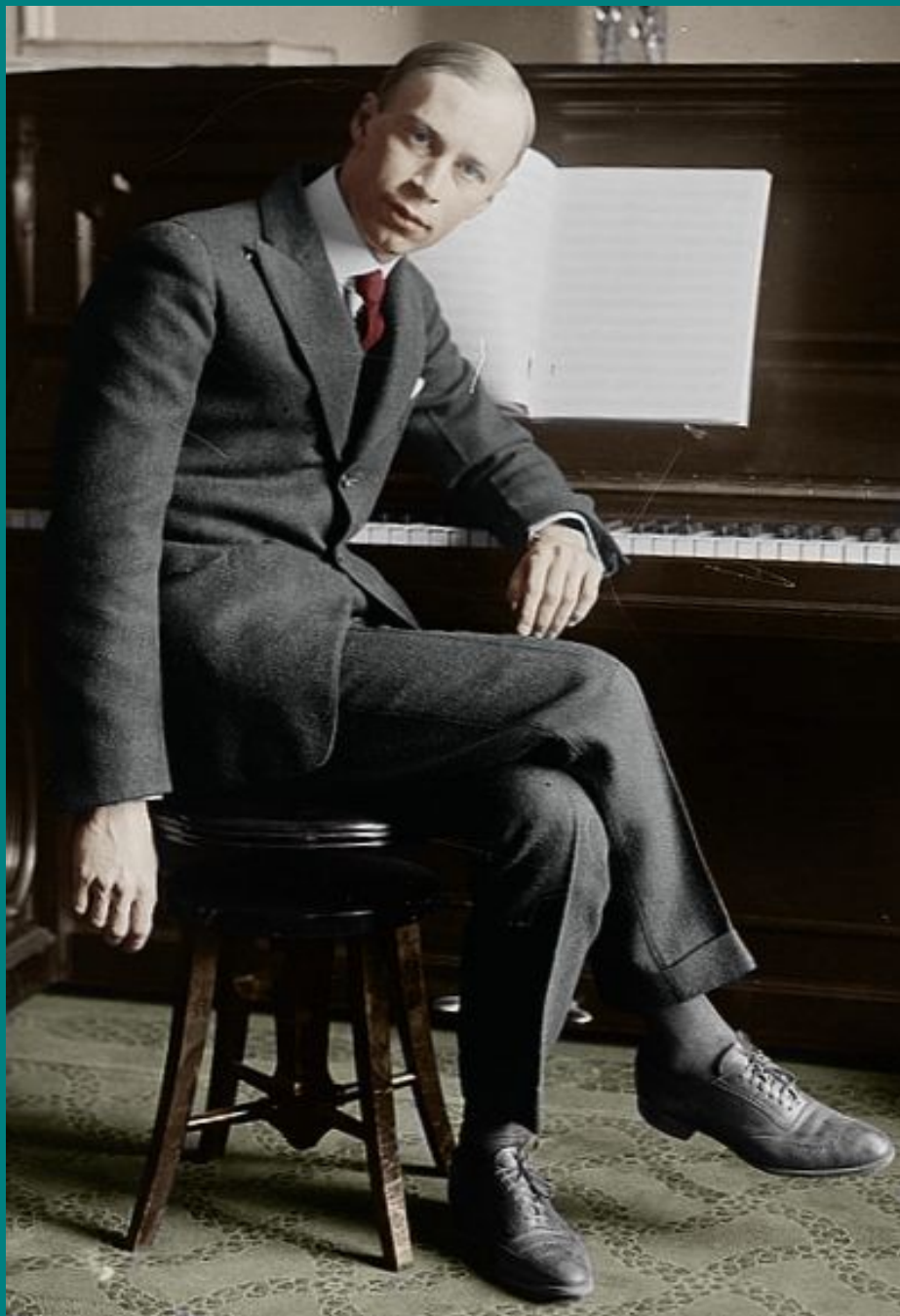
Прокофьев Сергей Сергеевич (11.04.1891 – 5.03.1953)