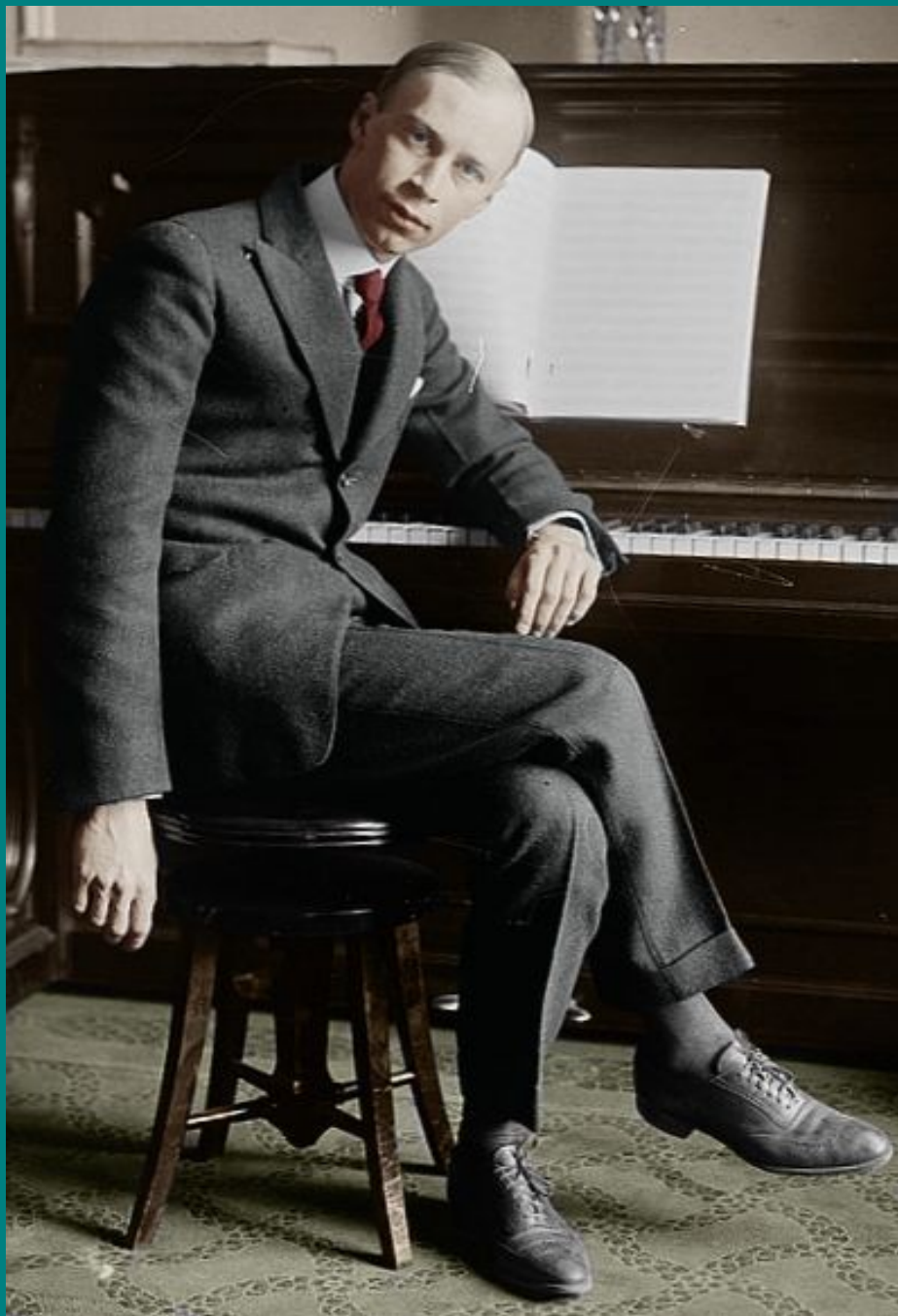
Прокофьев Сергей Сергеевич (11.04.1891 – 5.03.1953)