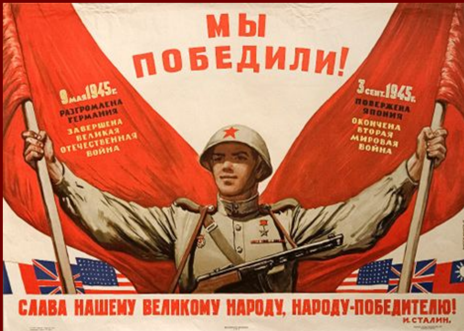
Плакат Иванова В.С. «Мы победили! Слава нашему великому народу, народу-победителю!». 1945 год.