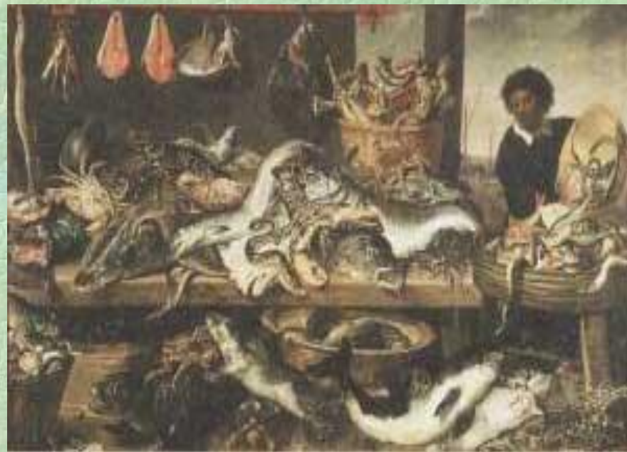
Франс Снейдерс. Фламандская школа. Рыбная лавка.

Натюрморт негізінде XVII ғасырда Голландияда кеңінен дамыды, ол кездерде мыс заттардан құралған натюрморттық композициялар болды. Натюрморт екі топқа күрделі және қарапайым болып бөлінеді. Қарапайым натюрмортқа бір немесе үш заттан қойылған қойылымды жатқызады, ал күрделі натюрмортқа бес заттан жоғары қойылған композицияны жатқызады.