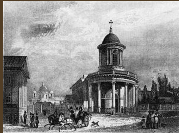
Лютеранская церковь Святой Анны