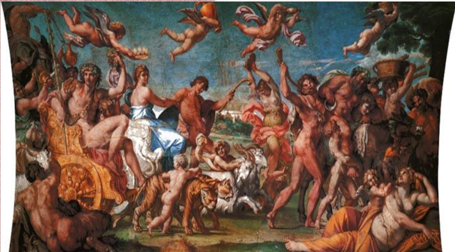
Триумф Вакха и Ариадны (1597-1604) Палаццо Фарнезе, Рим