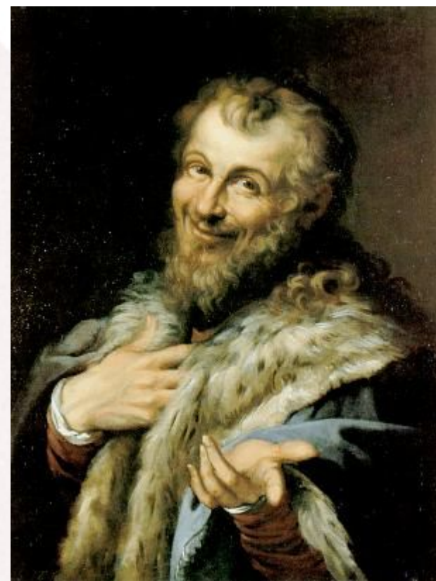
Демокрит. Национальные музей и галерея Каподуэ, Неаполь