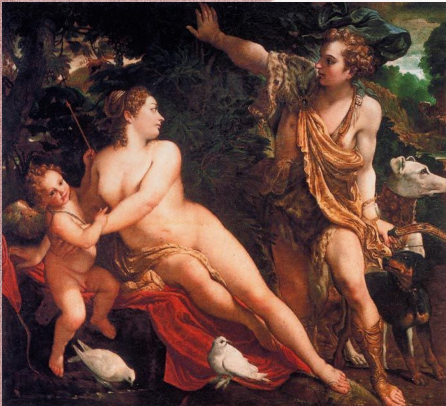
Венера, Адонис и Амур (1588-89)