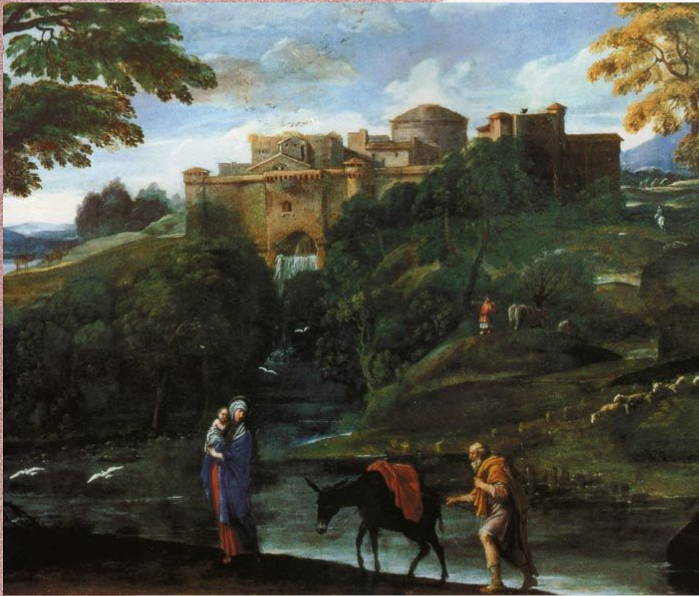
Бегство в Египет (ок. 1604) Галерея Дориа-Памфили, Рим