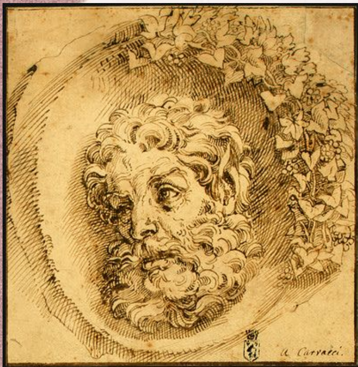
Голова фавна. Национальная галерея искусства, Вашингтон