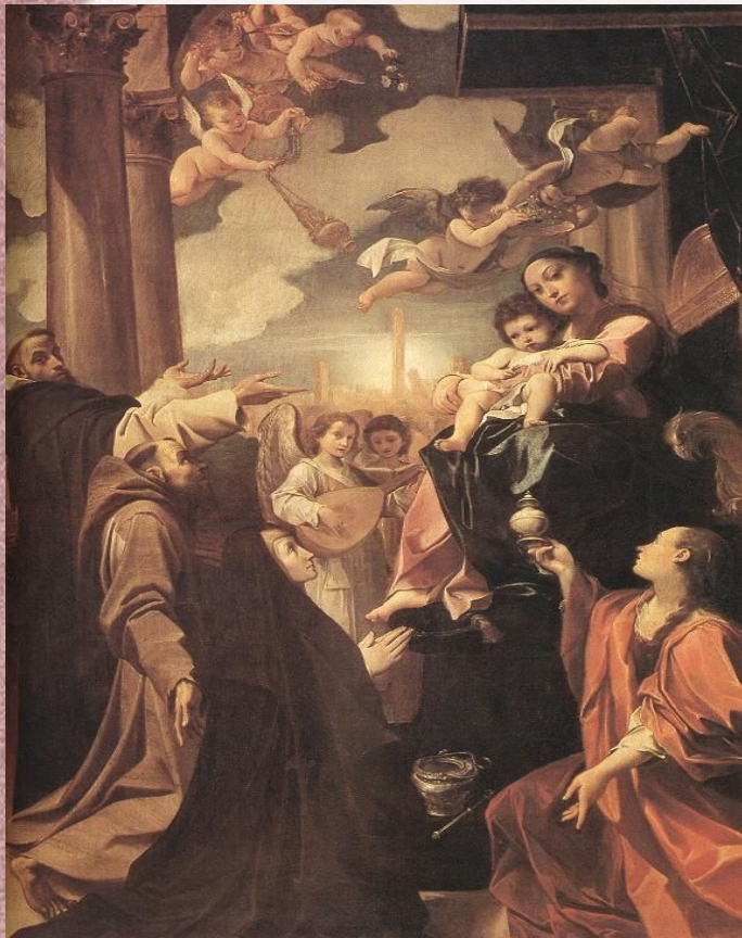
Мадонна Баргеллини. 1588. Национальная пинакотека . Болонья

Лодовико Карраччи (итал. Lodovico Carracci ) (21 апреля 1555, Болонья — 13 ноября 1619, там же) — итальянский живописец, гравёр и скульптор, один из ярчайших представителей болонской школы.