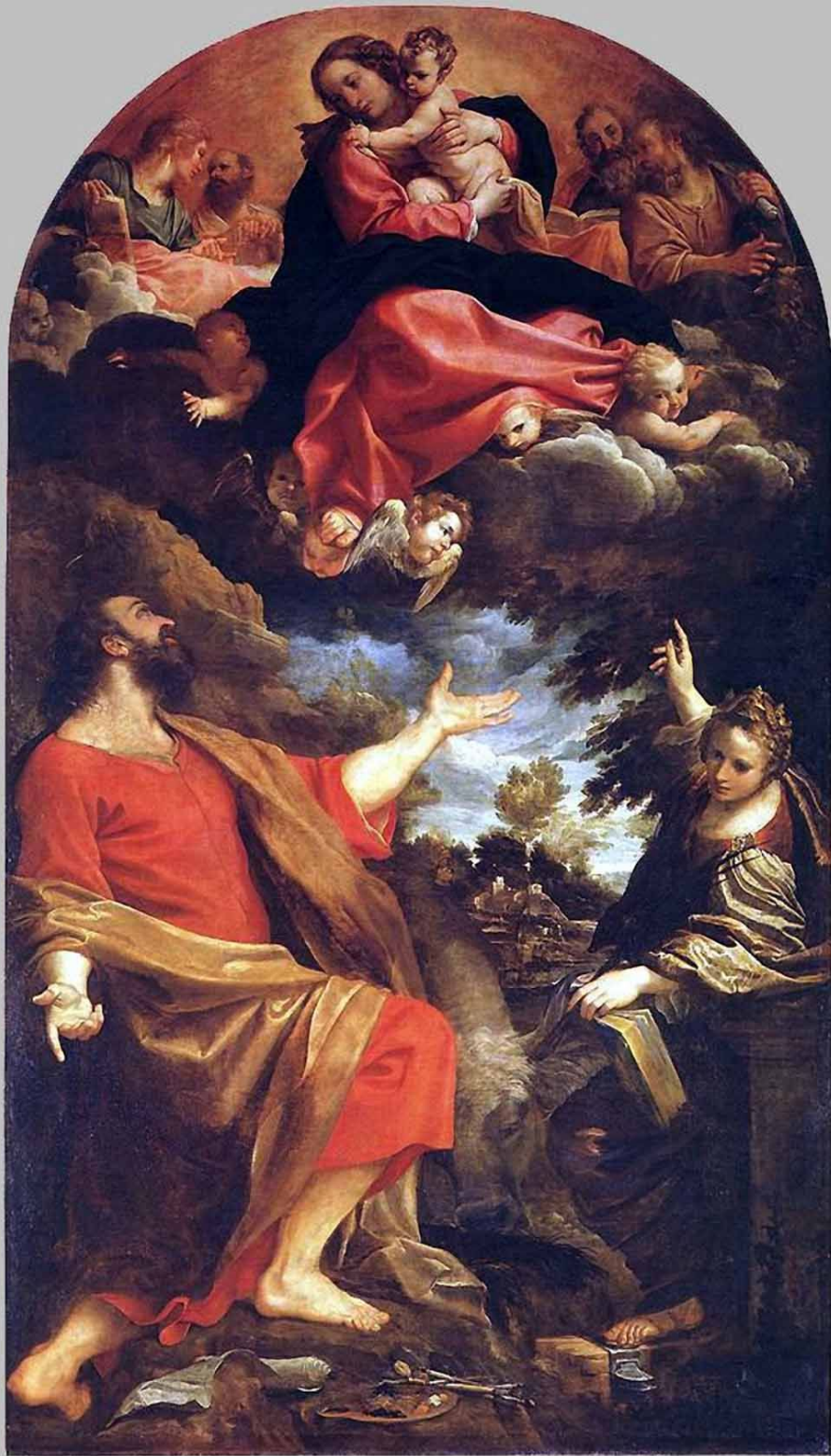
Аннибале Карраччи . «Мадонна, являющаяся св. Луке и св. Екатерине» 1592.. Холст 401 х 226 см. Происходит из герцогской галереи в Модене, 1776 г.; в Лувр поступила в 1797 г.