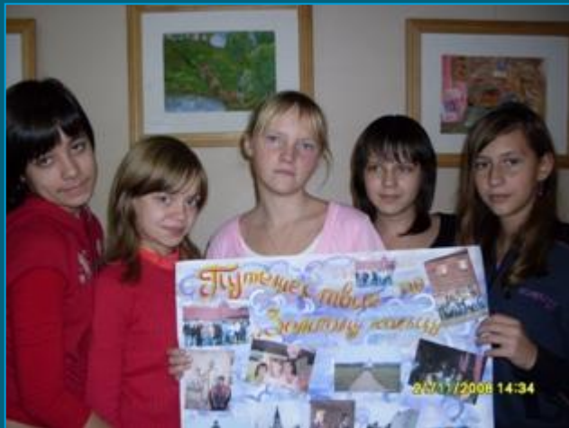
Путешествие по «Золотому кольцу»