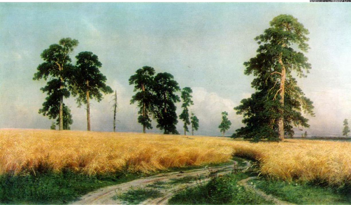
И. Шишкин «Рожь» (1878)