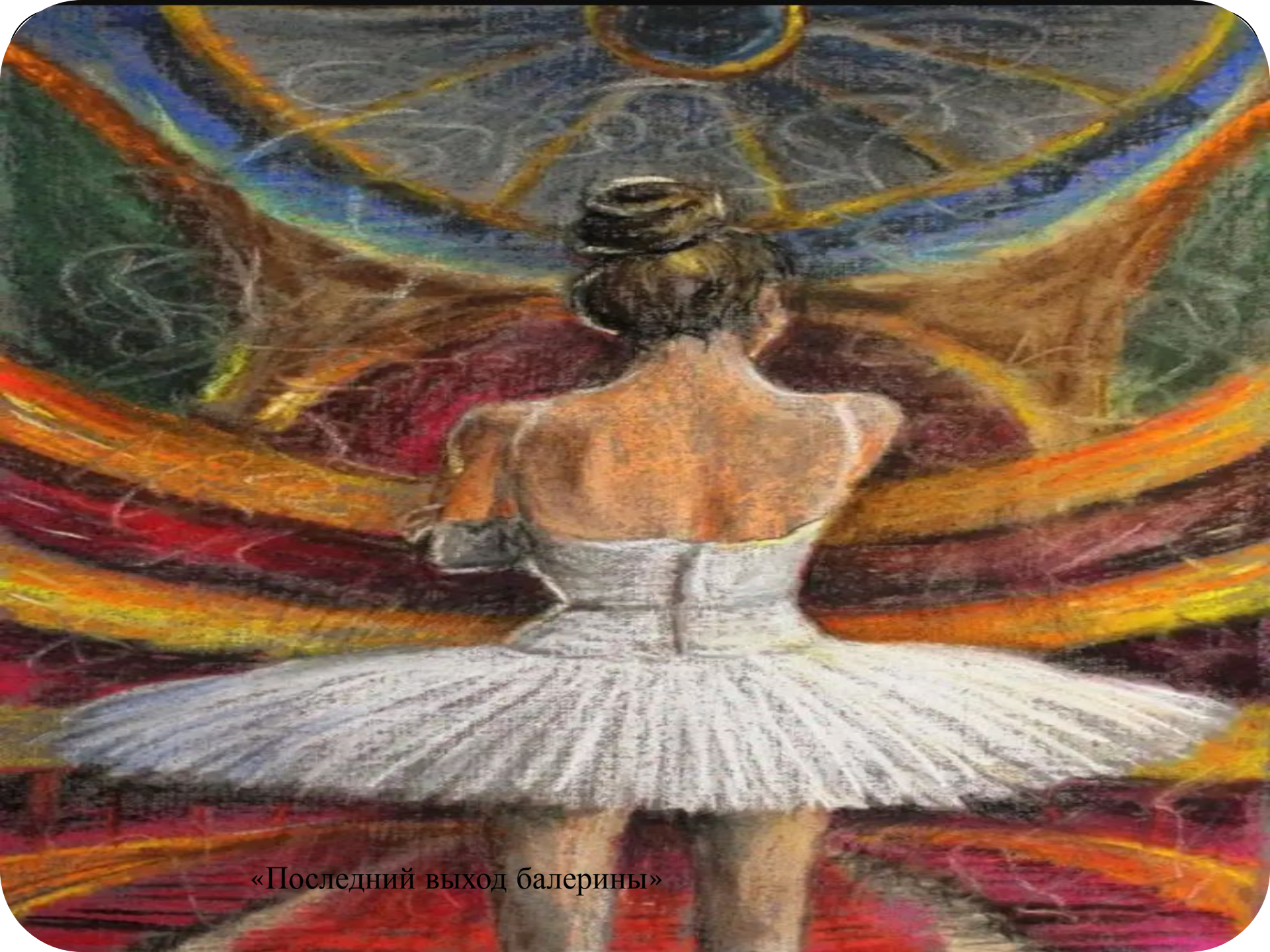
«Последний выход балерины»