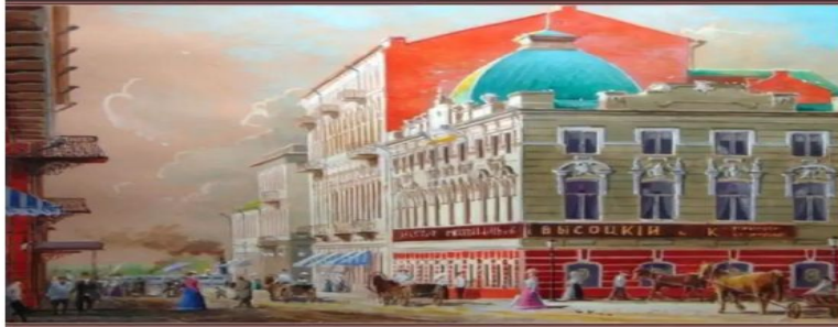
Старая Астрахань, ул. Никольская