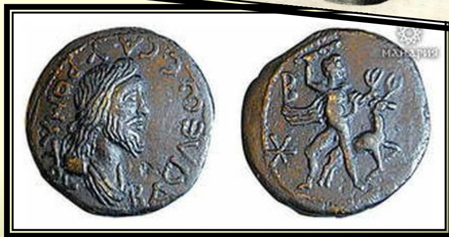
Уникальная монета боспорского царя