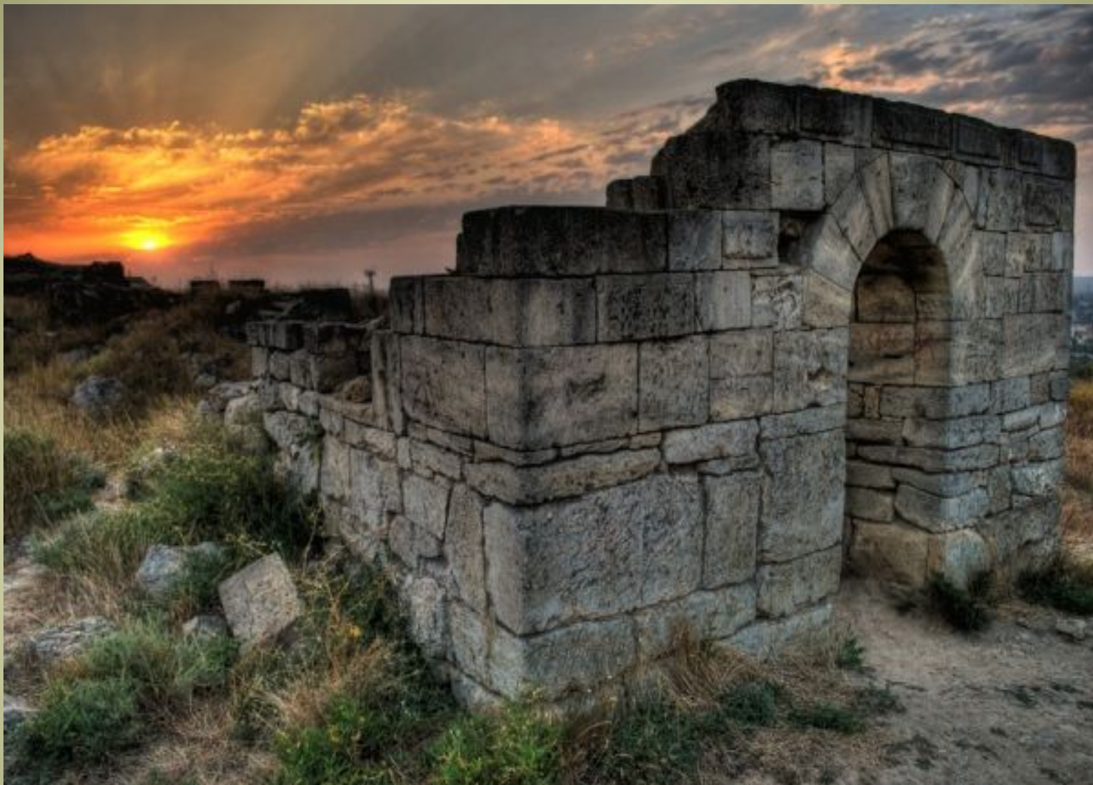
Древняя арка в Пантिकाпее