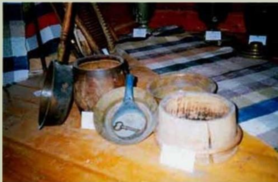
Горшки, кринки, миски