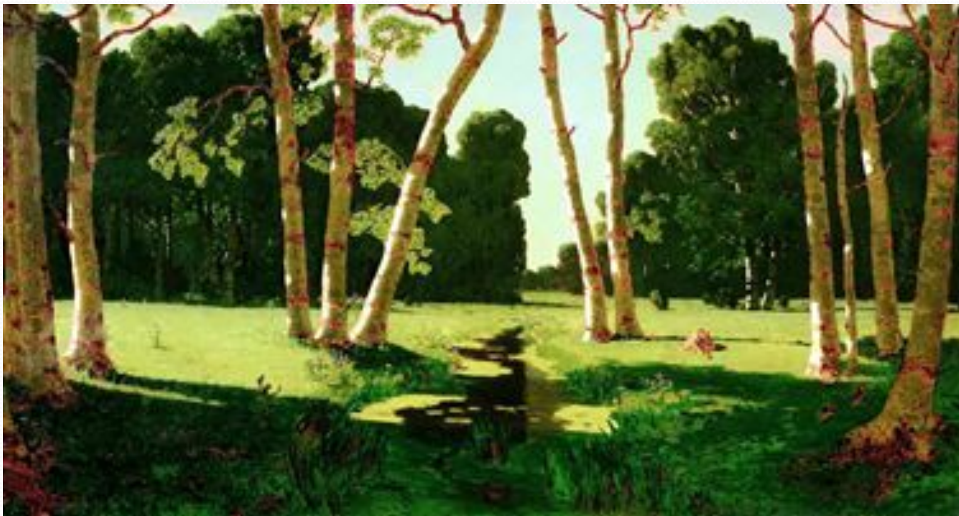
Архип Куинджи «Березовая роща».