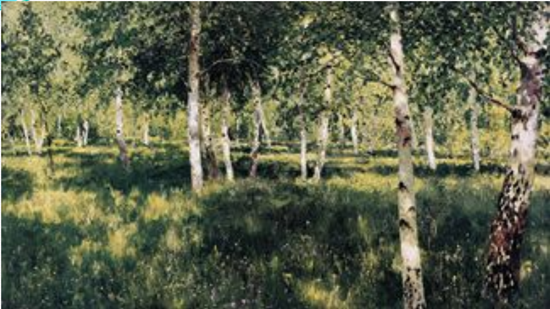
И.И.Левитан "Берёзовая роща".