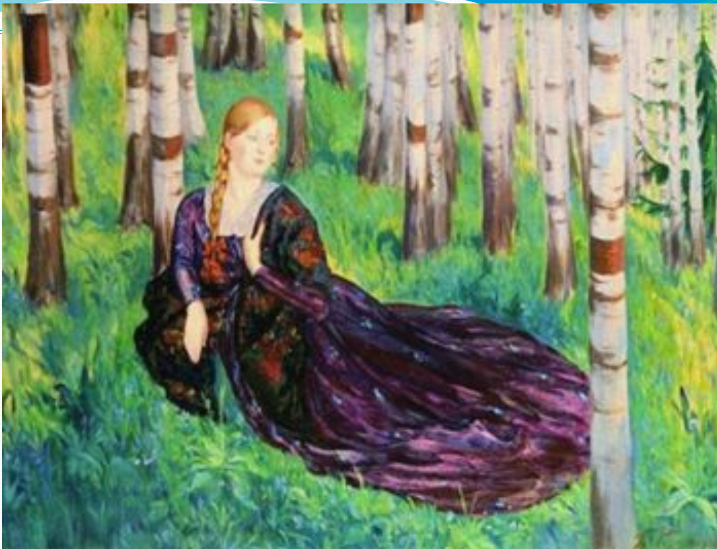
Борис Кустодиев. «В берёзовой роще»