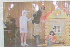
СКАЗКА «ЛИСА И ЗАЙЦ»