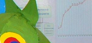
График реализации ЦО в школах Майкопского района