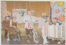
СКАЗКА НА НОВЫЙ ЛАД