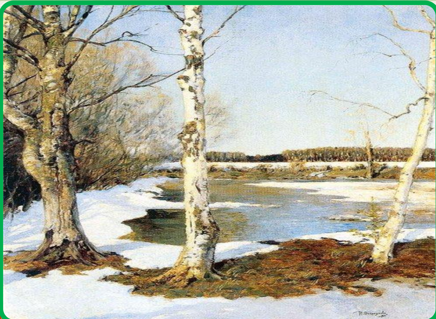
Остроухов И. С. «Ранняя весна» 1891