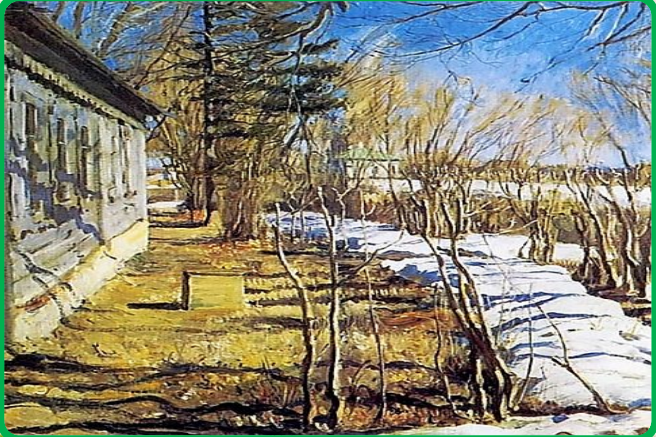
С. А. Виноградов «Весна»

Весна, весна! Как воздух чист! Как ясен небосклон! Своей лазурию живой Слепит мне очи он.