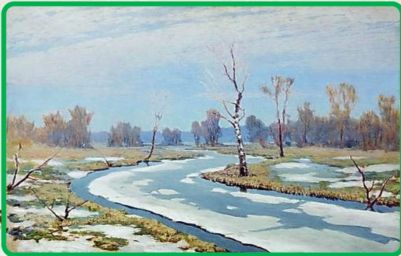
Куинджи Архип. «Ранняя весна»

Чиста небесная лазурь, Теплей и ярче солнце стало, Пора метелей злых и бурь Опять надолго миновала.