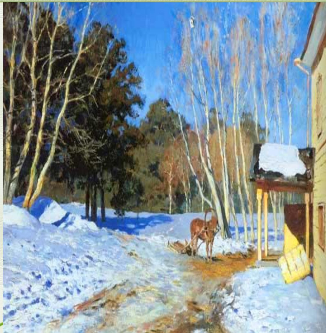
Левитан И.И. В начале марта

Уж тает снег, бегут ручьи, В окно повеяло весною... Засвищут скоро соловьи, И лес оденется листвою!