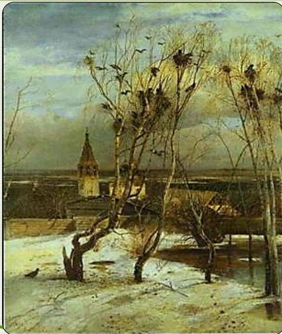
Саврасов А.К. Грачи прилетели. 1871

Скоро гости к тебе соберутся, Сколько гнезд понавьют, посмотри. Что за крики, песни польются, День деньской от зари до зари.