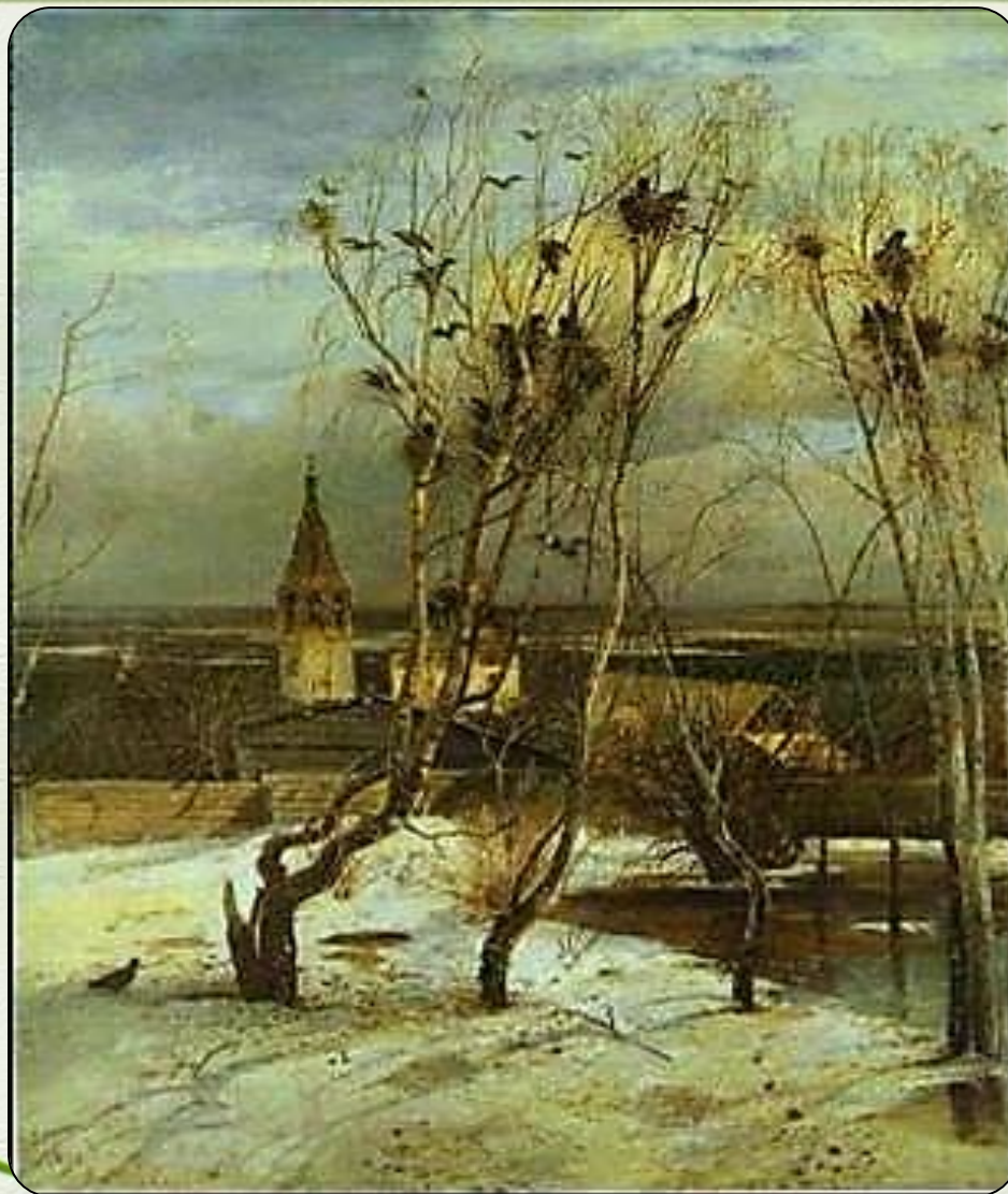
Саврасов А.К. Грачи прилетели. 1871

Скоро гости к тебе соберутся, Сколько гнезд понавьют, посмотри. Что за крики, песни польются, День деньской от зари до зари.