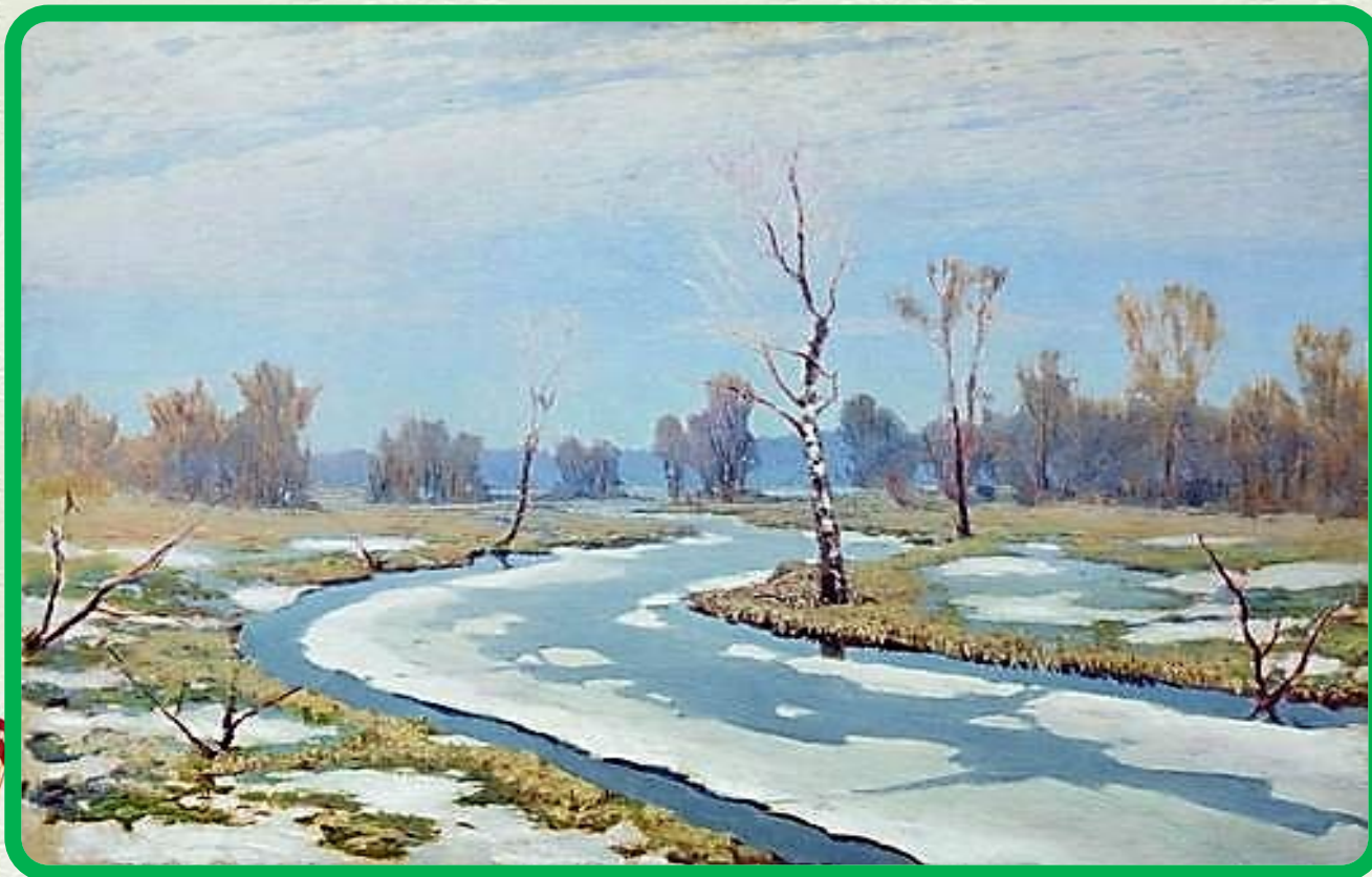
Куинджи Архип. «Ранняя весна»

Чиста небесная лазурь, Теплей и ярче солнце стало, Пора метелей злых и бурь Опять надолго миновала.