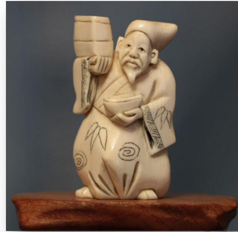
Нэцкэ из оленьего рога