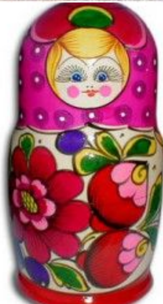
Рисунок полхов-майданской куклы – цветок шиповника (розы) и несколько бутонов.