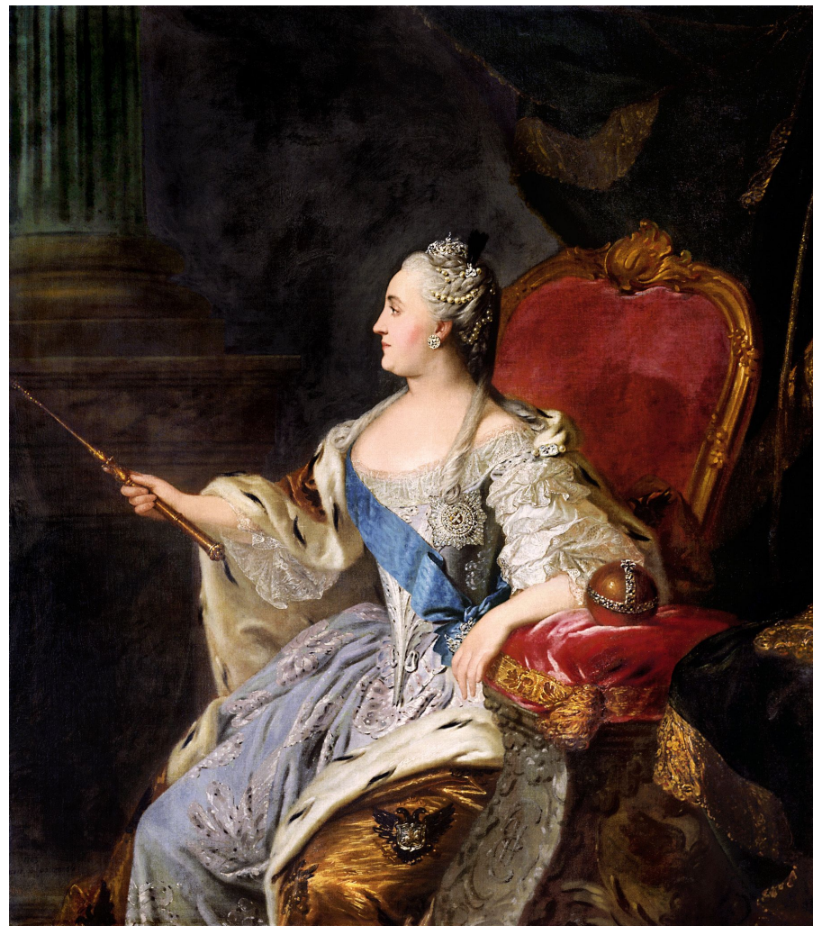
Фёдор Рокотов «Портрет Екатерины II»