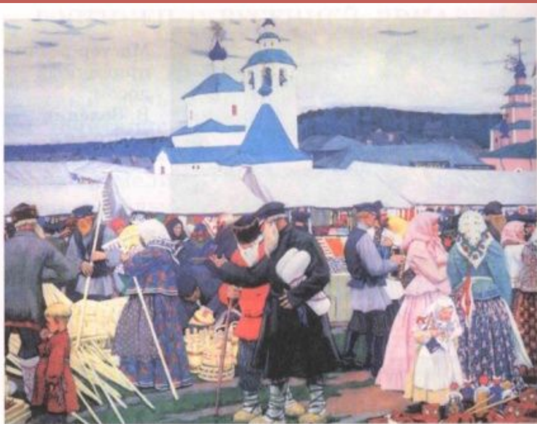
В. КУСТОДИЕВ. Ярмарка.

Золотая хохлома - это нарядная, красочная деревянная посуда, которой издавна торговали на весёлых ярмарках в старинном селе ХОХЛОМА.