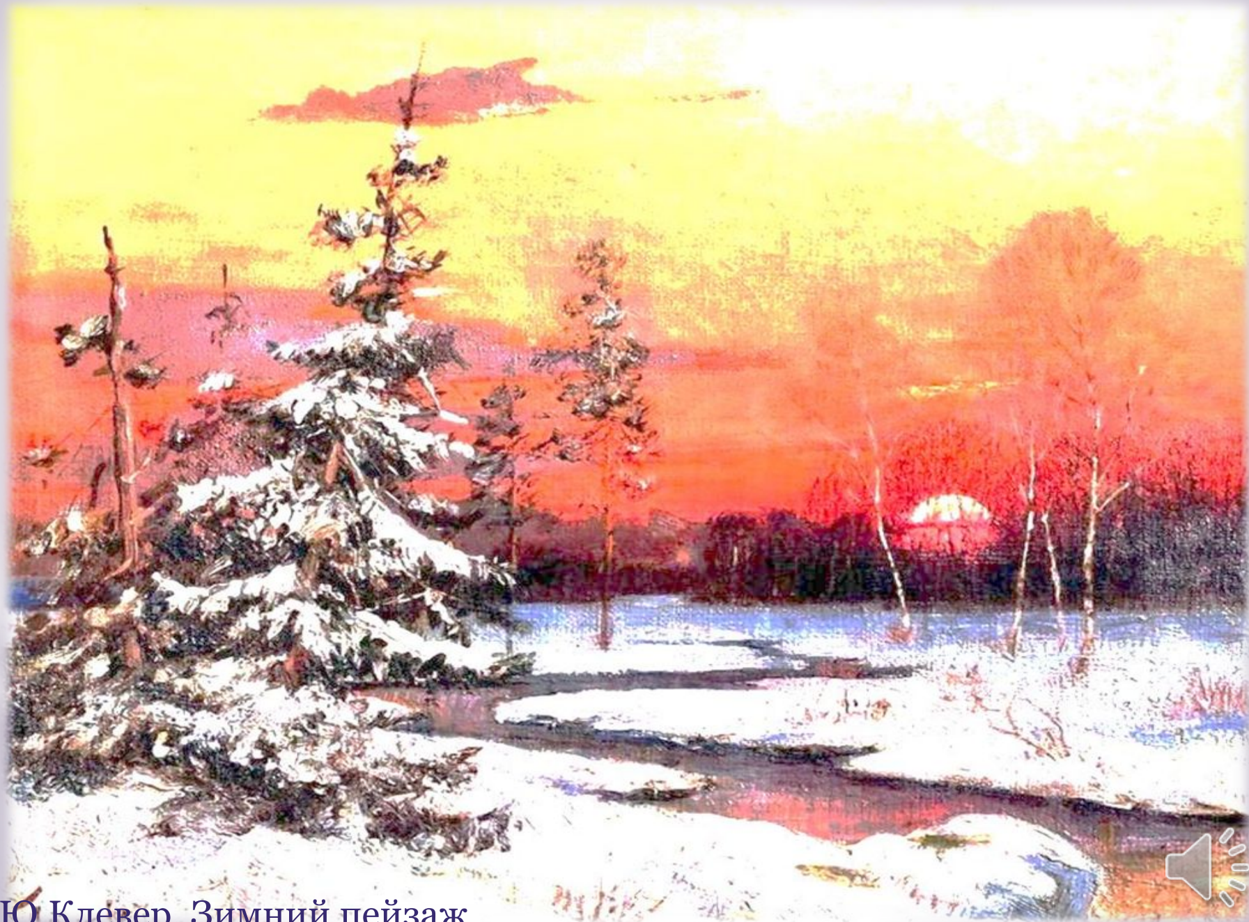
Ю.Клевер. Зимний пейзаж