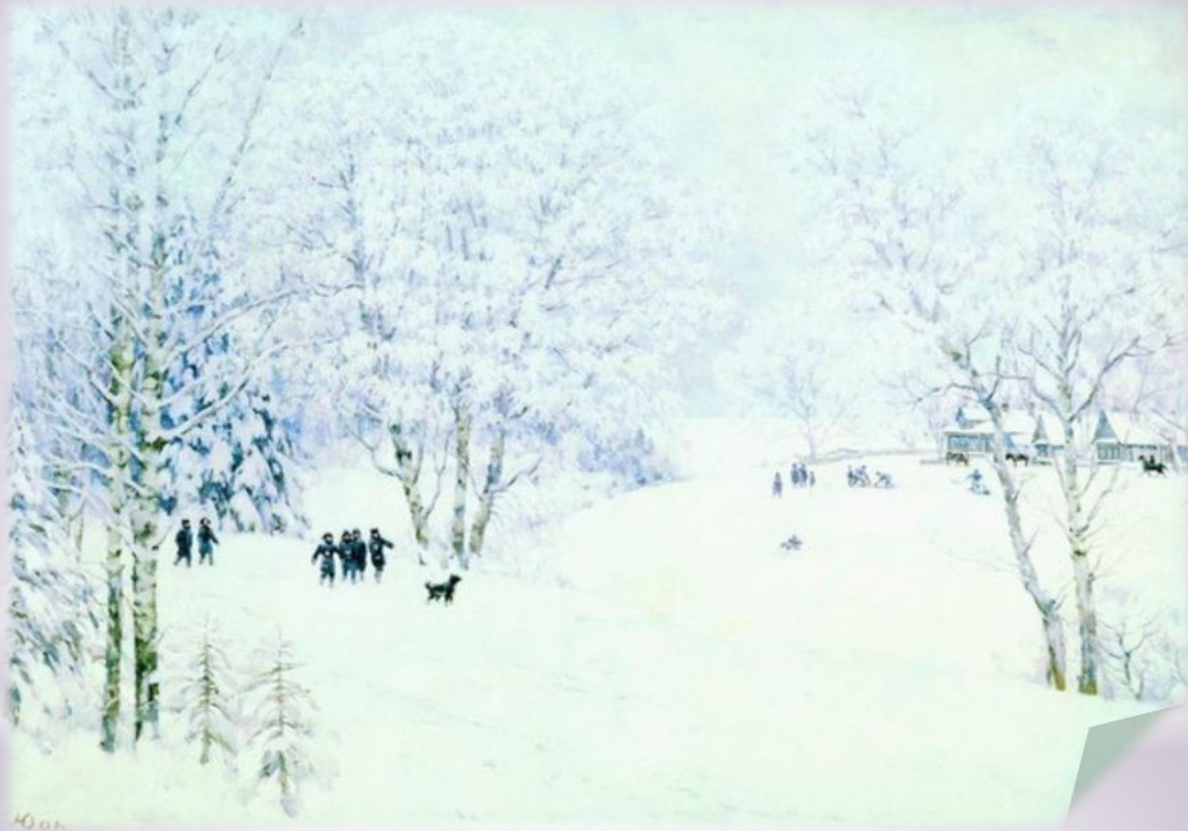
К.Юон. Русская зима. Лигачево. Фрагмент.