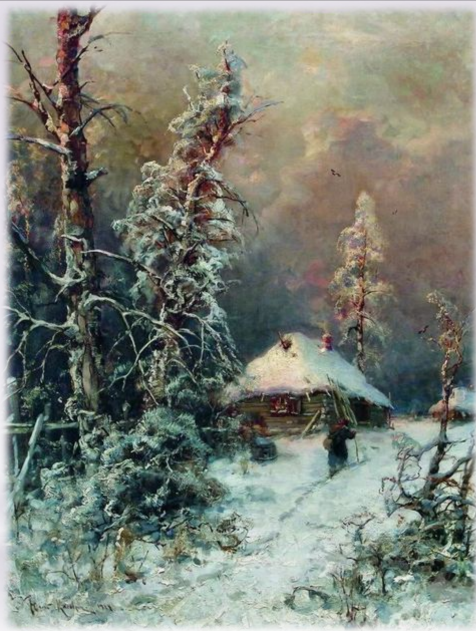
Ю. Клевер. Зимний пейзаж с домом