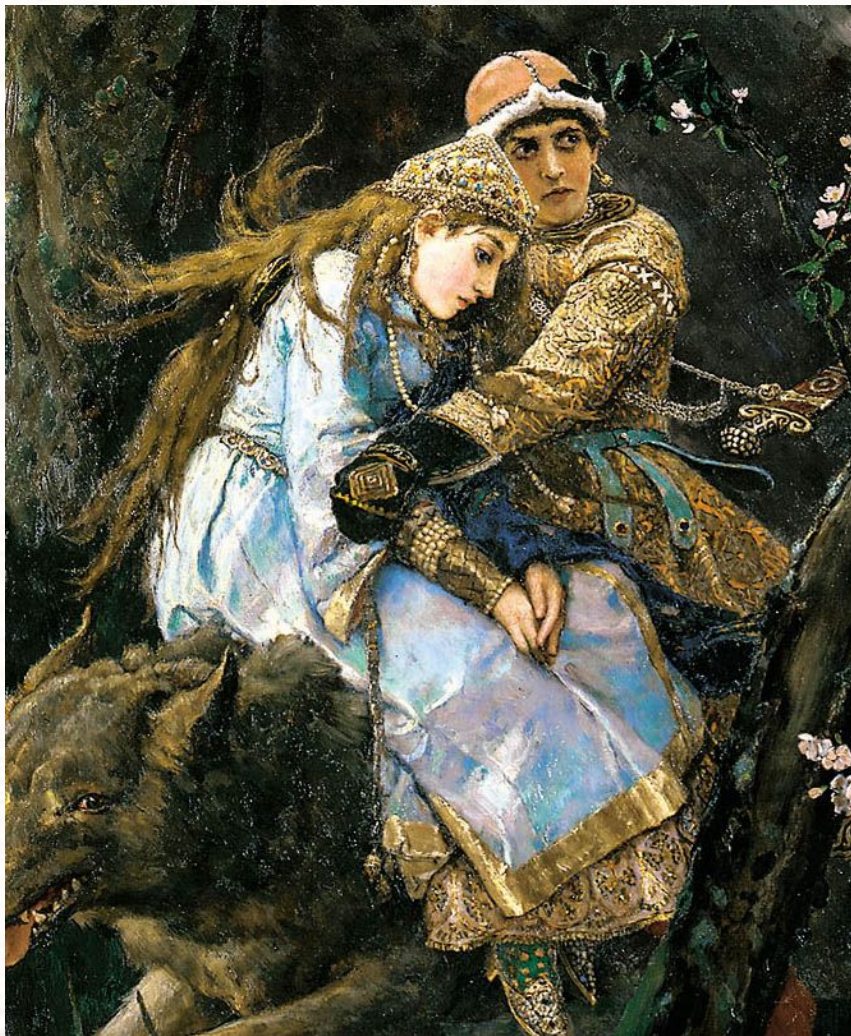
В. Васнецов. Иван-царевич на сером волке