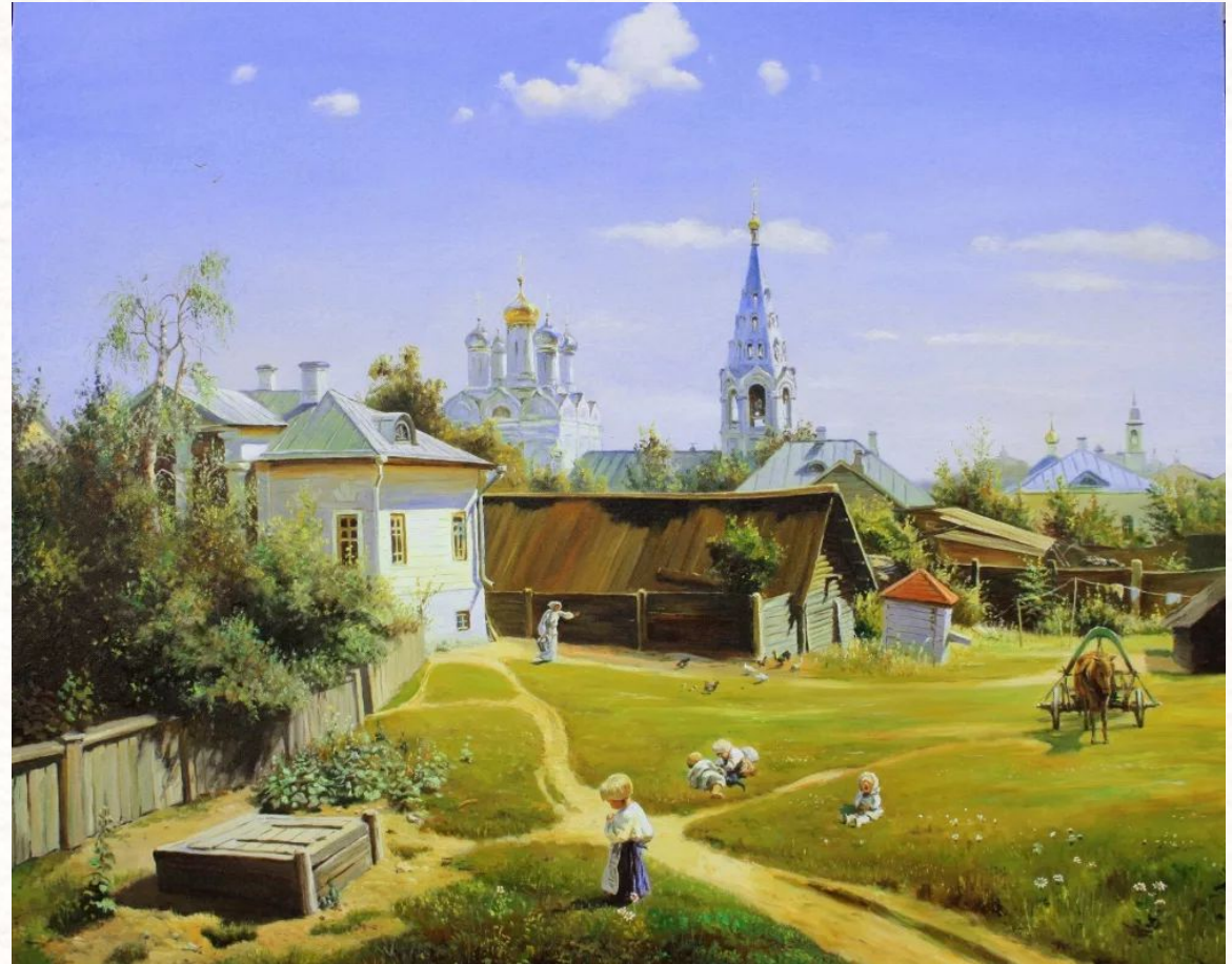
В. Поленов. Московский дворик

Определи, что на картине ближе, что дальше. Обрати внимание на технику живописи. Вернись к общей оценке картины.