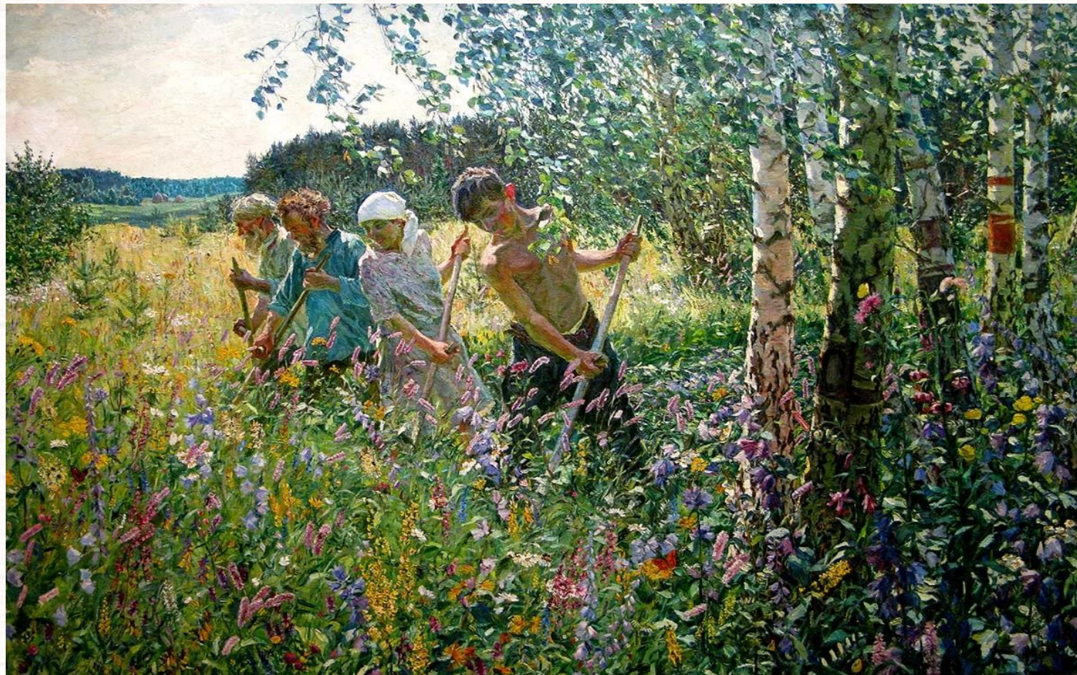
А. Пластов. Сенокос

Красками художники пишут картины, а не рисуют.