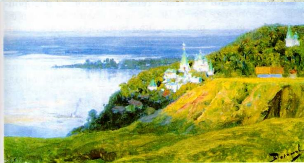
В. Поленов. Монастырь над рекой