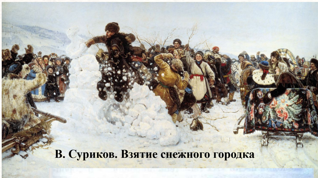
В. Суриков. Взятие снежного городка

Живописные картины пишут масляными красками на холсте, акварелью, гуашью.