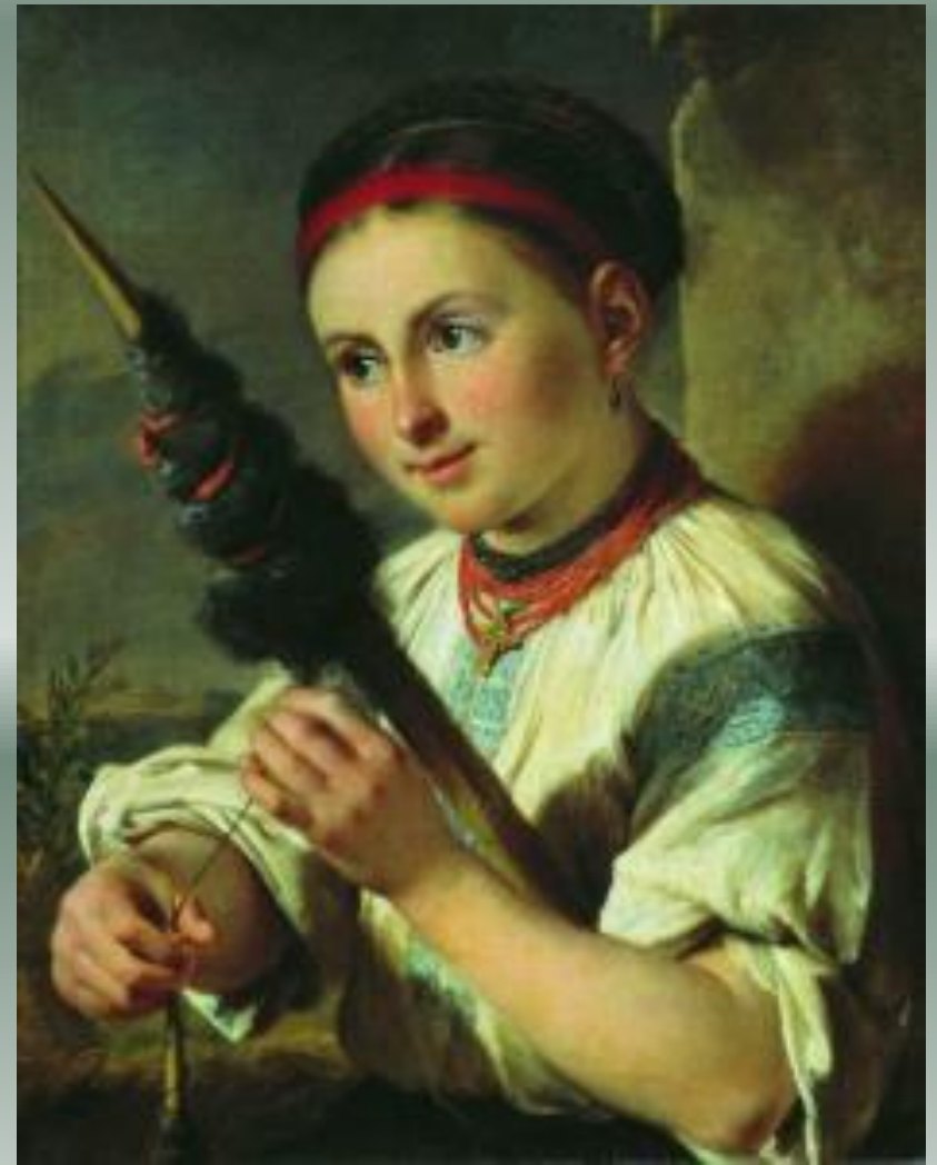
В.А. Тропинин. Пряха.