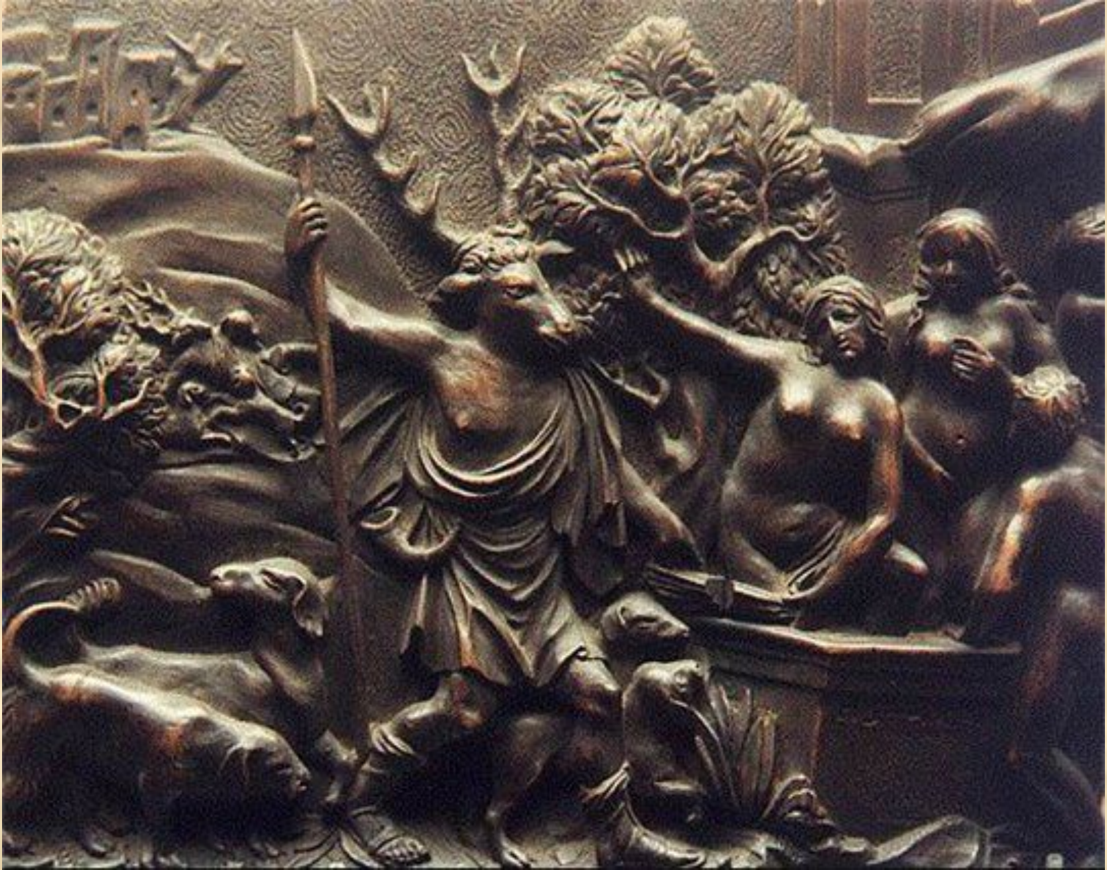
Артемида превращает Актеона в оленя. (барельеф 17 в.), Германия