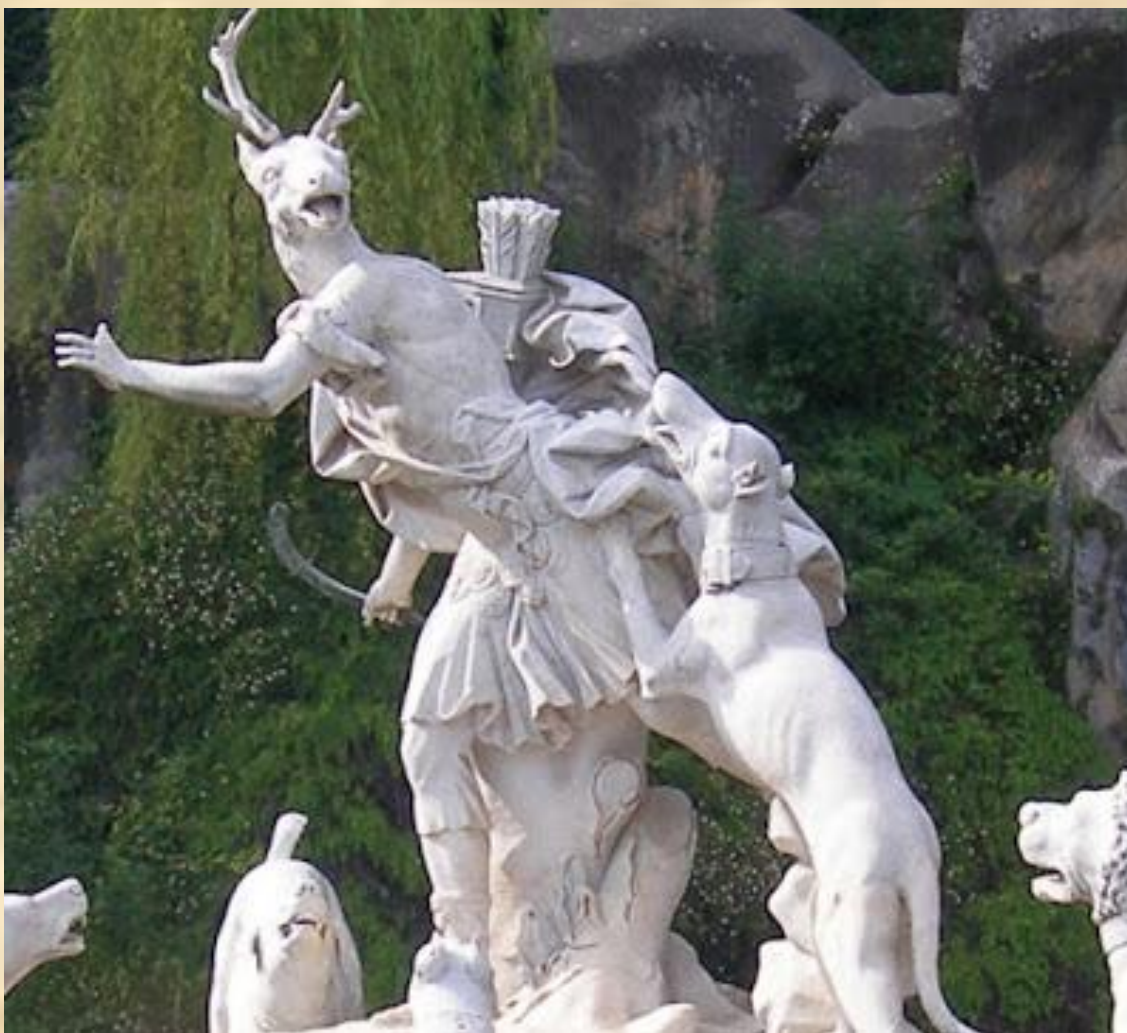
Водопады Дианы (скульптурная группа Актеон) в парке королевского дворца в Казерте (Италия)