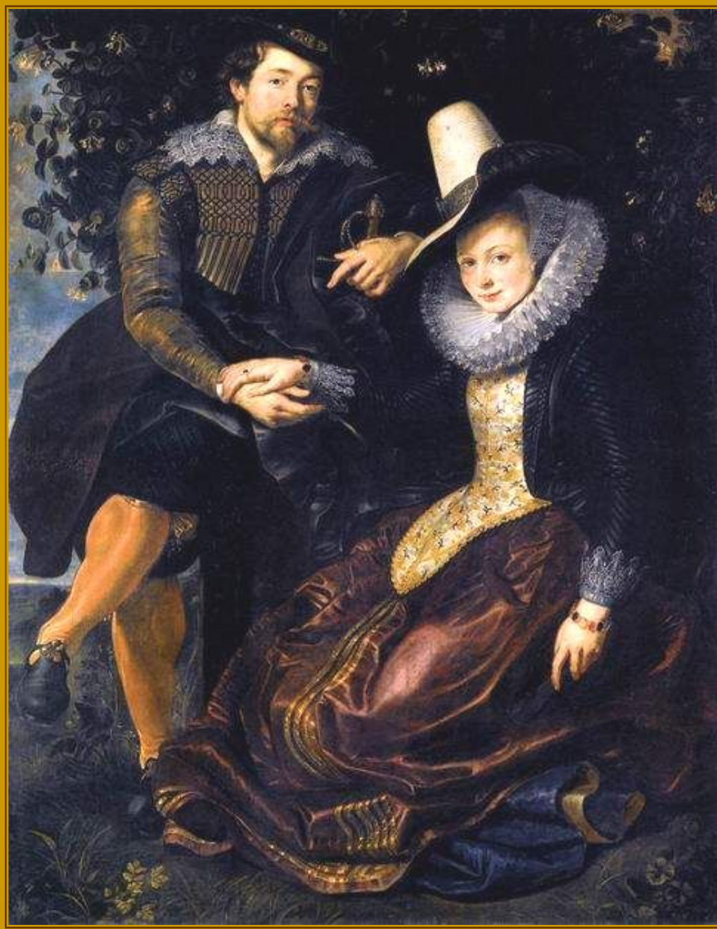
Питер Пауль Рубенс Автопортрет Рубенса с первой женой Изабеллой Брант 1609 – 1610

Холст, масло, 178x136. Альт Пинакотека, Мюнхен