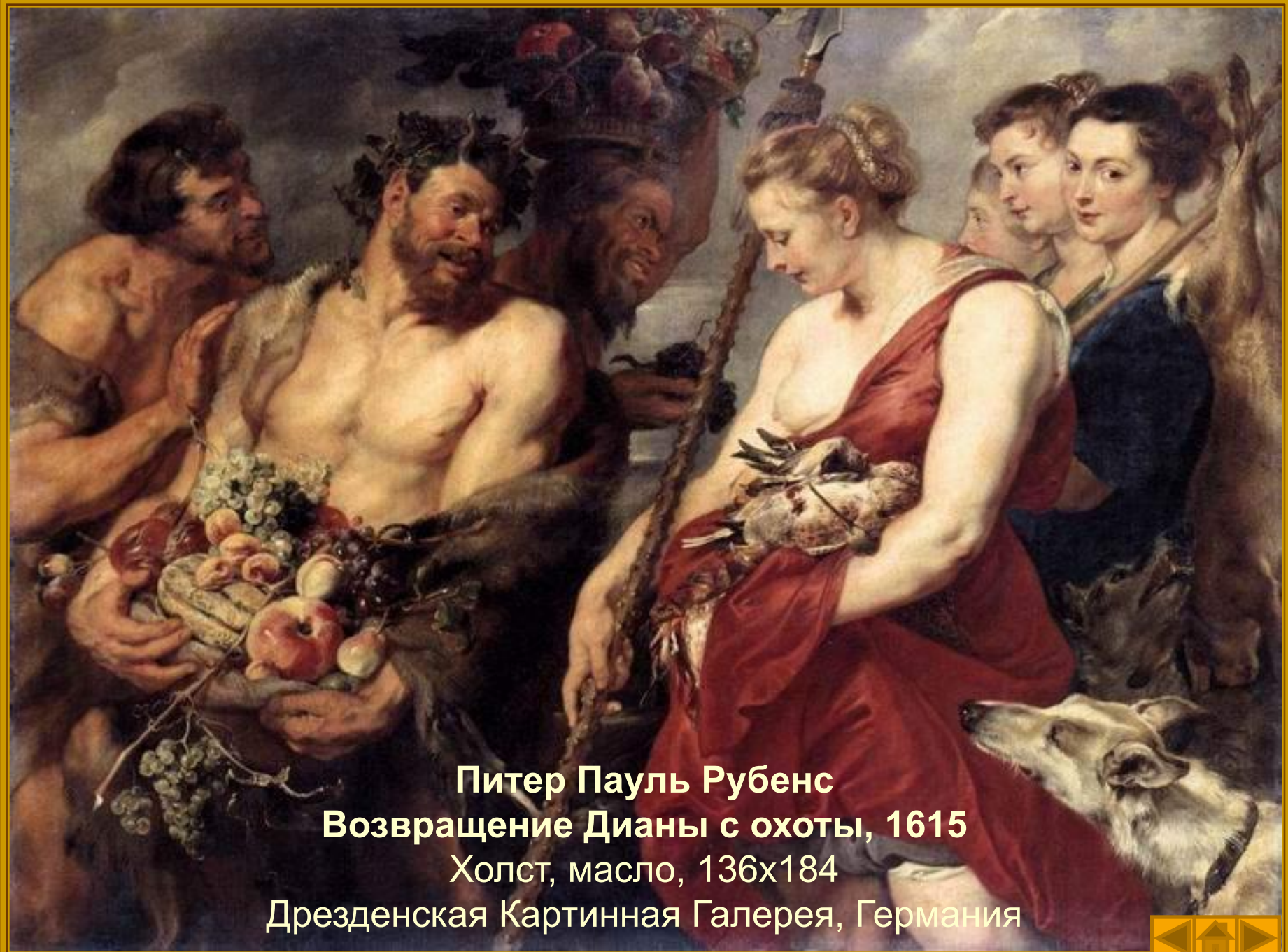
Питер Пауль Рубенс Возвращение Дианы с охоты, 1615 Холст, масло, 136x184 Дрезденская Картинная Галерея, Германия