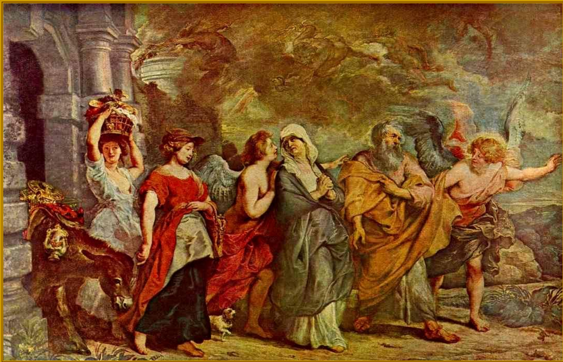
Питер Пауль Рубенс. Бегство Лота, 1622