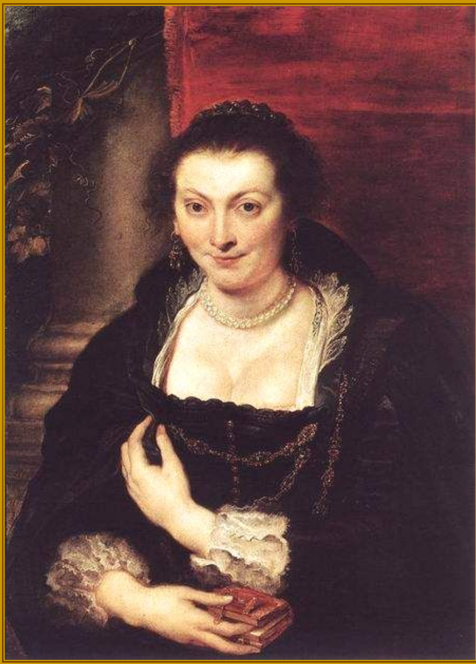
Питер Пауль Рубенс Изабелла Брант жена Рубенса, 1626 Холст, масло, 86х62 Галерея Уффици, Флоренция