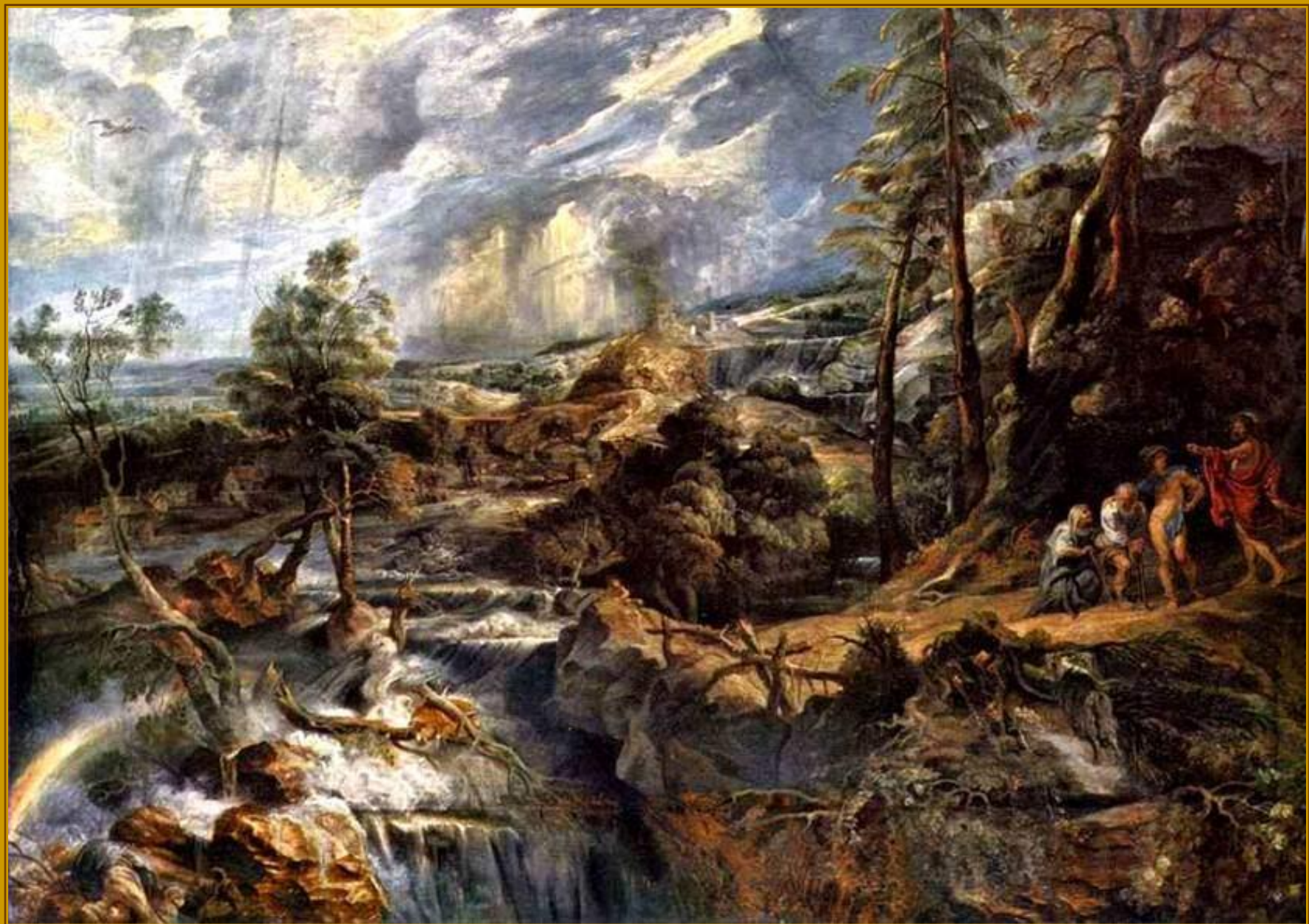
Питер Пауль Рубенс. Пейзаж с Филемоном и Бавкидой 1637