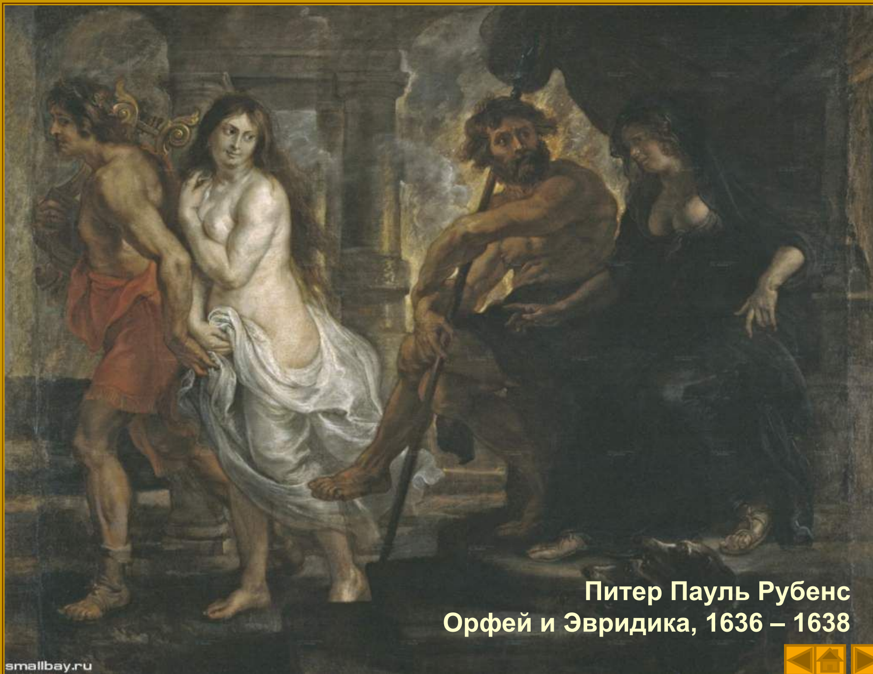
Питер Пауль Рубенс Орфей и Эвридика, 1636 – 1638