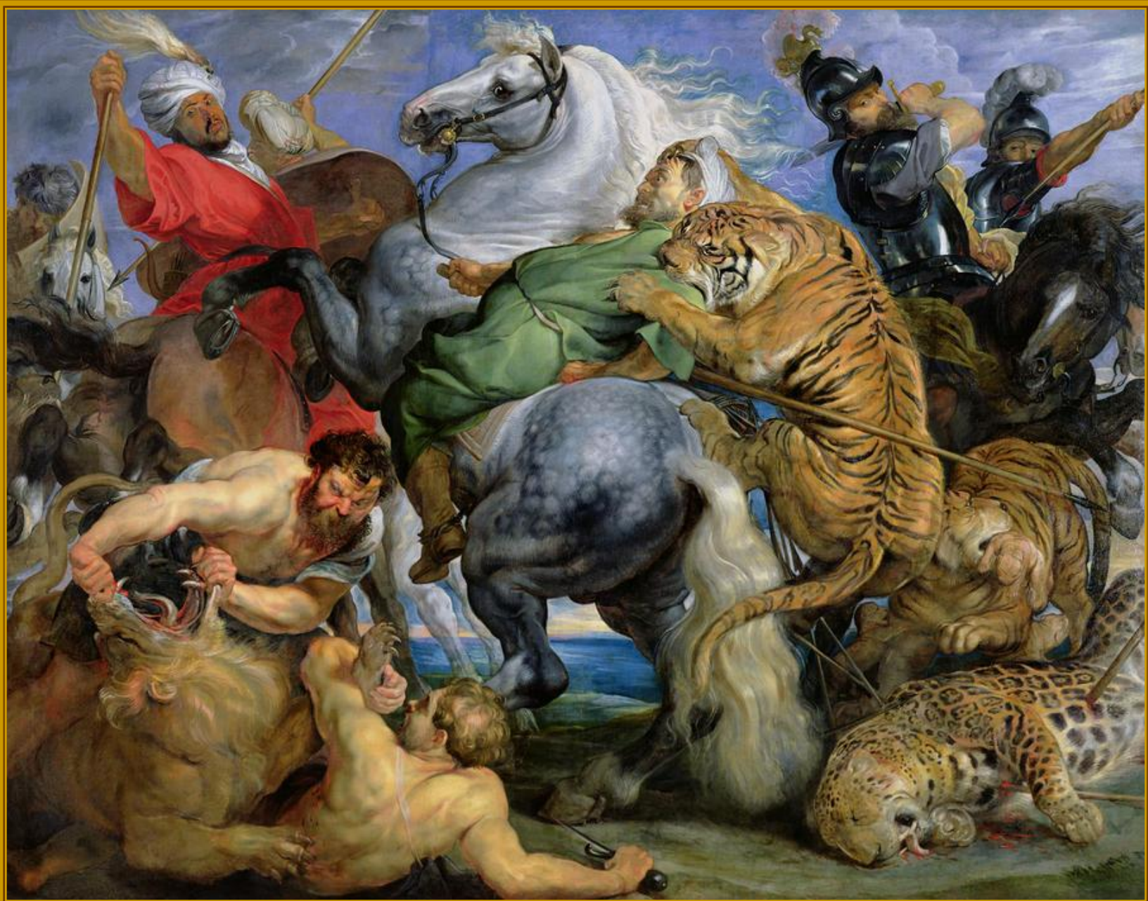
Питер Пауль Рубенс. Охота на тигров. 1616