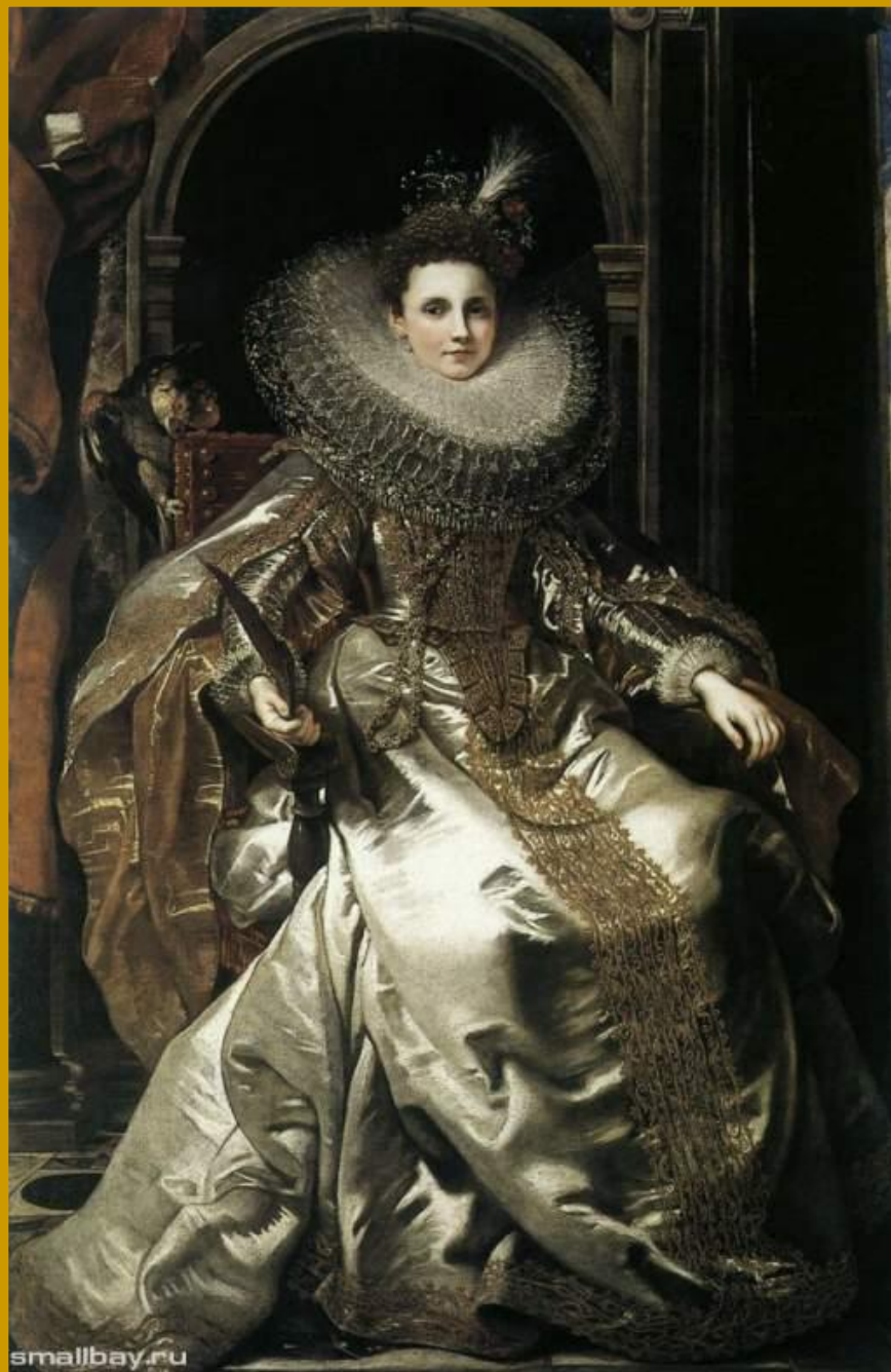
Питер Пауль Рубенс Мария Паллавичино 1606