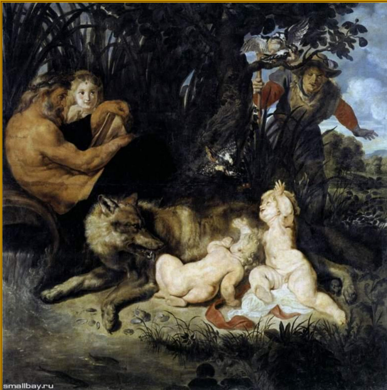
Питер Пауль Рубенс Ромул и Рем с волчицей, 1616 Капитолийская пинакотека, Рим