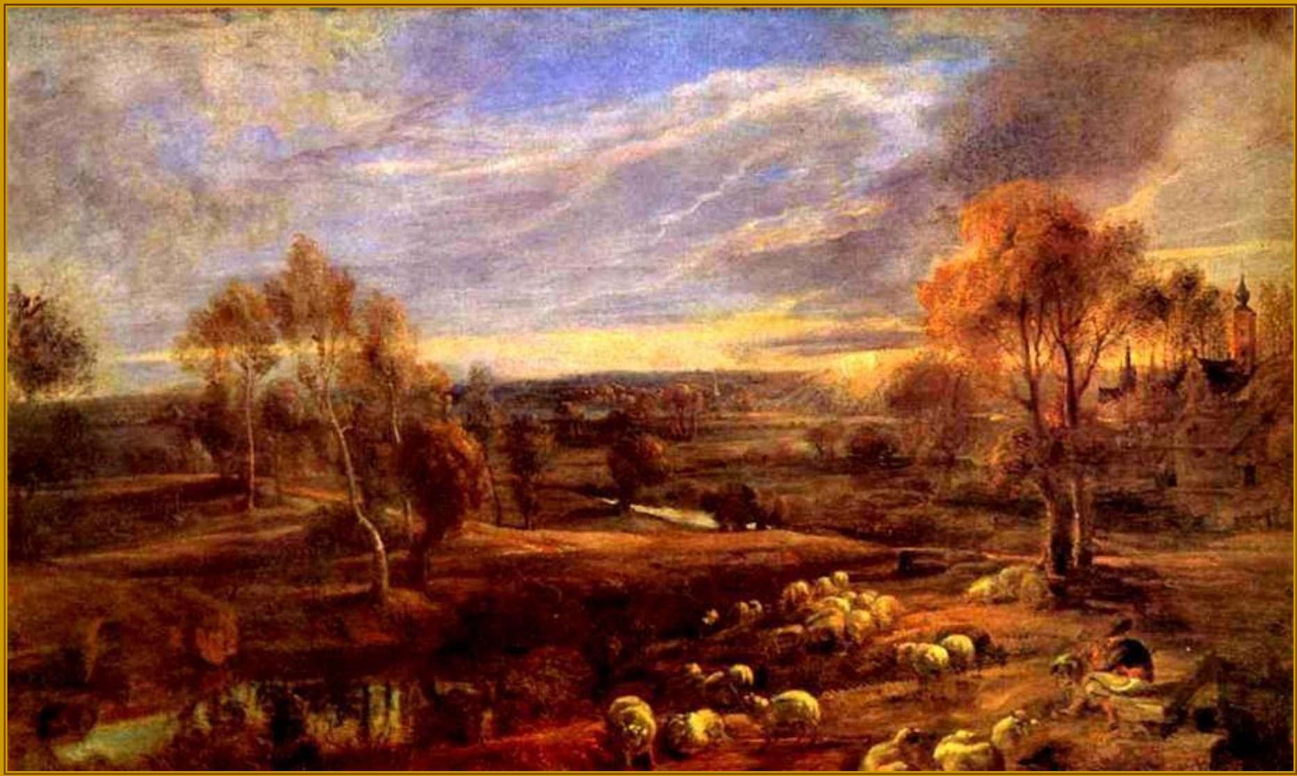
Питер Пауль Рубенс. Пейзаж с заходящим солнцем, 1635 – 1640