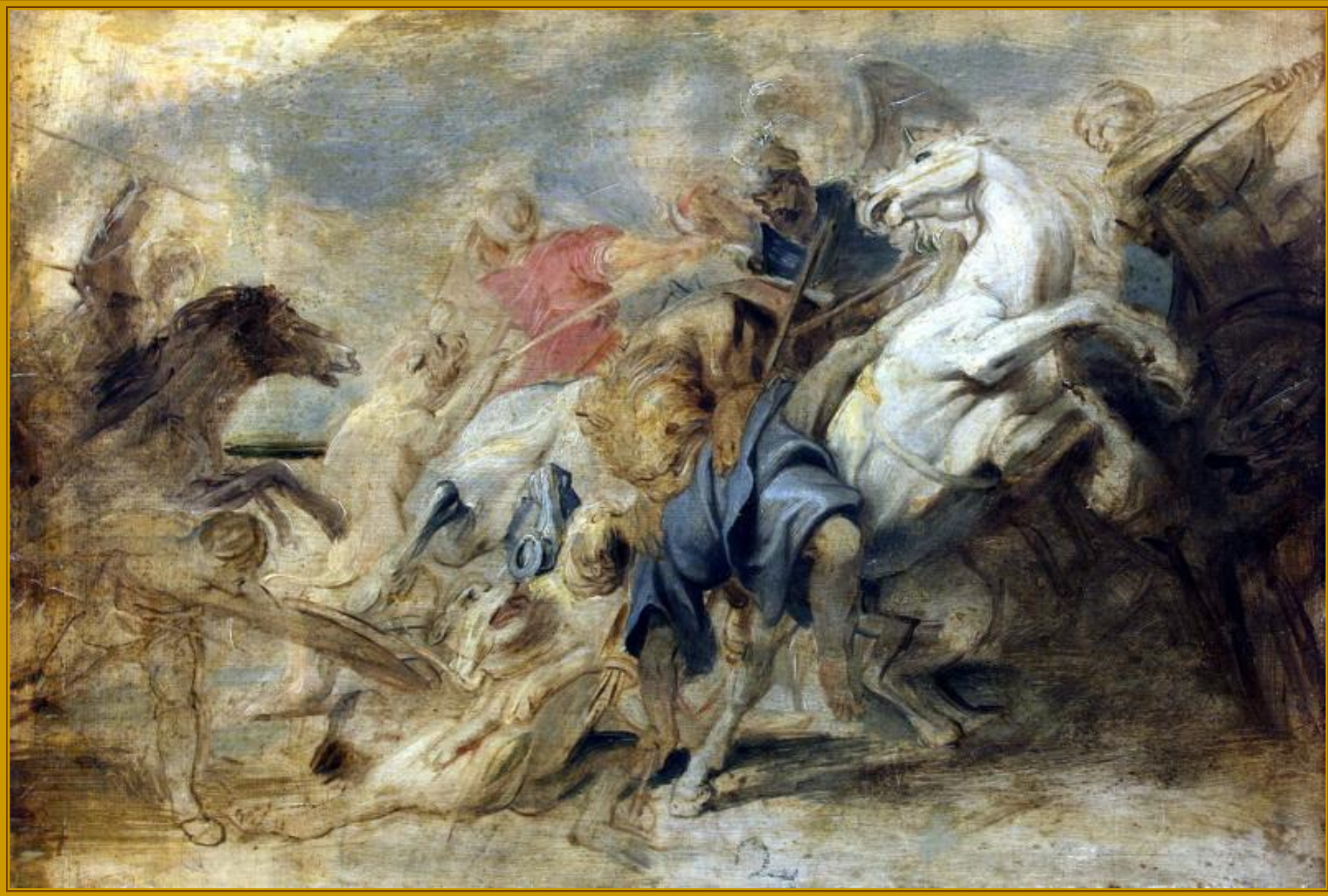
Питер Пауль Рубенс. Охота на льва. 1615 – 1618 Старая Пинакотека, Мюнхен