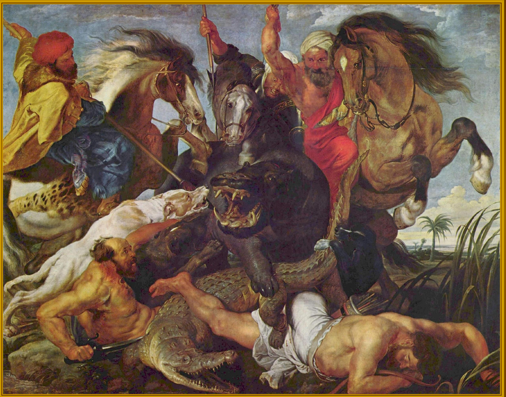
Питер Пауль Рубенс. Охота на гиппопотама. 1618