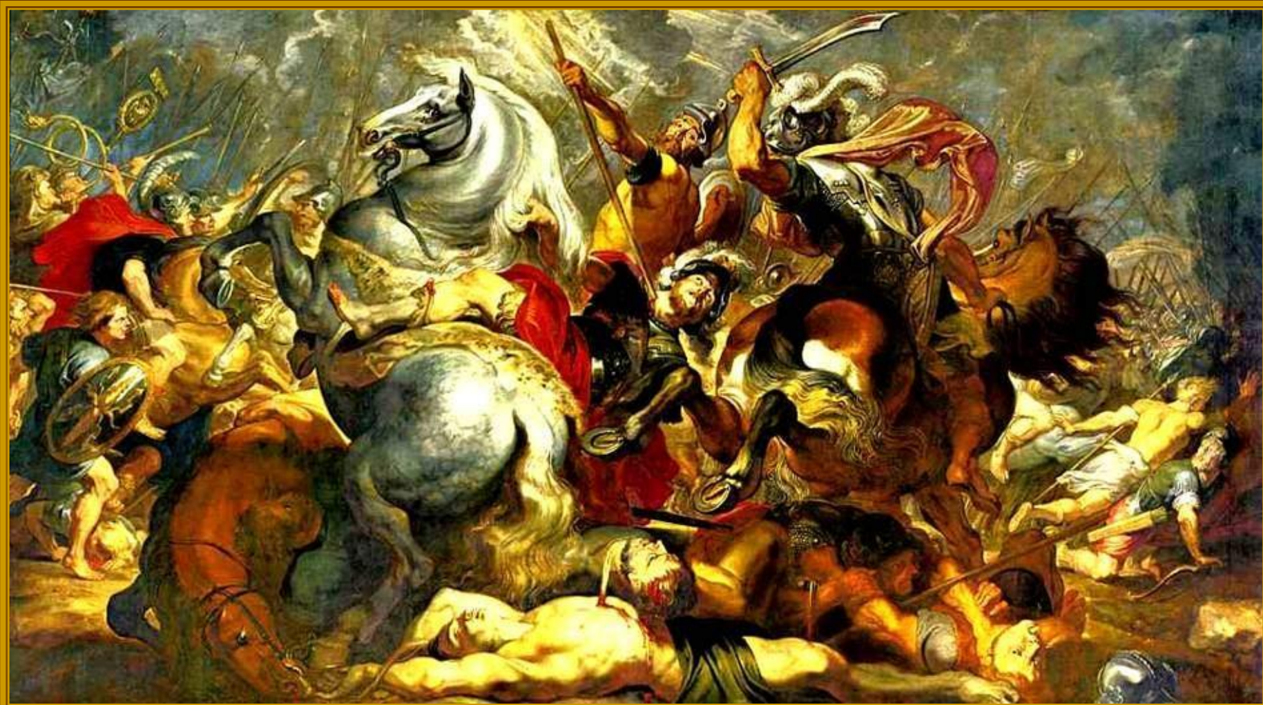
Питер Пауль Рубенс Победа и смерть консула Деция Муса в бою, 1617