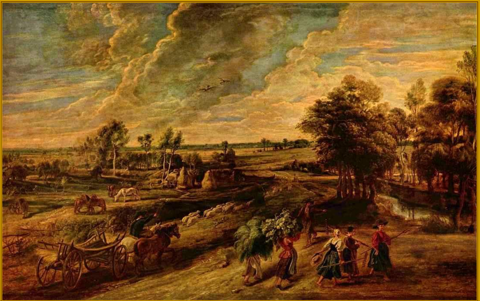
Питер Пауль Рубенс. Возвращение крестьян с поля, 1637