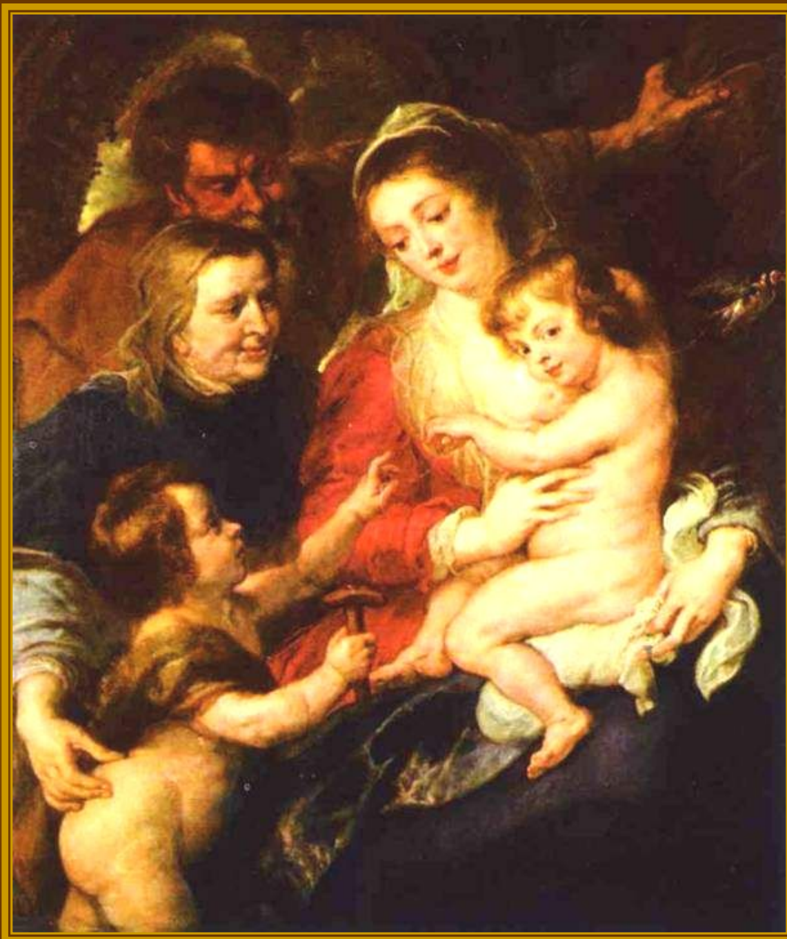
Питер Пауль Рубенс Святое семейство со святыми Елизаветой и Иоанном, 1635