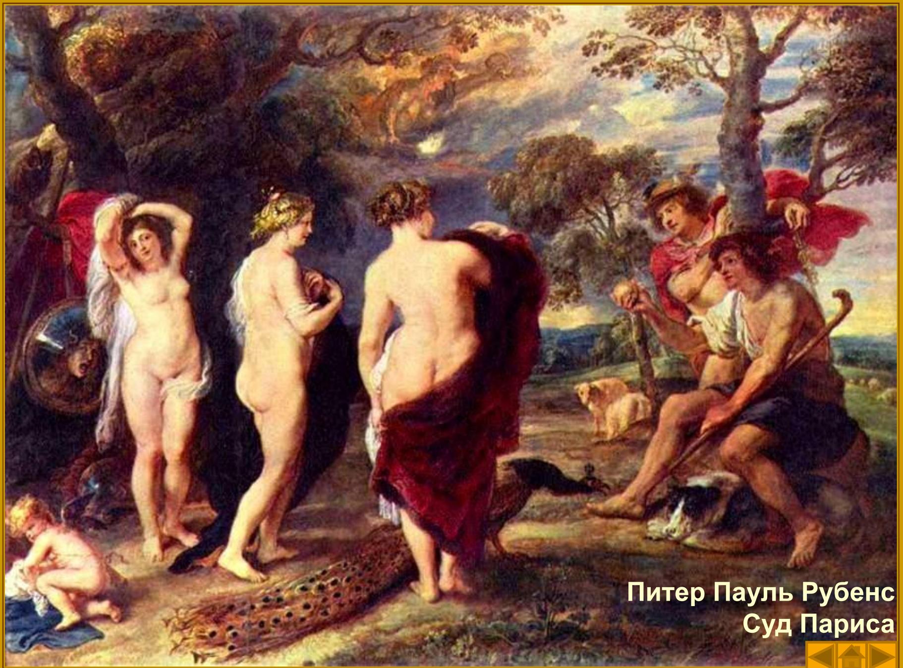
Питер Пауль Рубенс Суд Париса