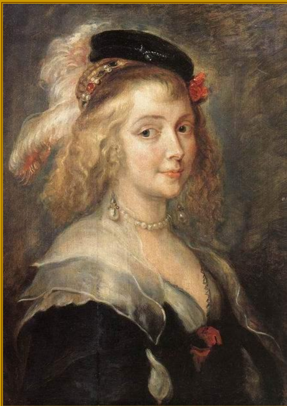
Питер Пауль Рубенс Портрет Елены Фоурмен, второй жены художника 1630

Холст, масло, 262х206 Королевский Музей Изобразительных Искусств, Брюссель