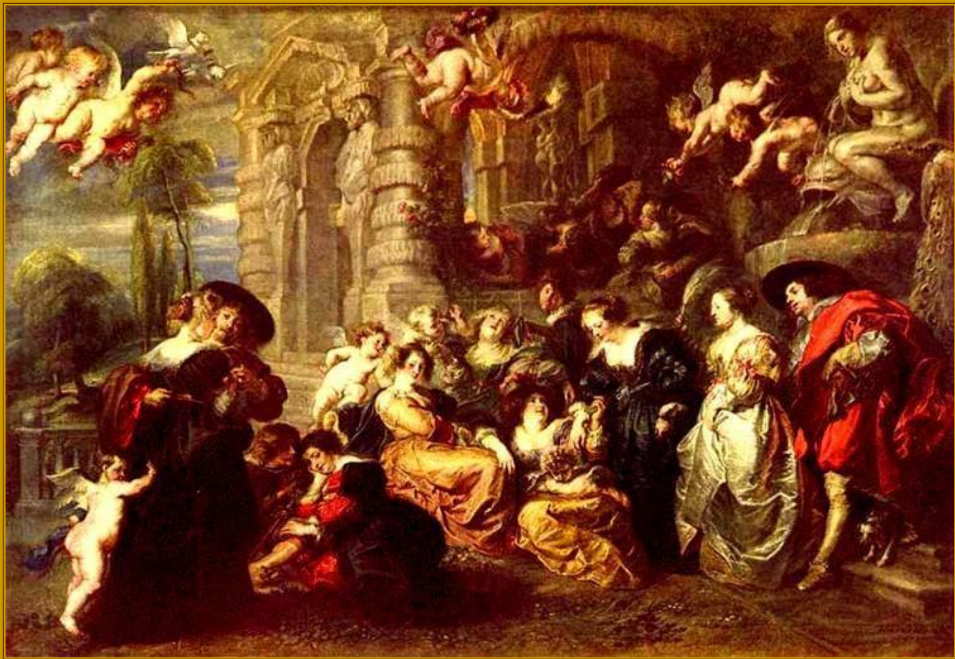
Питер Пауль Рубенс. Сад любви, 1631