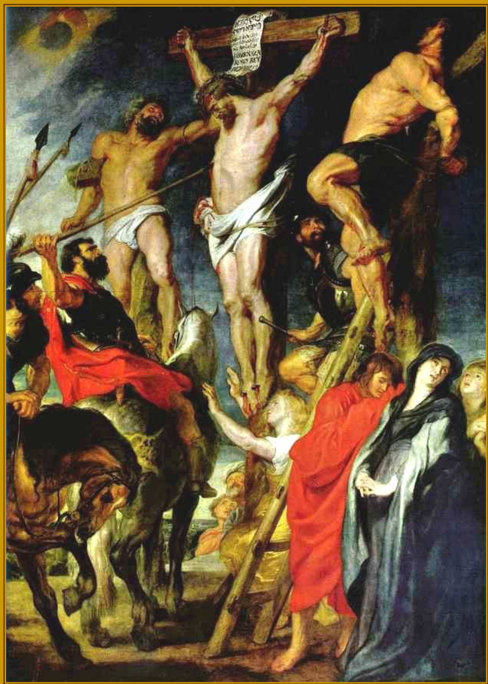
Питер Пауль Рубенс Распятие (Удар копья), 1610