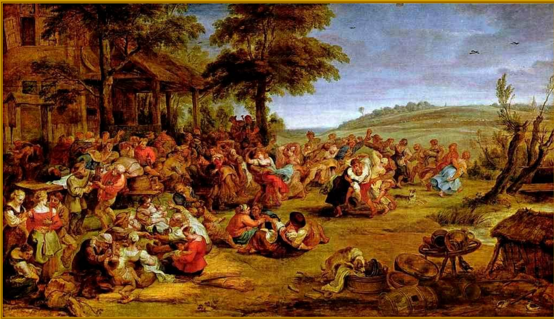
Питер Пауль Рубенс. Кермесса, 1635 – 1638