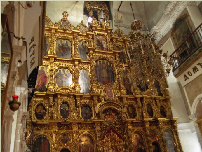
Высокий иконостас. (Схема.)