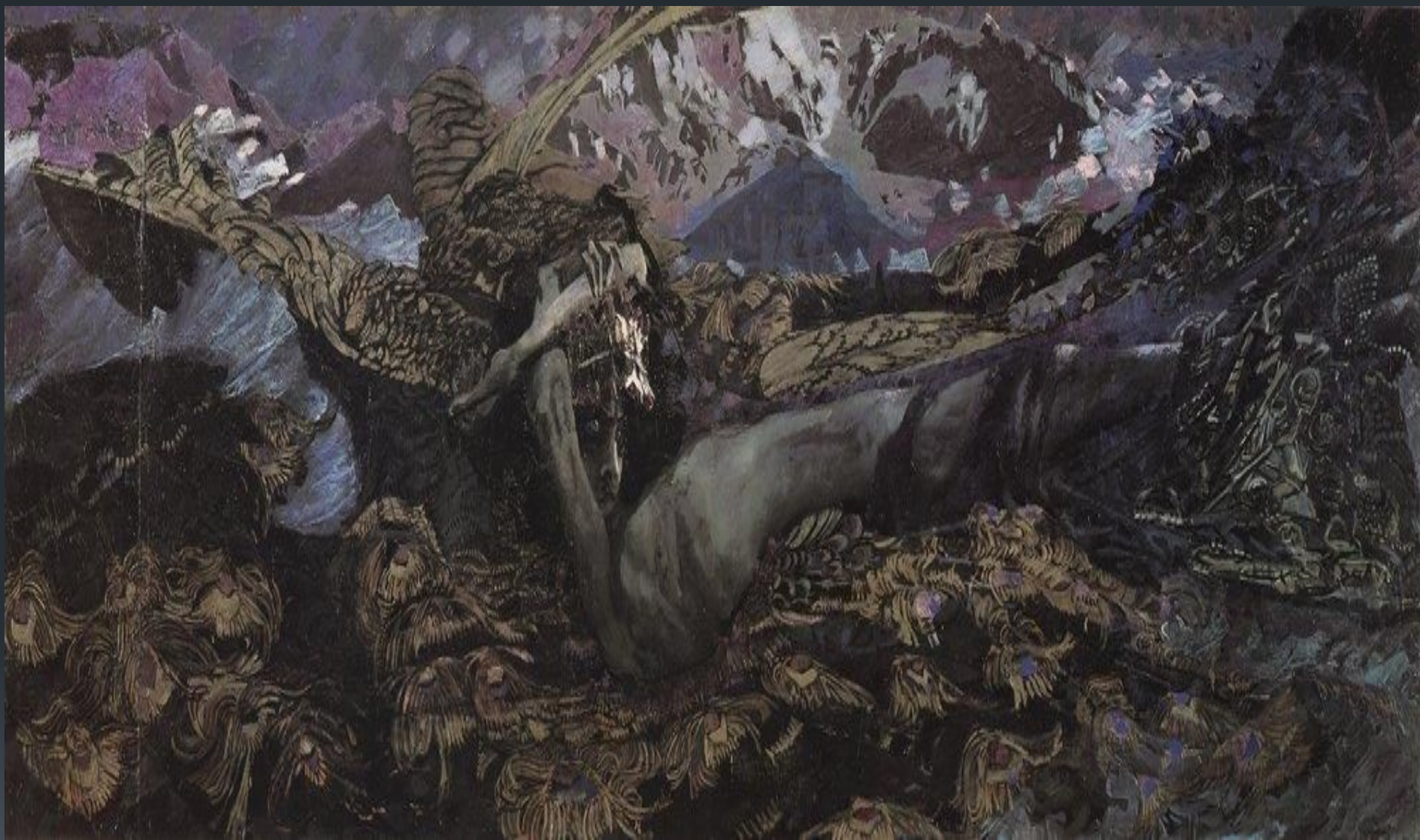
Демон поверженный. 1902