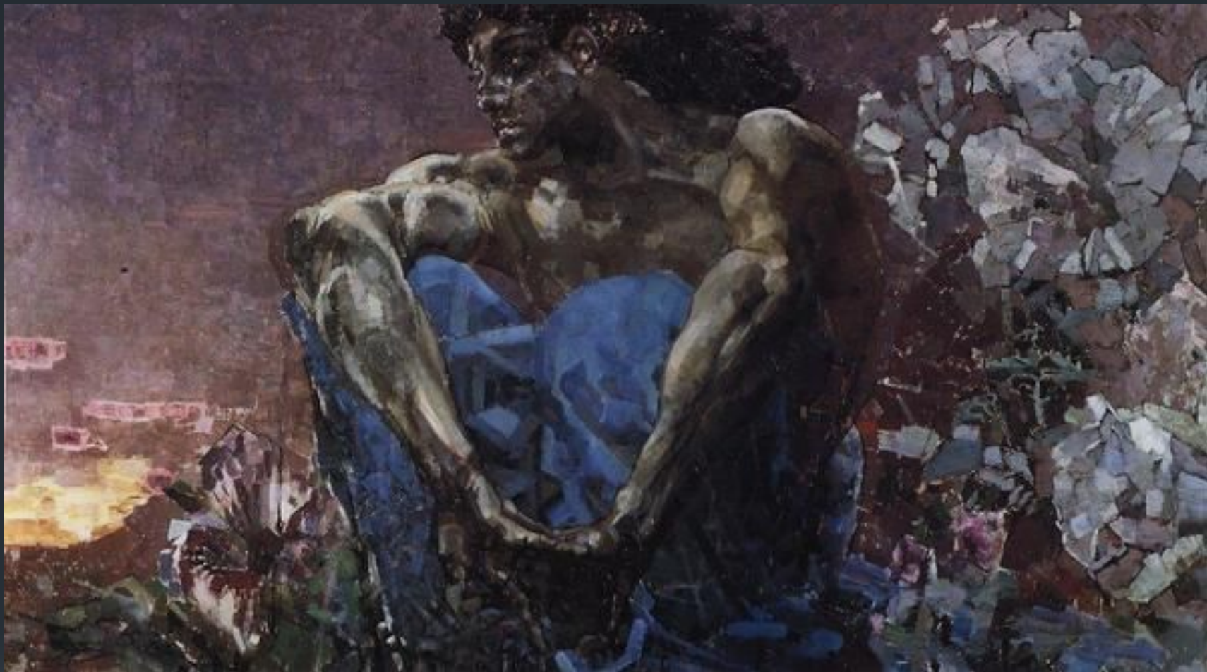
Мир Врубеля. Демон сидящий. 1890

Врубель работал точно одержимый. И написанная плоть оживала, наполнялась реальной силой. Демон на глазах всё рос и рос, придвигался к краю картины, заполнял собой весь холст, не уместался на холсте, и Врубель собственноручно подшивал новые куски.