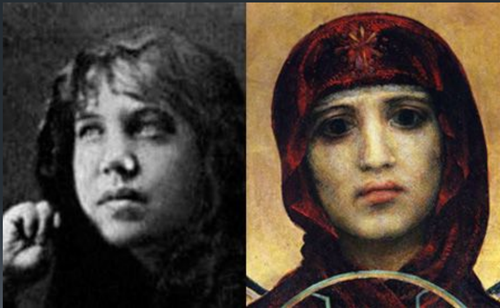
Эмилия Прахова, фотография 1870