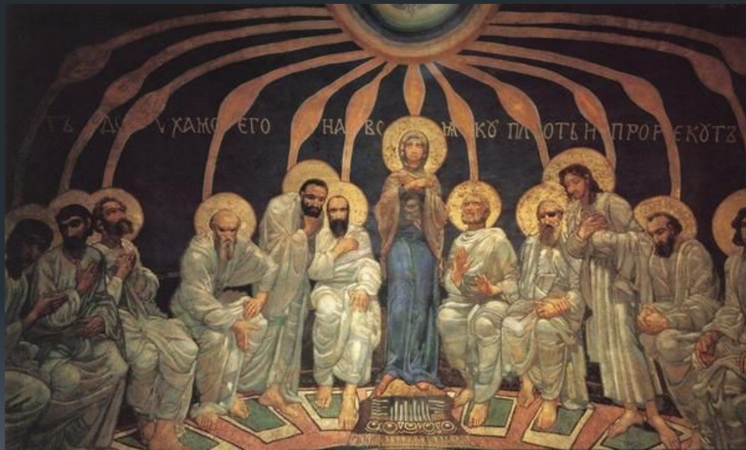
Сошествие Святого Духа на Апостолов. 1885 г.

Несмотря на свой великий дар, при жизни Михаил Александрович Врубель так и не был понят. Вся его живопись была наполнена тайной. Редкий дар граничил с безумием. И за свой талант художник заплатил немалую цену.