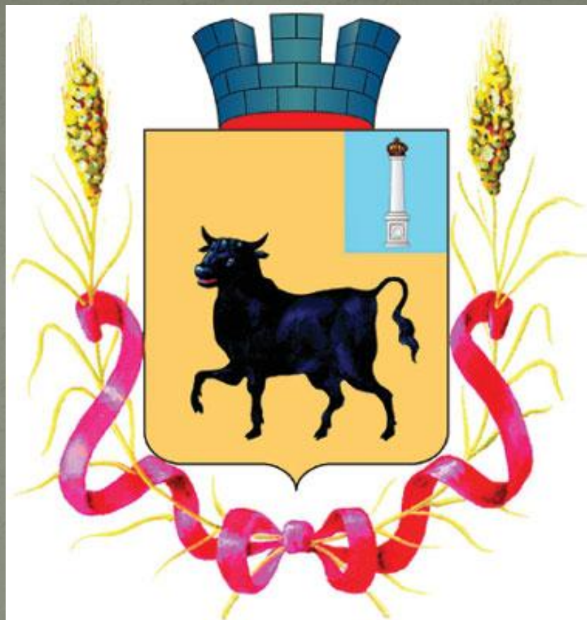
Герб города Сызрани