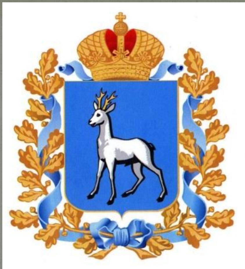
Герб Самарской области