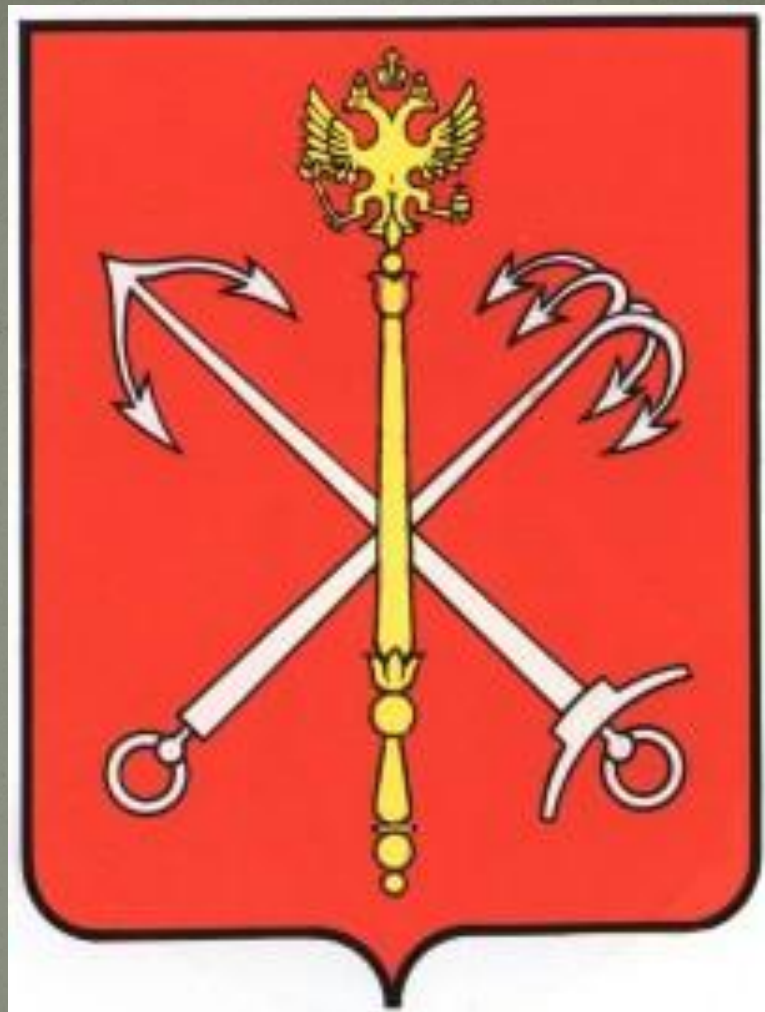
Герб Санкт Петербурга