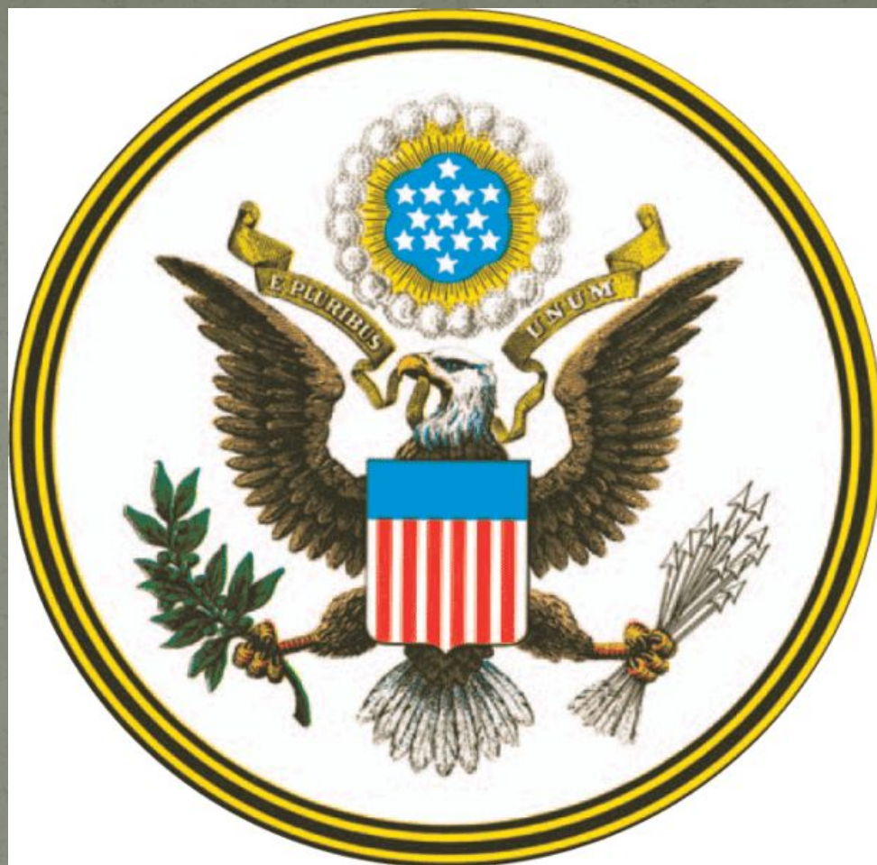
Герб Соединенных Штатов Америки