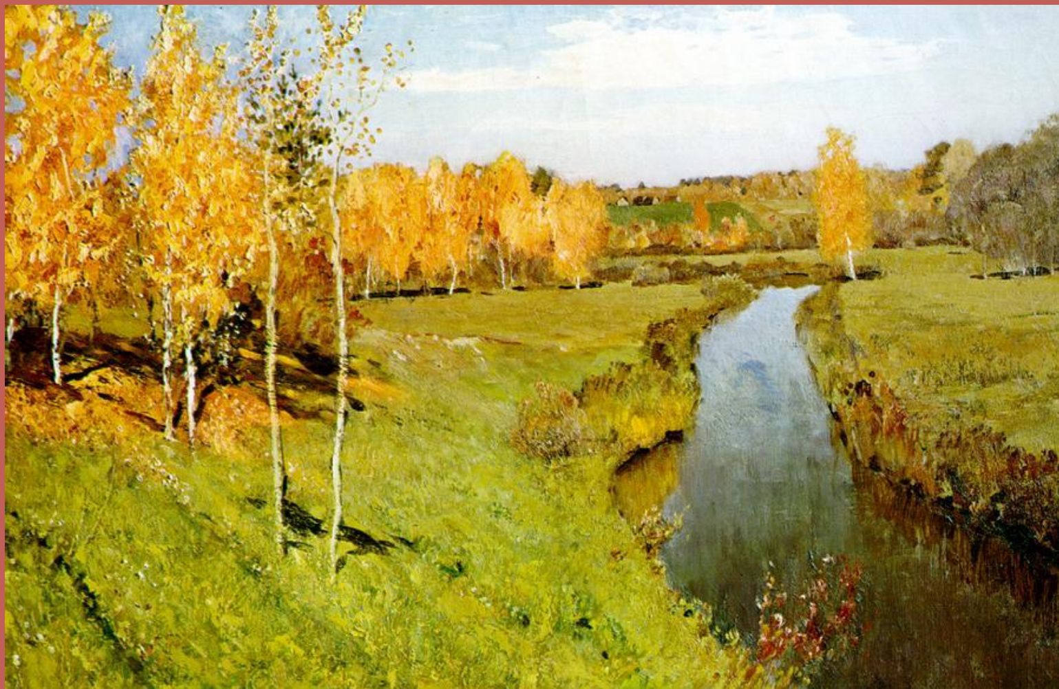
Золотая осень. Исаак Левитан

Ярким примером передачи настроения, красоты осеннего пейзажа с помощью цвета являются картины великих художников.