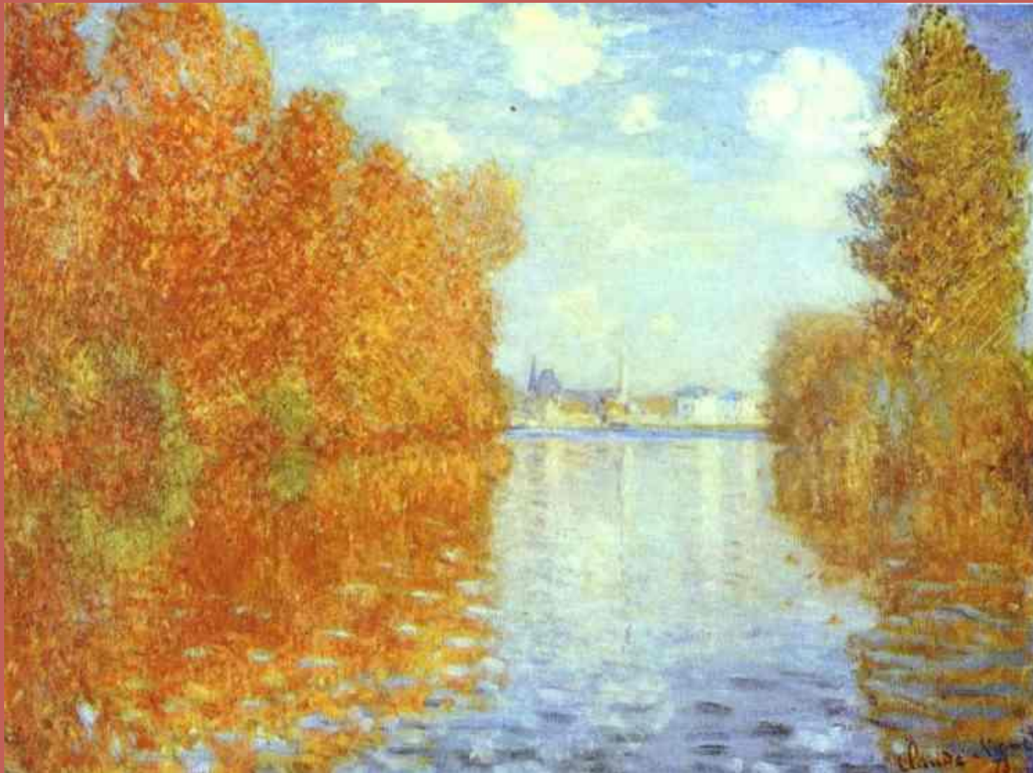
Осень. Клод Моне