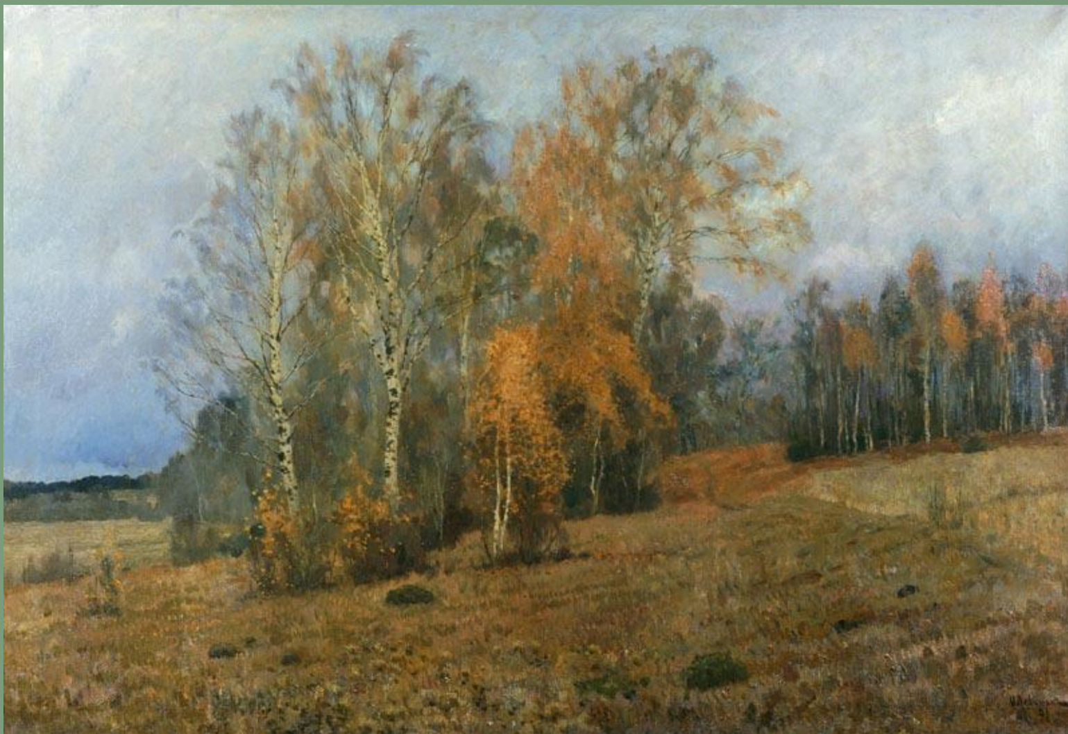
Октябрь. Осень. Исаак Левитан