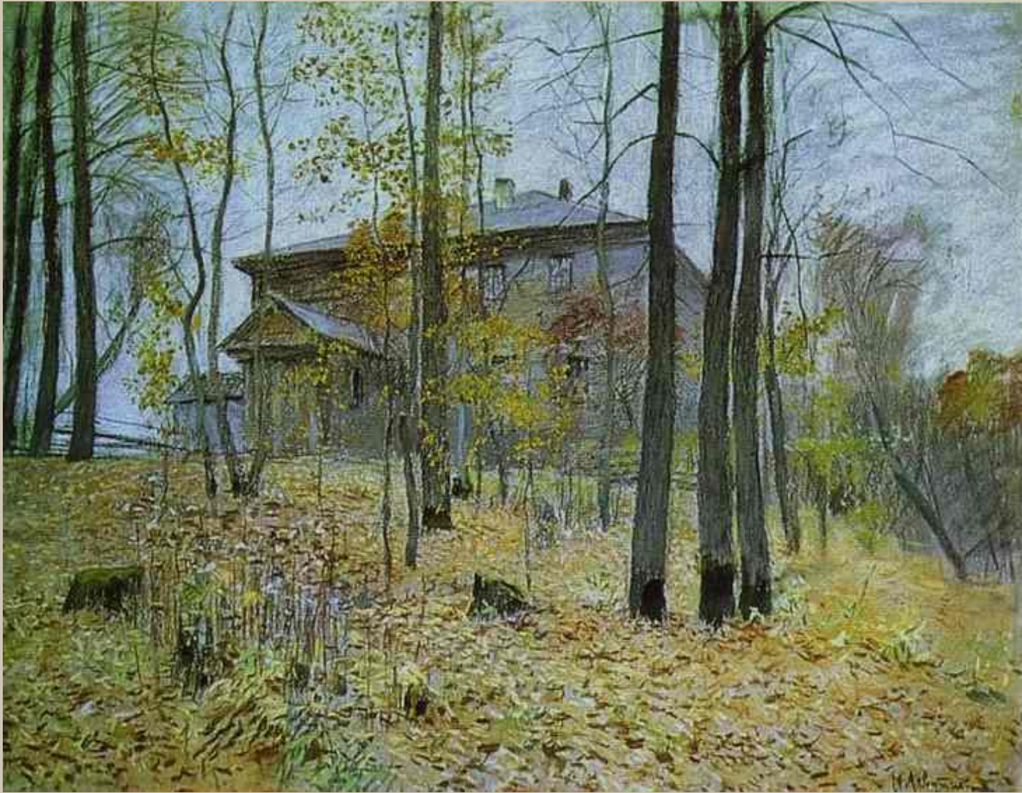
Осень. Поместье. Исаак Левитан