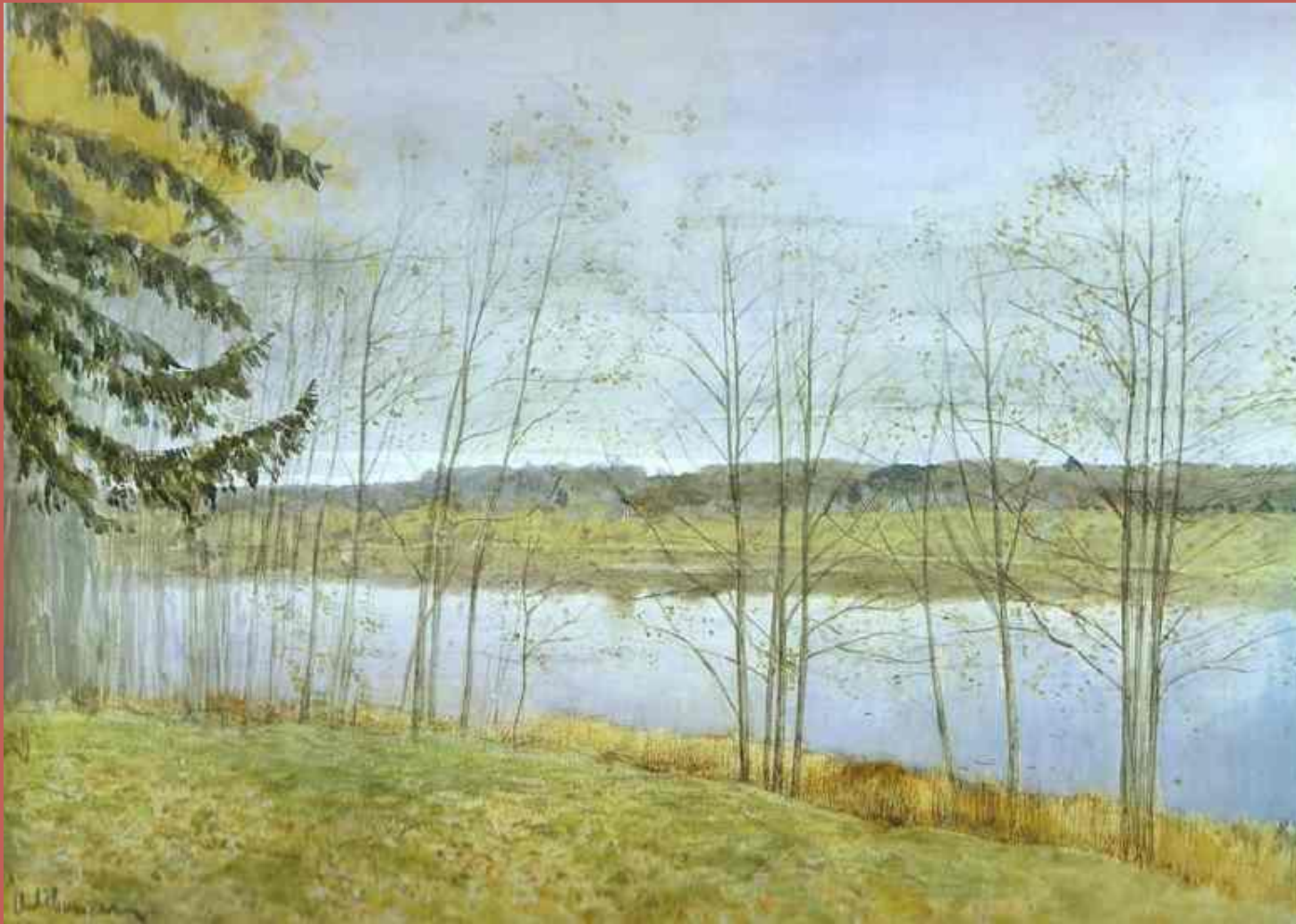
Осень. Исаак Левитан