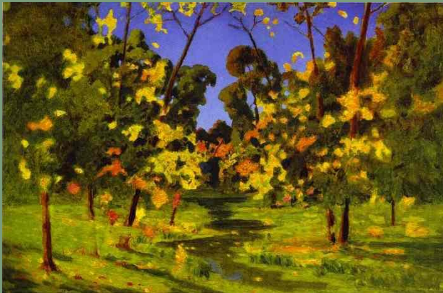
Осень. А.И. Куинджи