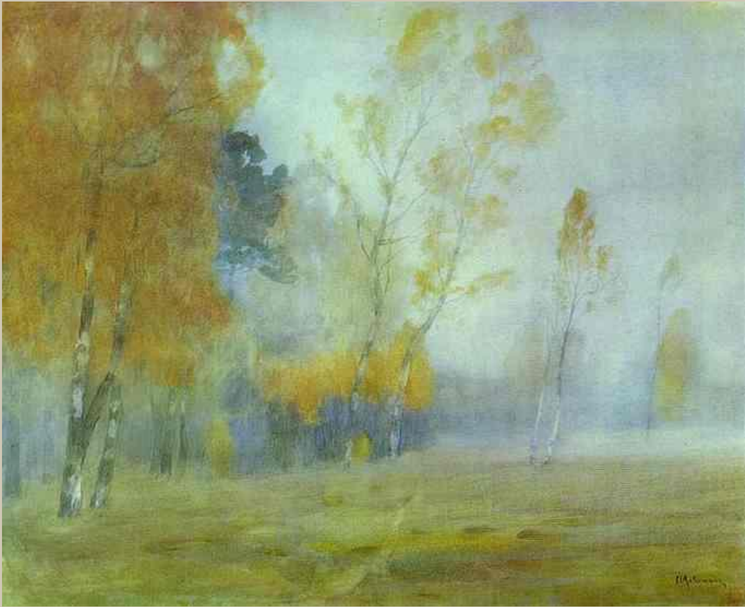
Туман. Осень. Исаак Левитан