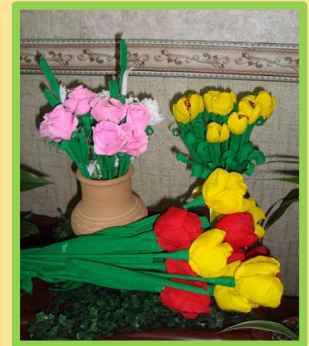
«Натюрморт из цветов»