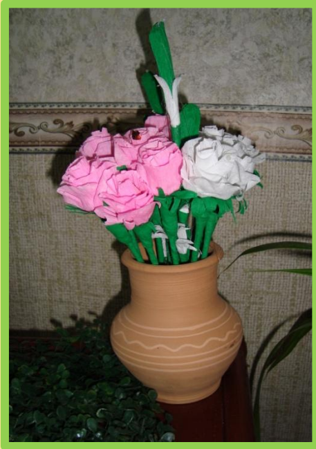
«Букет из роз»