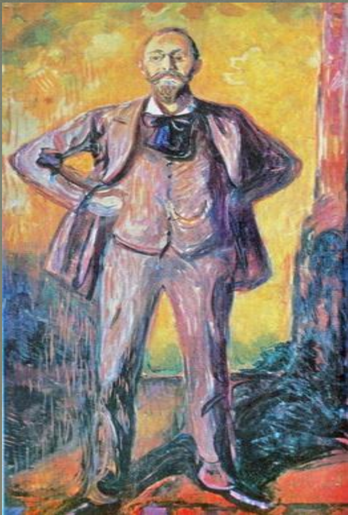
Портрет профессора Даниэля Якобсона