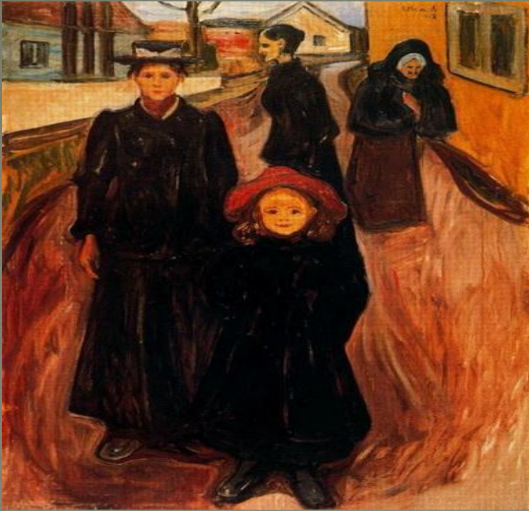
Четыре возраста в жизни