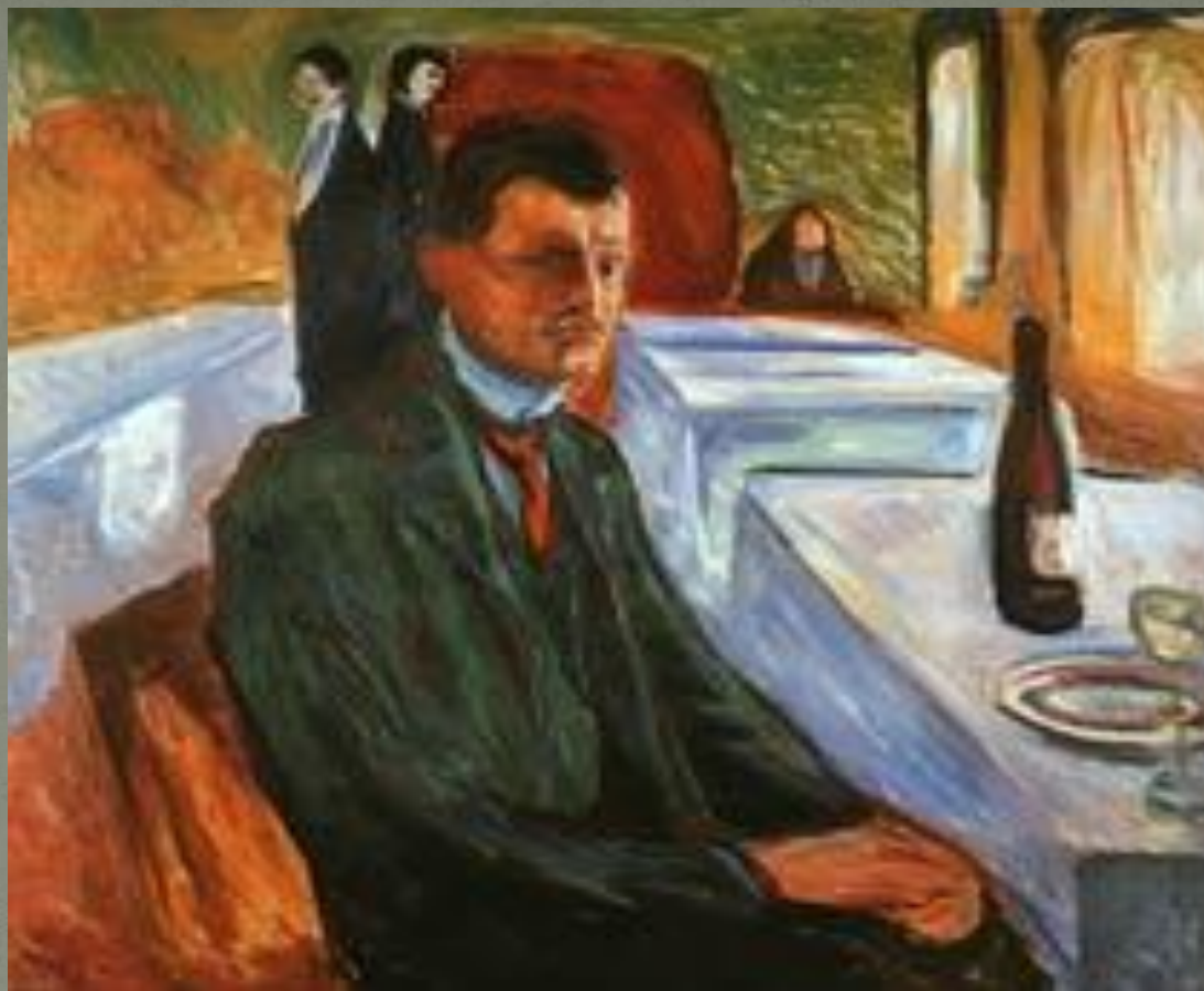
Автопортрет с бутылкой вина