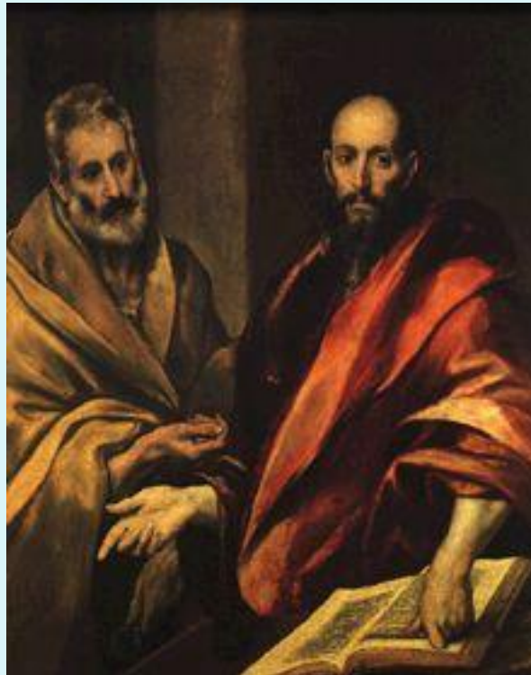
Апостолы Петр и Павел.