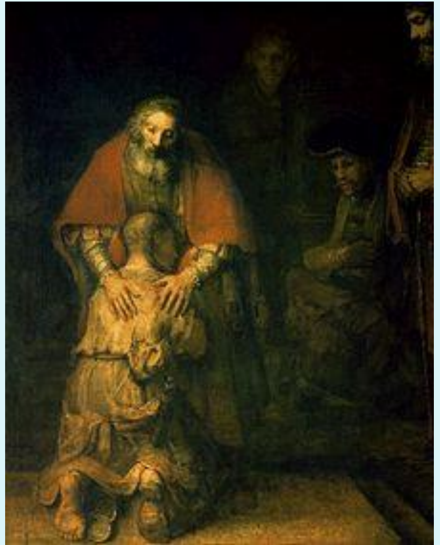
Возвращение блудного сына