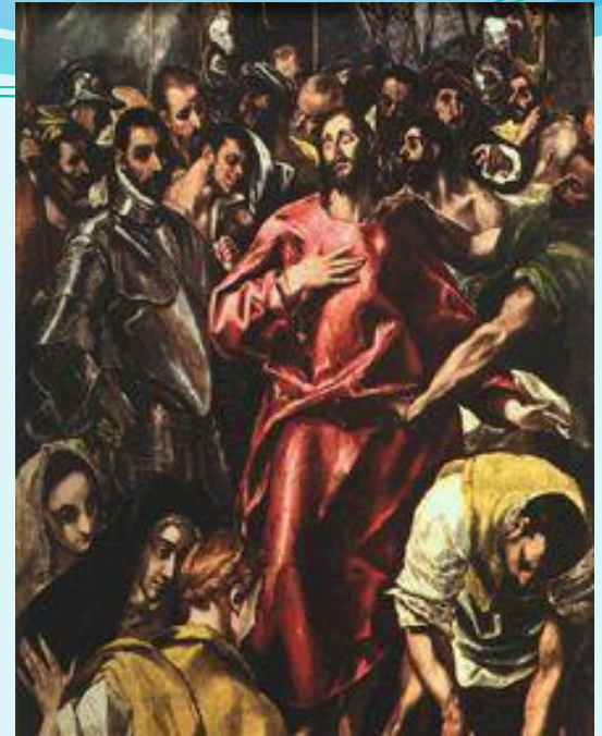
Снятие одежды с Христа.