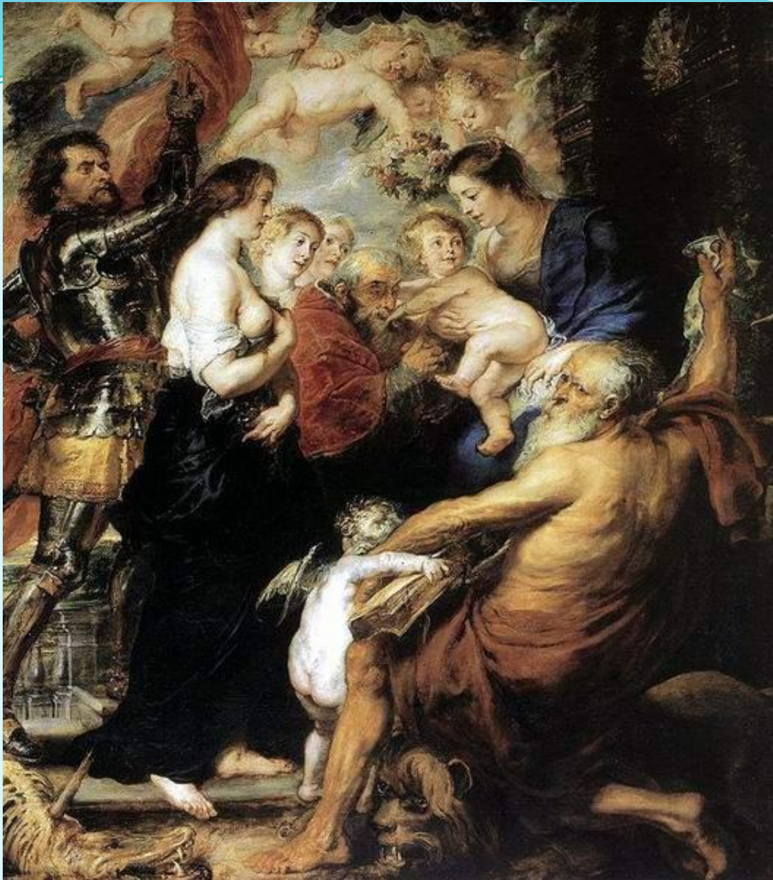
Мадонна со святыми и ангелами, 1634.