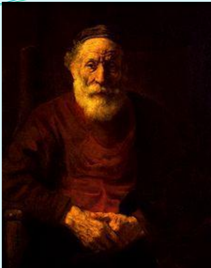
Портрет старика в красном