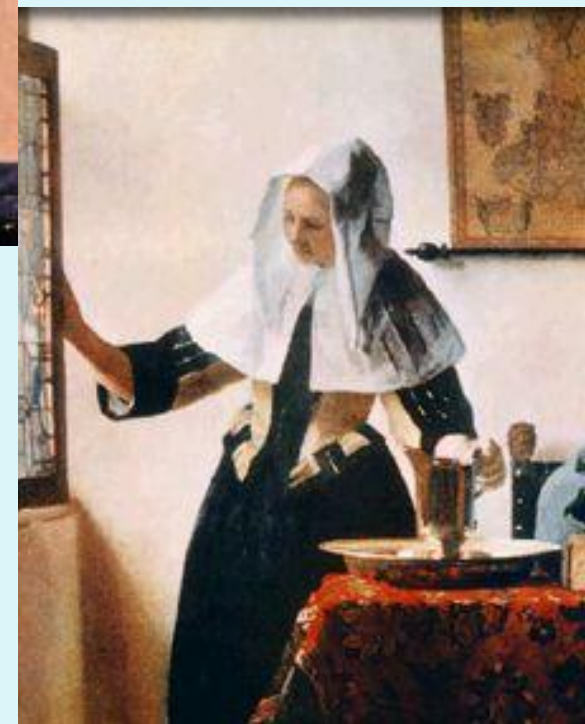
Молодая женщина с кувшином