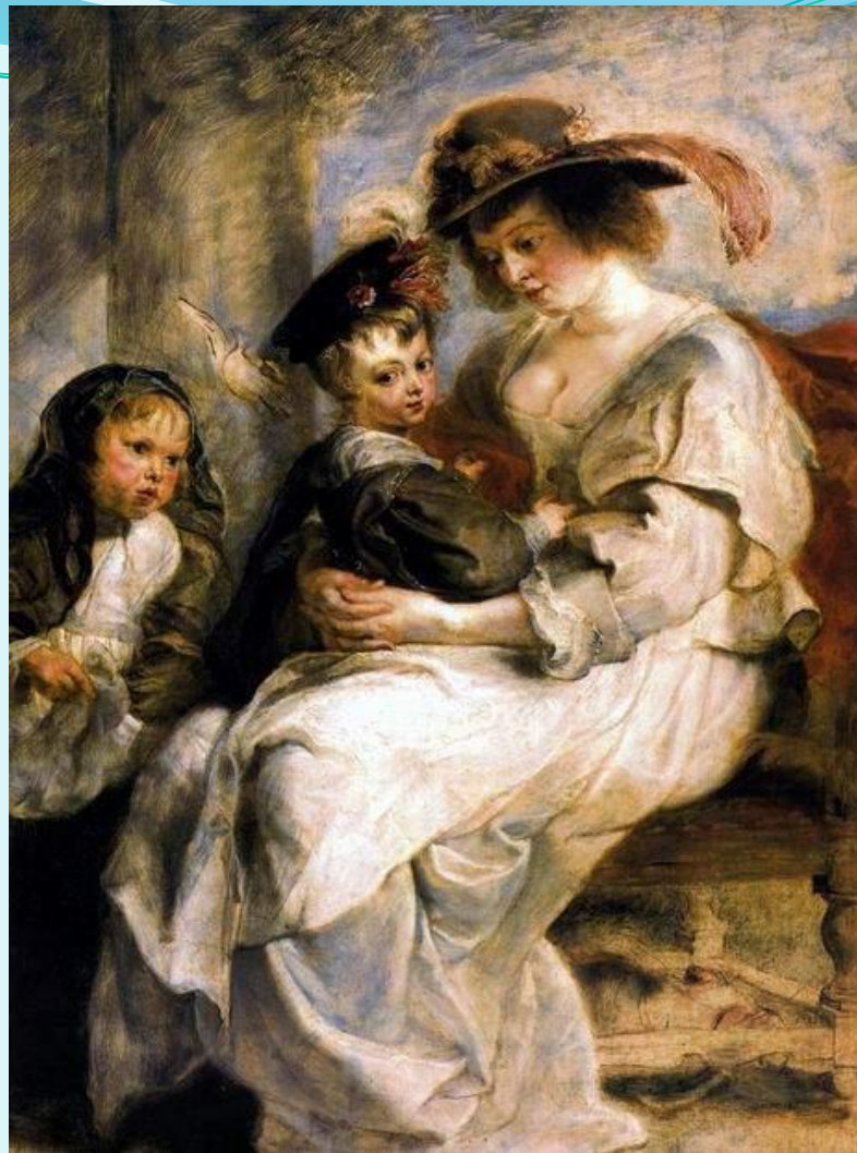
Елена Фоурмен с детьми, 1636-1637.