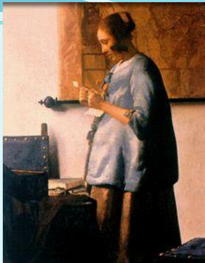
Девушка в голубом, читающая письмо

● Великим «малым голландцем» называют Яна Вермера, вошедшего в историю живописи как Вермер Делфтский. Он писал бесхитростные бытовые сцены и пейзажи. Величие художника в колористических находках, в умении искусно воплощать воздух, цвет и свет. Вермер стал первым среди живописцев писать пейзажи с натуры, на пленэре. («Улочка», «Вид Делфта»).