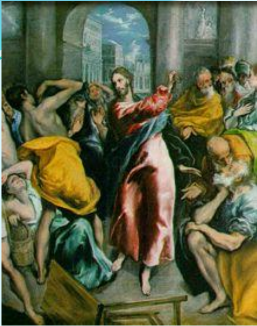
Изгнание торгующих из храма