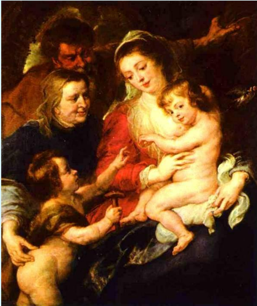
Святое семейство со святыми Елизаветой и Иоанном 1635

Рубенс стал создателем живого, волнующе-яркого стиля художественного выражения, позже названного барокко . Картины Рубенса почти на полвека предвосхитили широкое использование стиля «барокко» художниками в других европейских странах. Яркий, пышный рубенсовский стиль характеризуется изображением крупных тяжелых фигур в стремительном движении, возбужденных до предела эмоционально заряженной атмосферой. Резкие контрасты света и тени, теплые богатые краски, кажется, наделяют его картины кипучей энергией. Он писал грубоватые библейские сцены, стремительную, захватывающую охоту на животных, звонкие ратные побоища, примеры высочайшего проявления религиозного духа, и все это делал с равным пристрастием к перенесению на холст высочайшей жизненной драмы.