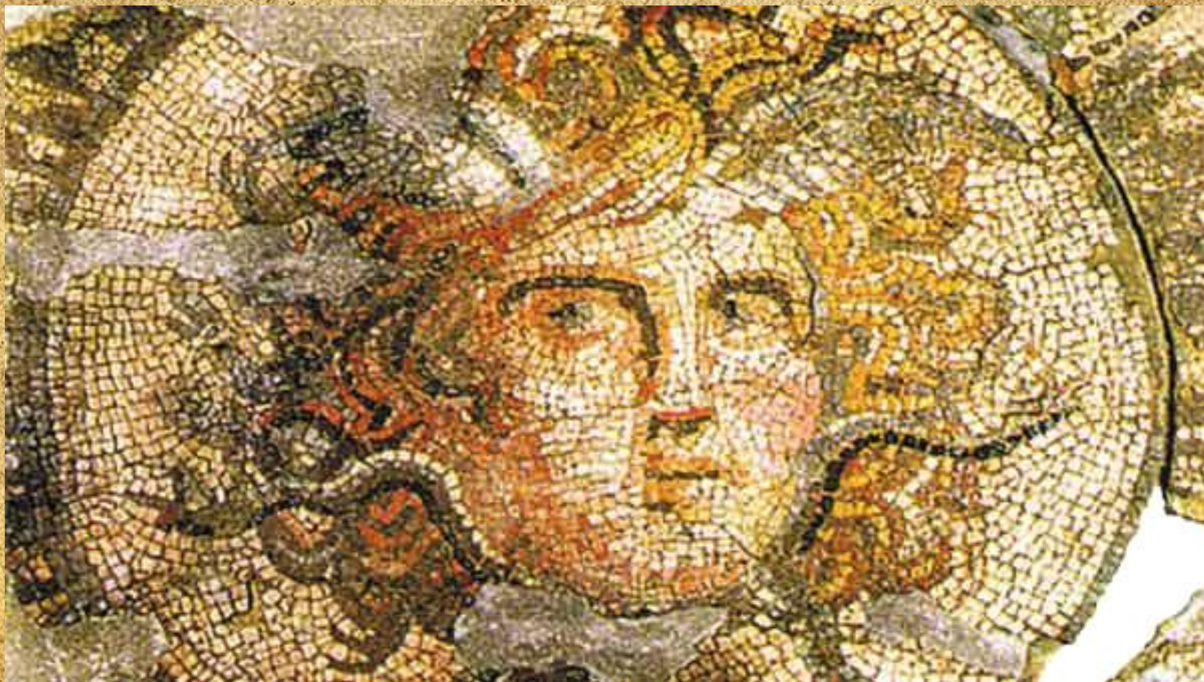
Мозаика из Марцианополя