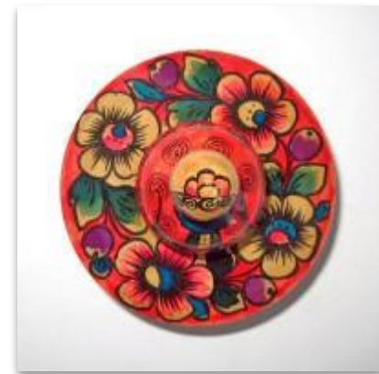
Шкатулка с выжиганием и росписью