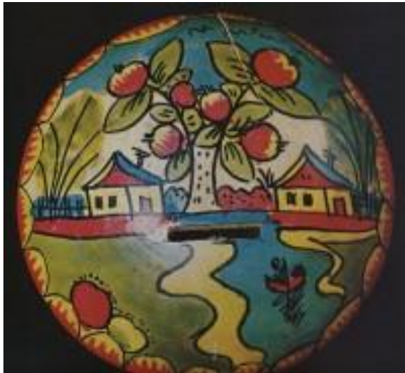
Копилка с сельским пейзажем