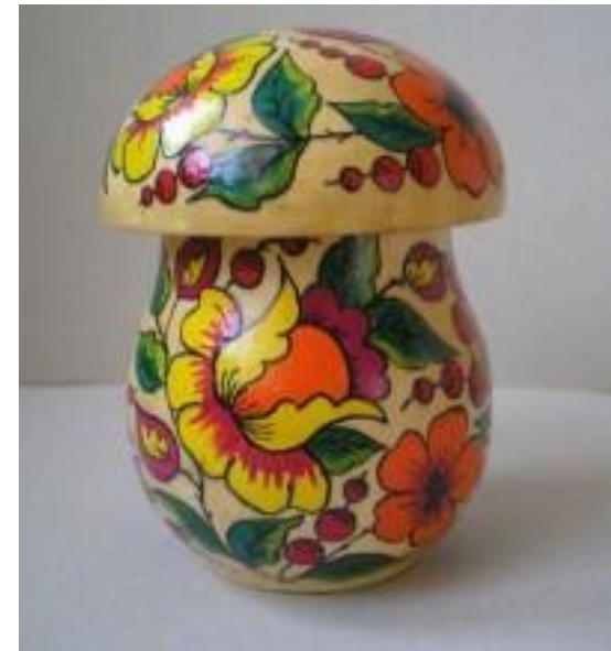
Гриб расписанный в технике полохов-майданской росписи