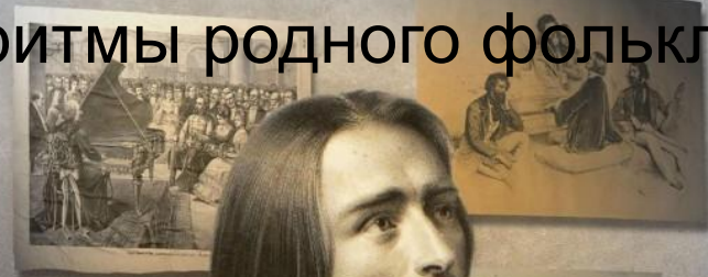
Ференц Лист – венгерский композитор и исполнитель

✓ воплощение образов национальной литературы, истории, родной природы с опорой на интонации и ритмы родного фольклора