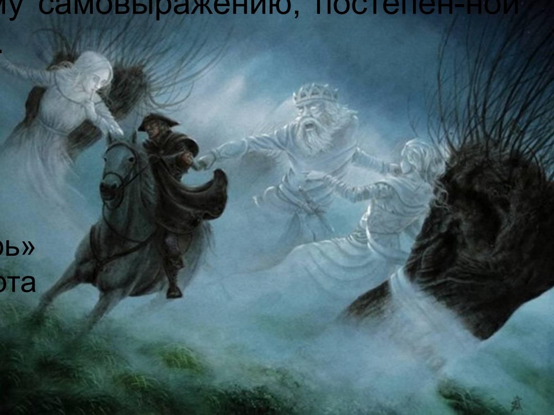
Баллада «Лесной царь» Ф.Шуберта