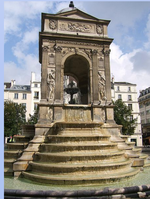
«Фонтан невинных» в Париже