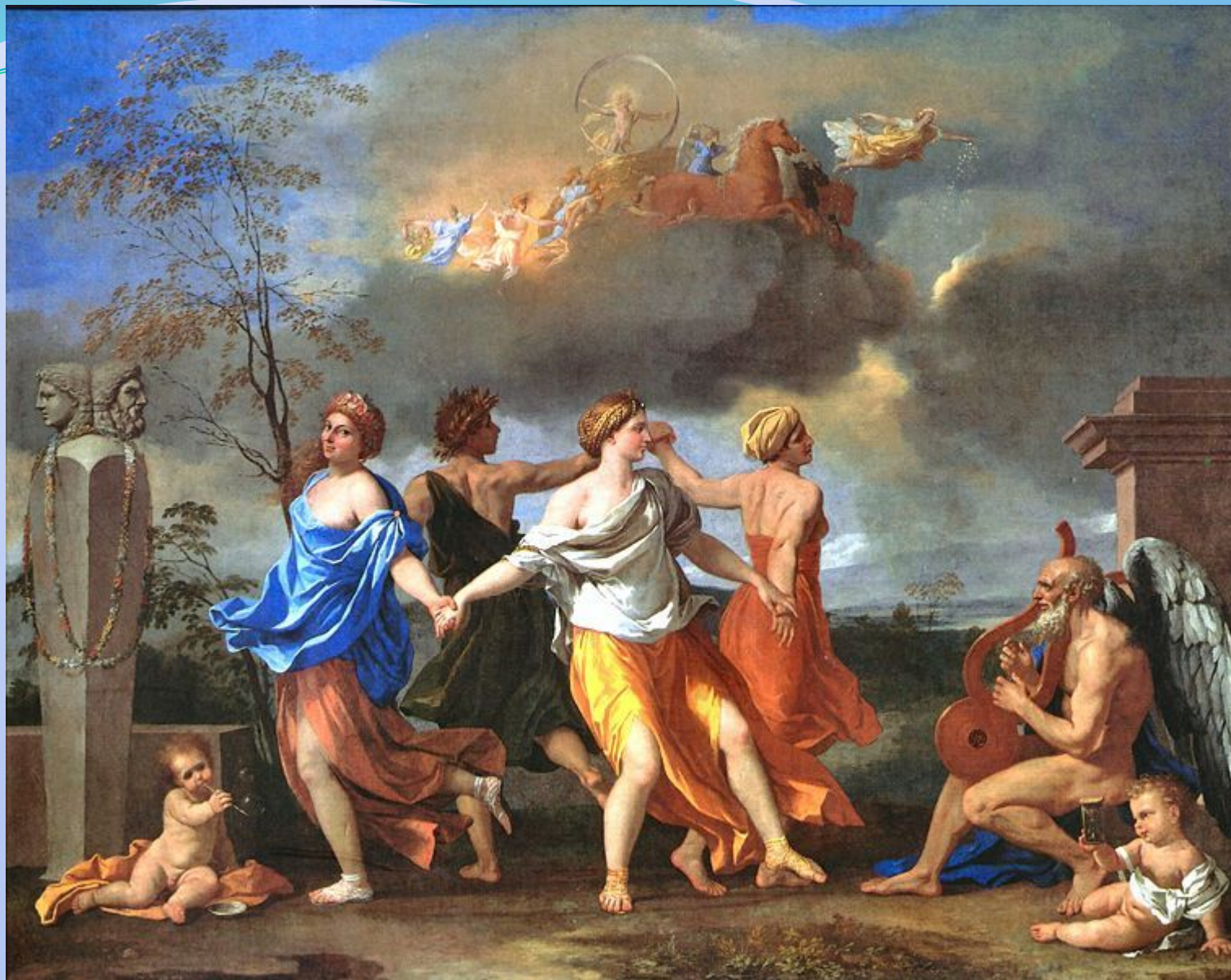
Никола Пуссен. «Танец под музыку времени»