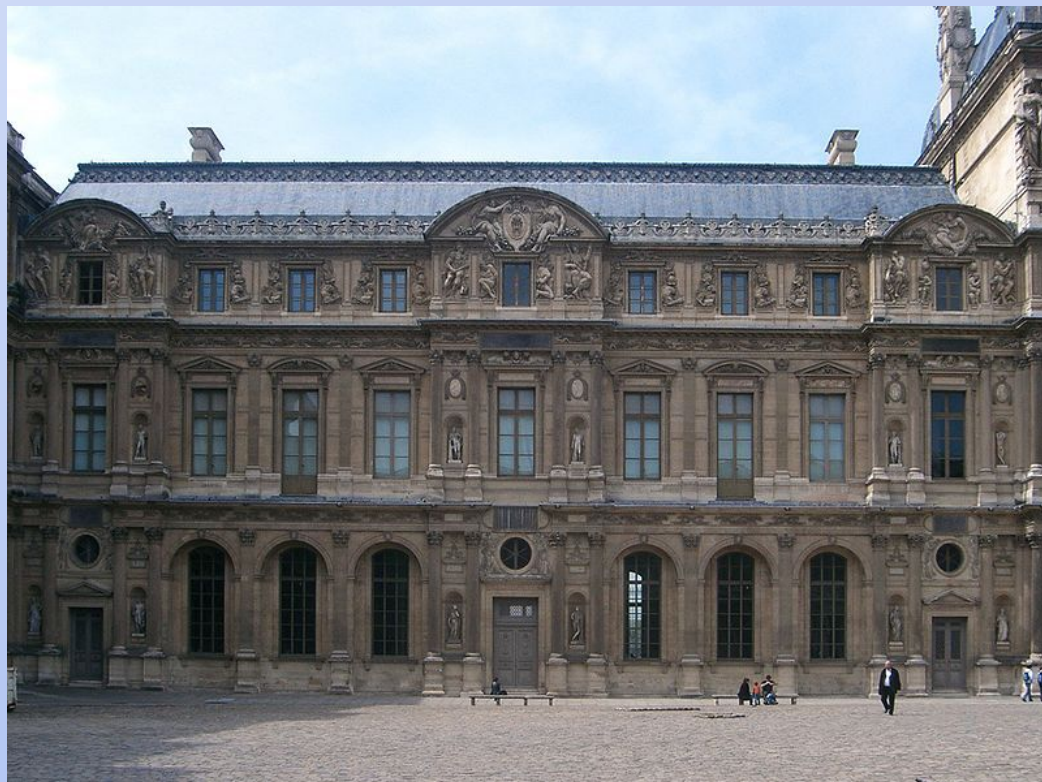
Западное крыло «квадратного двора» Лувра

Жан Гужон (ок.1510-1520—ок.1563-1568) французский скульптор, архитектор, график.