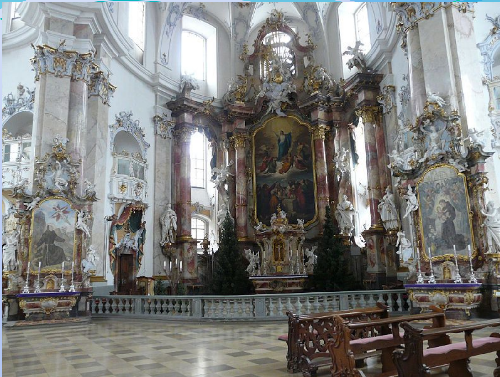
Баварское рококо: базилика Фирценхайлиген.