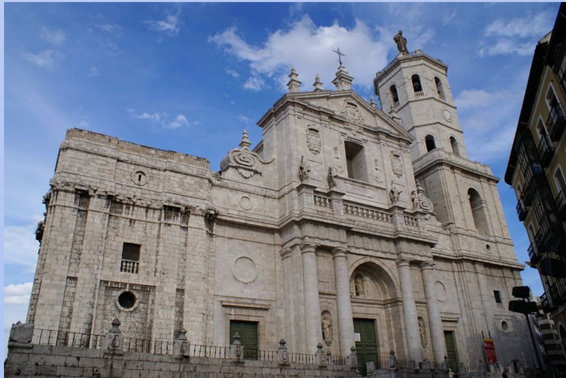
Собор в Вальядолиде

Хуан Баутиста де Эррера (1530-1597) испанский архитектор и учёный, представитель Позднего Возрождения, создатель «неукрашенного» стиля ренессансного зодчества