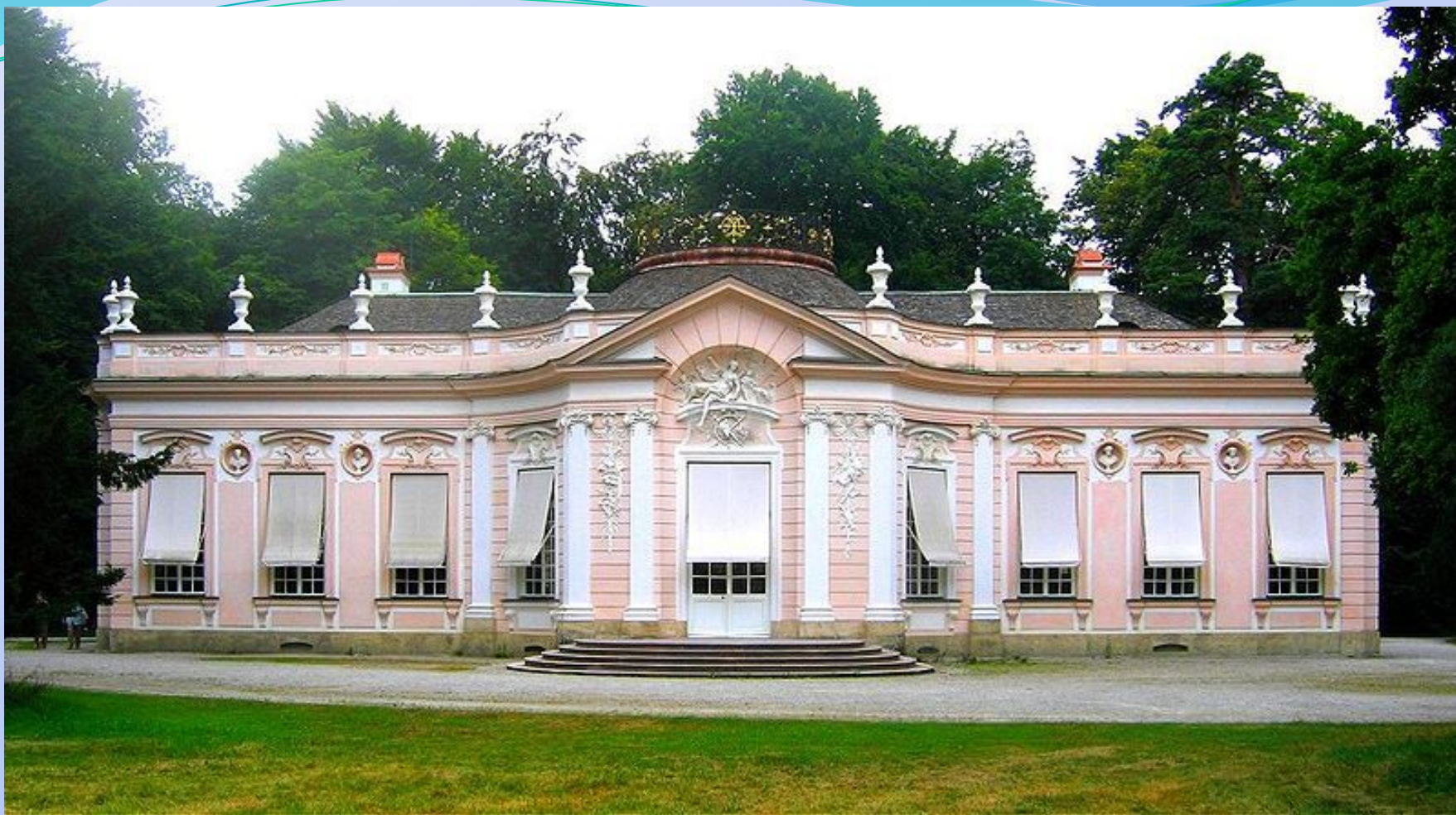
Французское рококо: Амалиенбург под Мюнхеном.