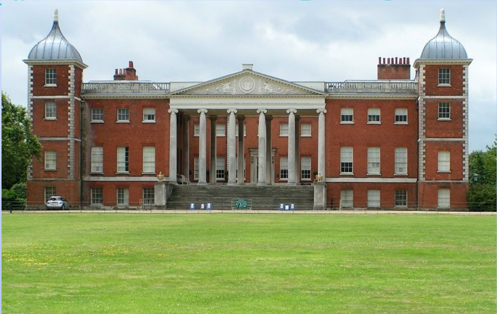
Пример британского палладианизма — лондонский особняк Остерли-парк