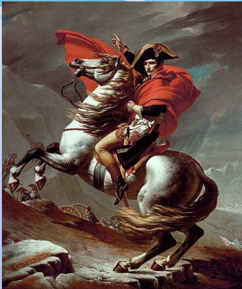
Наполеон на перевале Сен-Бернар