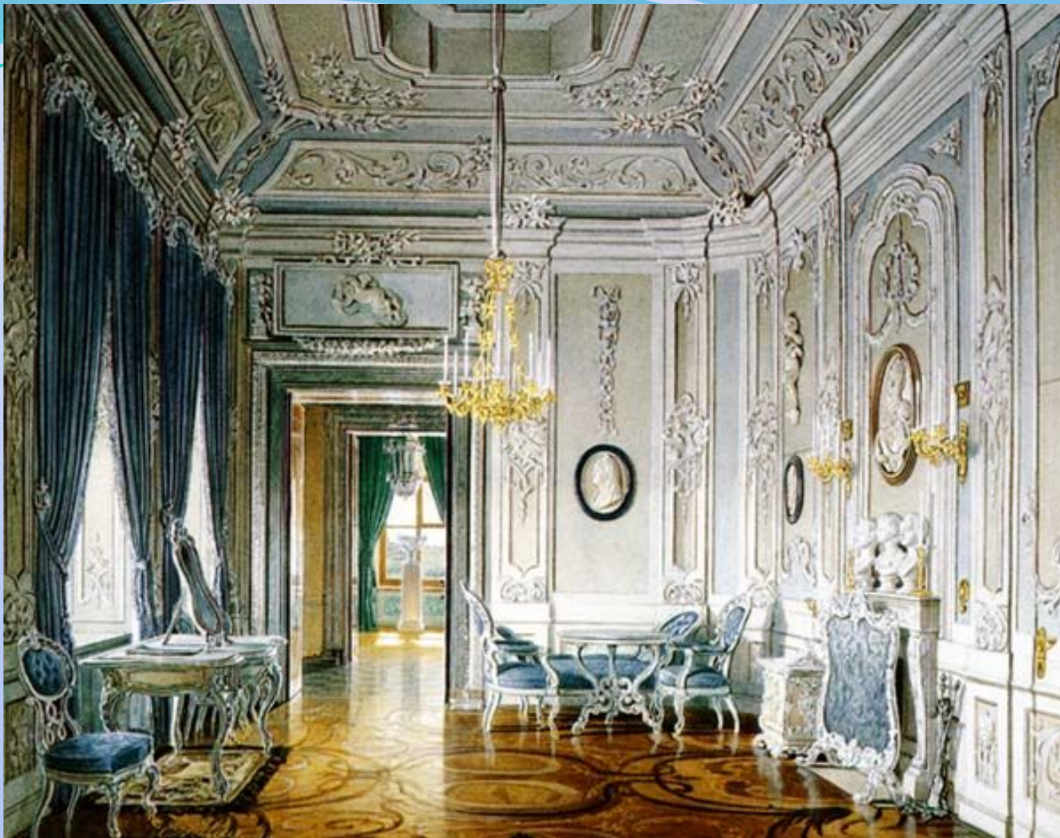
Ринальдиевское рококо: интерьеры Гатчинского замка.