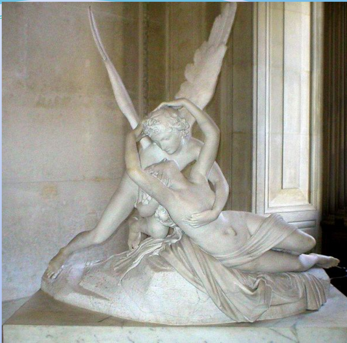
Антонио Канова. Амур и Психея