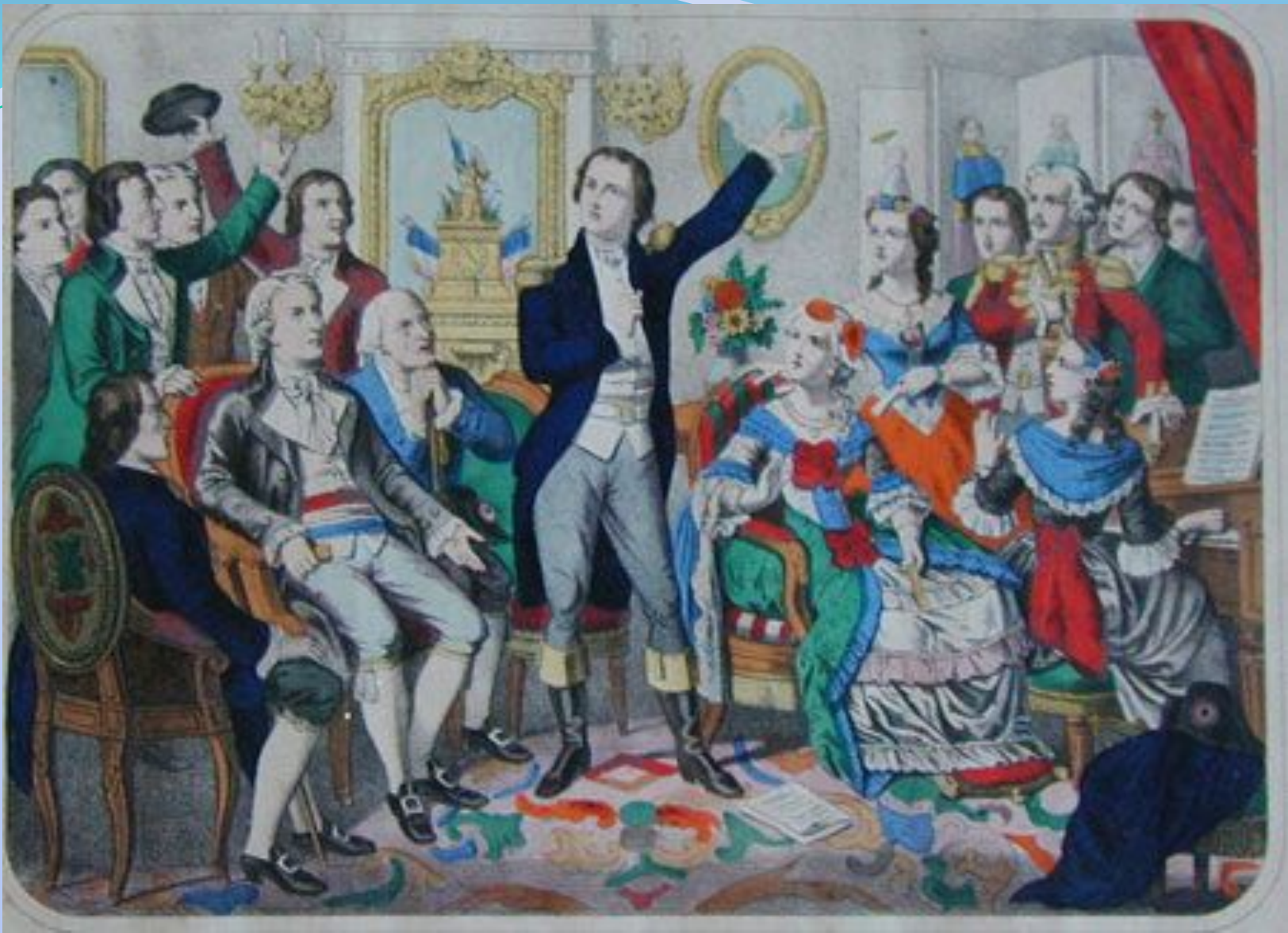
Руже де Лиль, автор музыки к Марсельезе, впервые исполняет свое произведение.