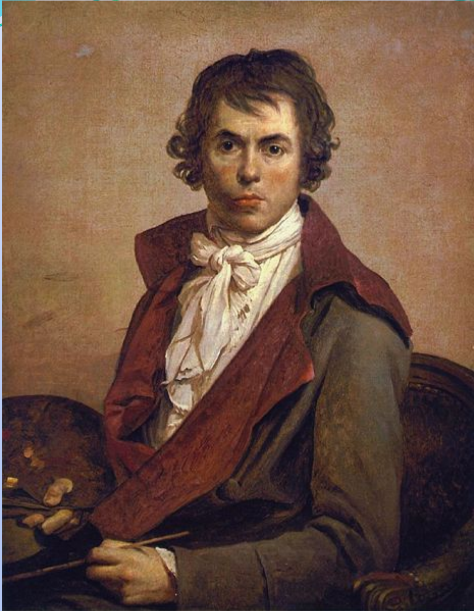
Жак Луи Давид (1748-1825) французский художник