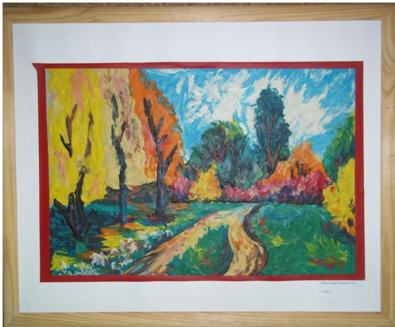
Юлияна Козина 140 «Лес»