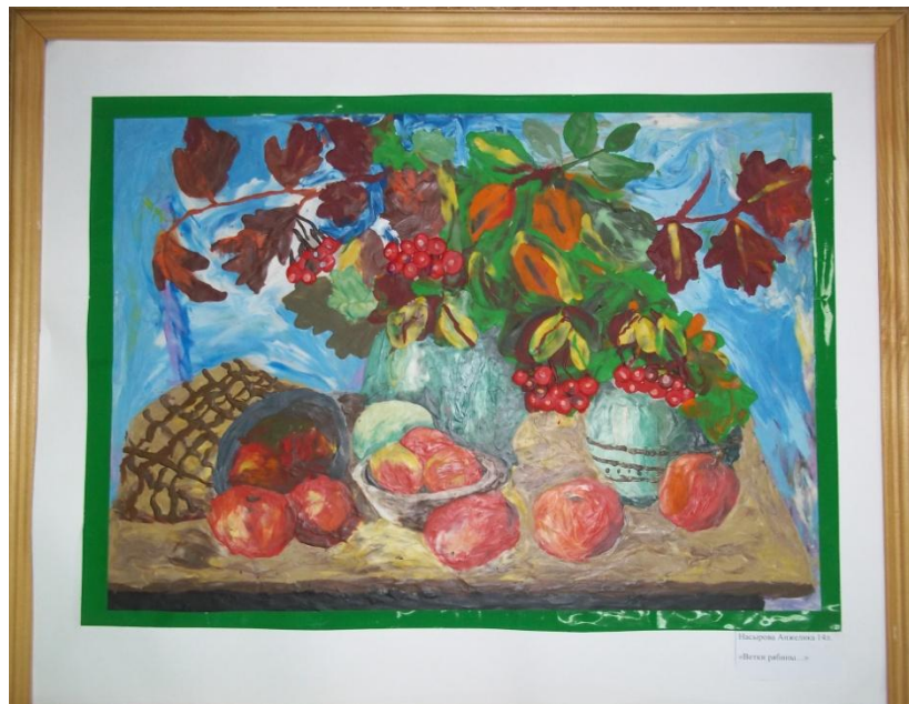
Насарови Аристана 140 «Фрукты на столе»