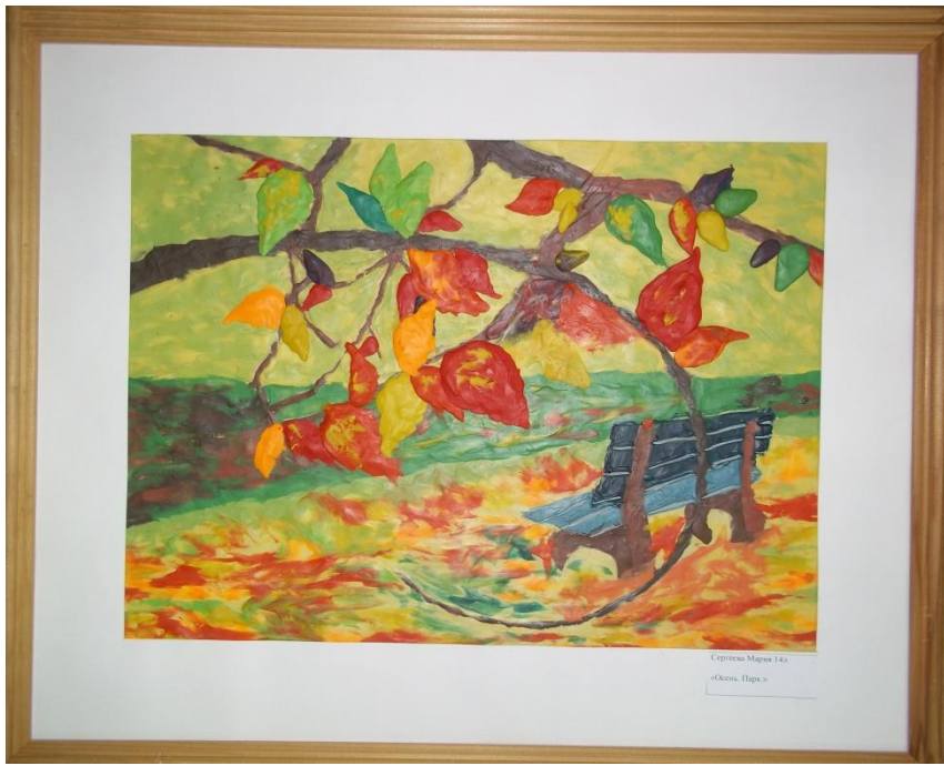
Сиреневый Море 143 «Осен. Парк»