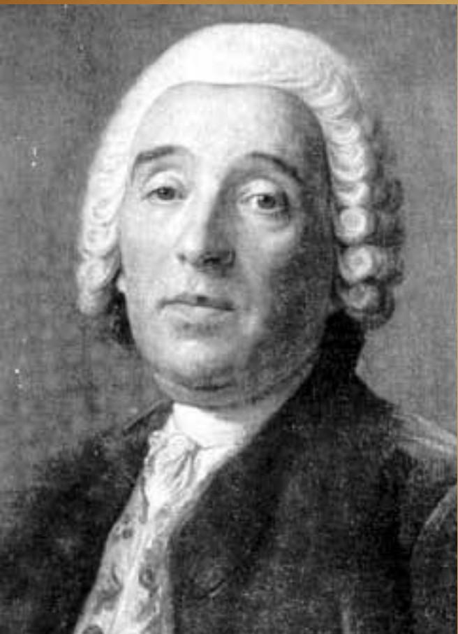
Бартоломе о Карло

Отец Франческо, Бартоломео Карло в конце 1715 года принял предложение от российского посла поехать в Россию на три года на службу к Петру I.